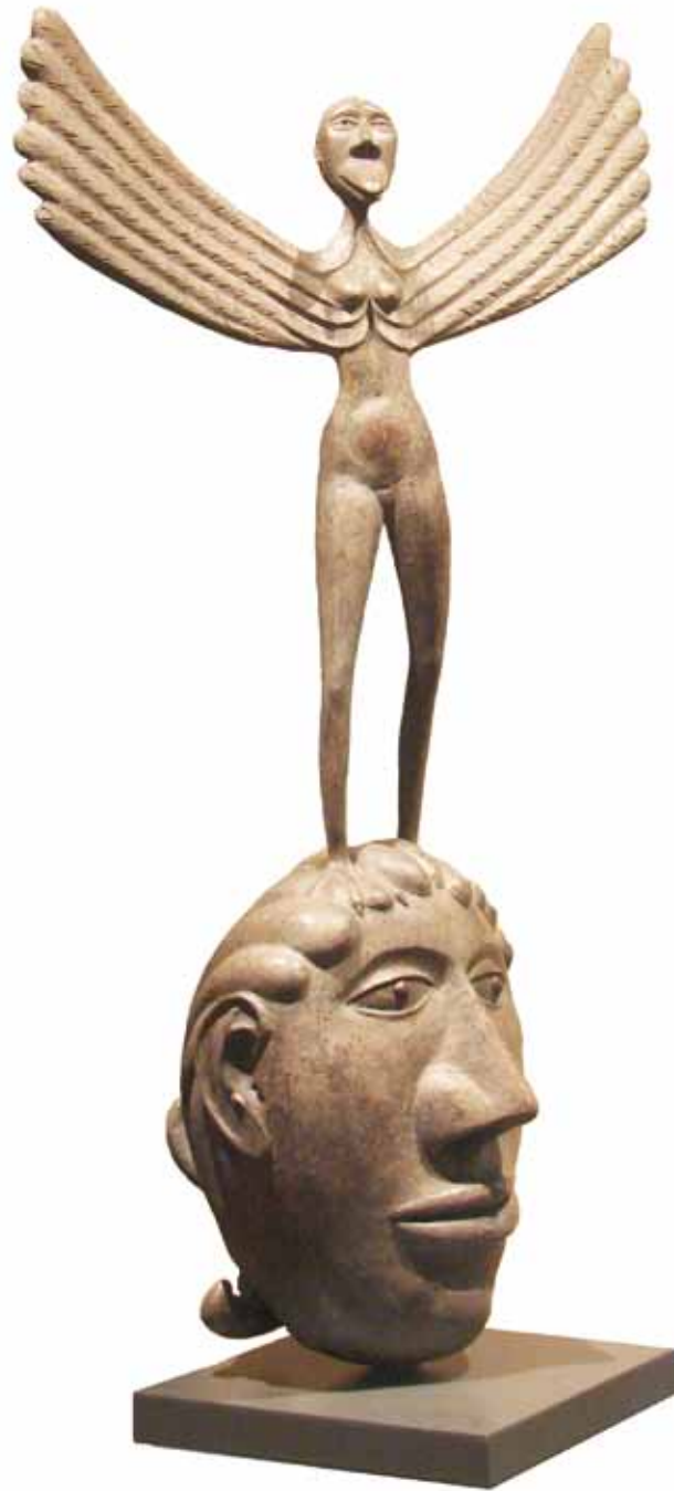
“Mujer garza” 0.90 m largo, 1.65 m alto, 0.55 m ancho Técnica Mixta