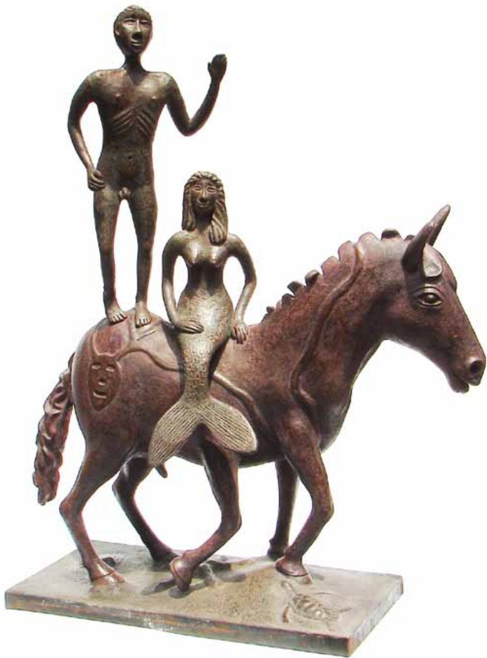
“Sueños realizados” 0.80 m largo, 0.95 m alto, 0.30 m ancho Técnica Mixta