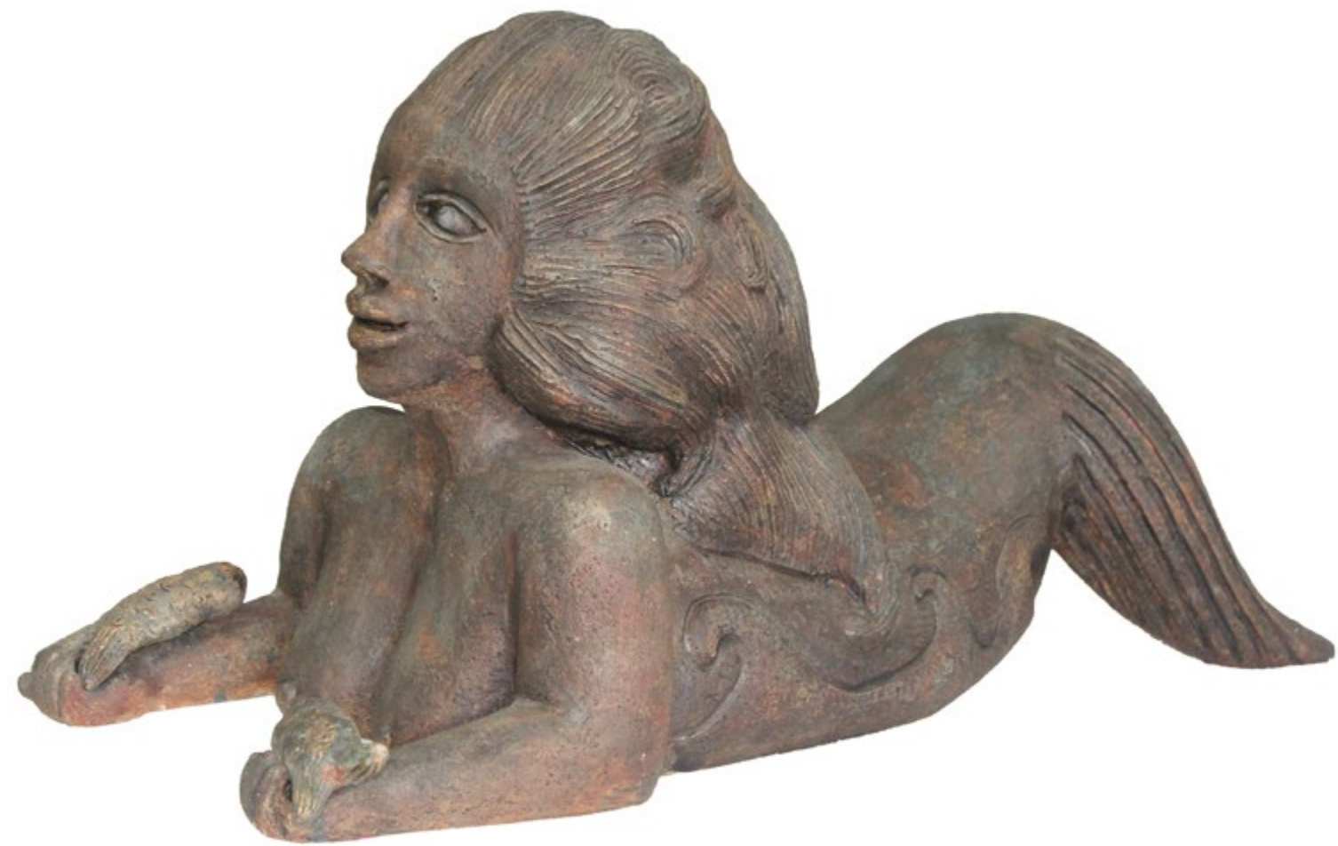
Sirena con Peces Alt. 60 cm, anch. 48 cm, prof. 50 cm Barro de alta temperatura