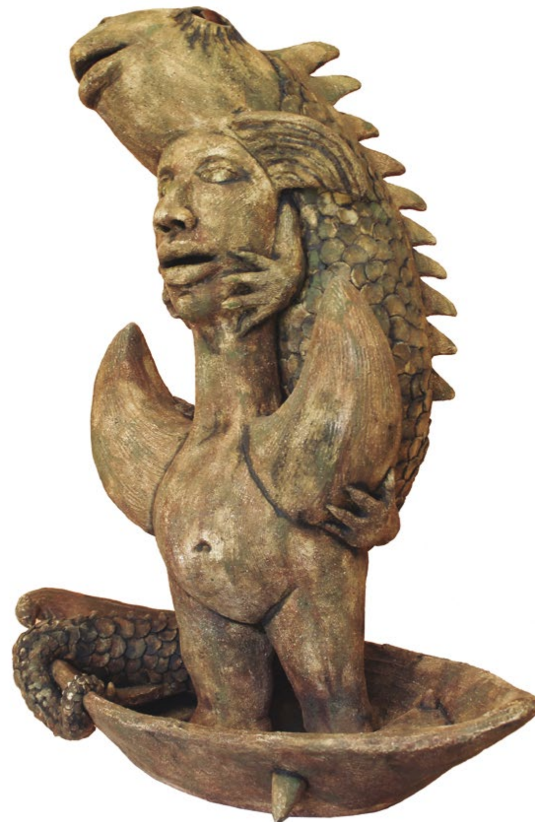
Hombre luna en barquita Alt. 59 cm, anch. 61 cm, prof. 31 cm Barro de alta temperatura