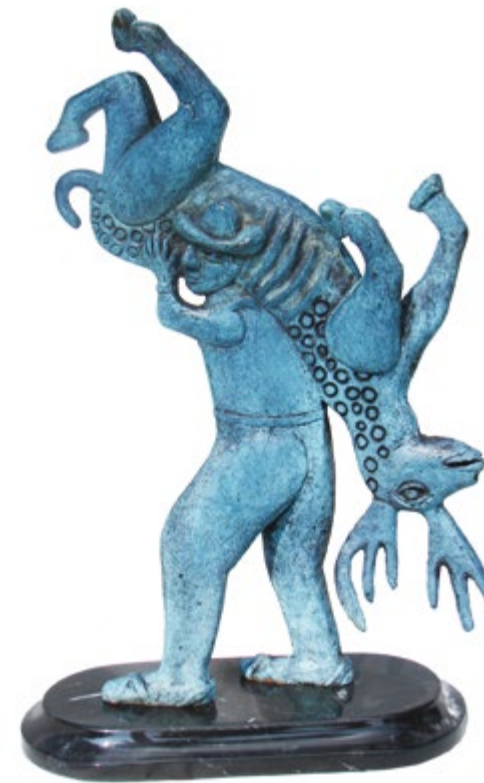
Gelasio con venado