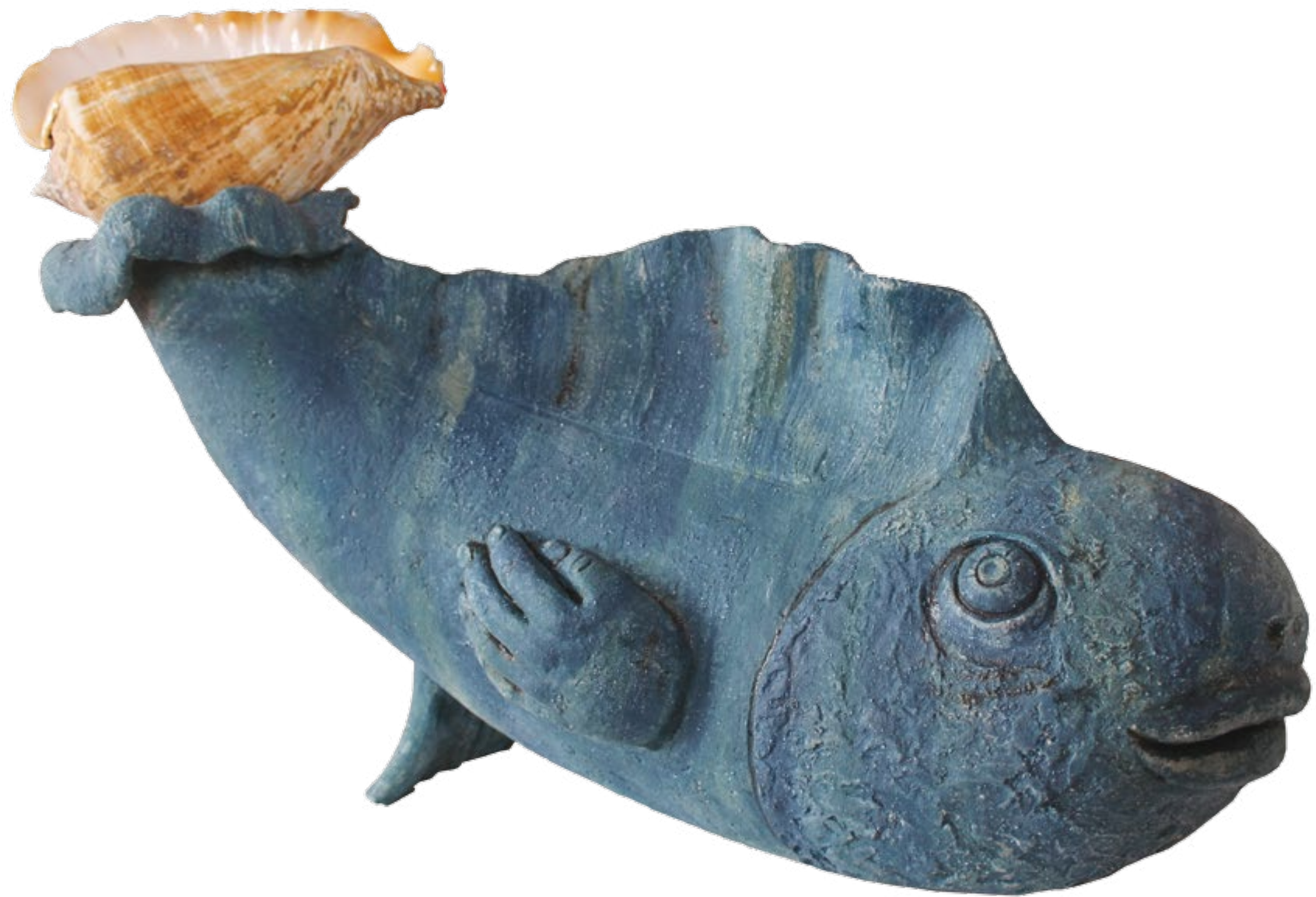
Pez azul con caracol Alt. 40 cm, anch. 32 cm, prof. 58 cm Barro de alta temperatura