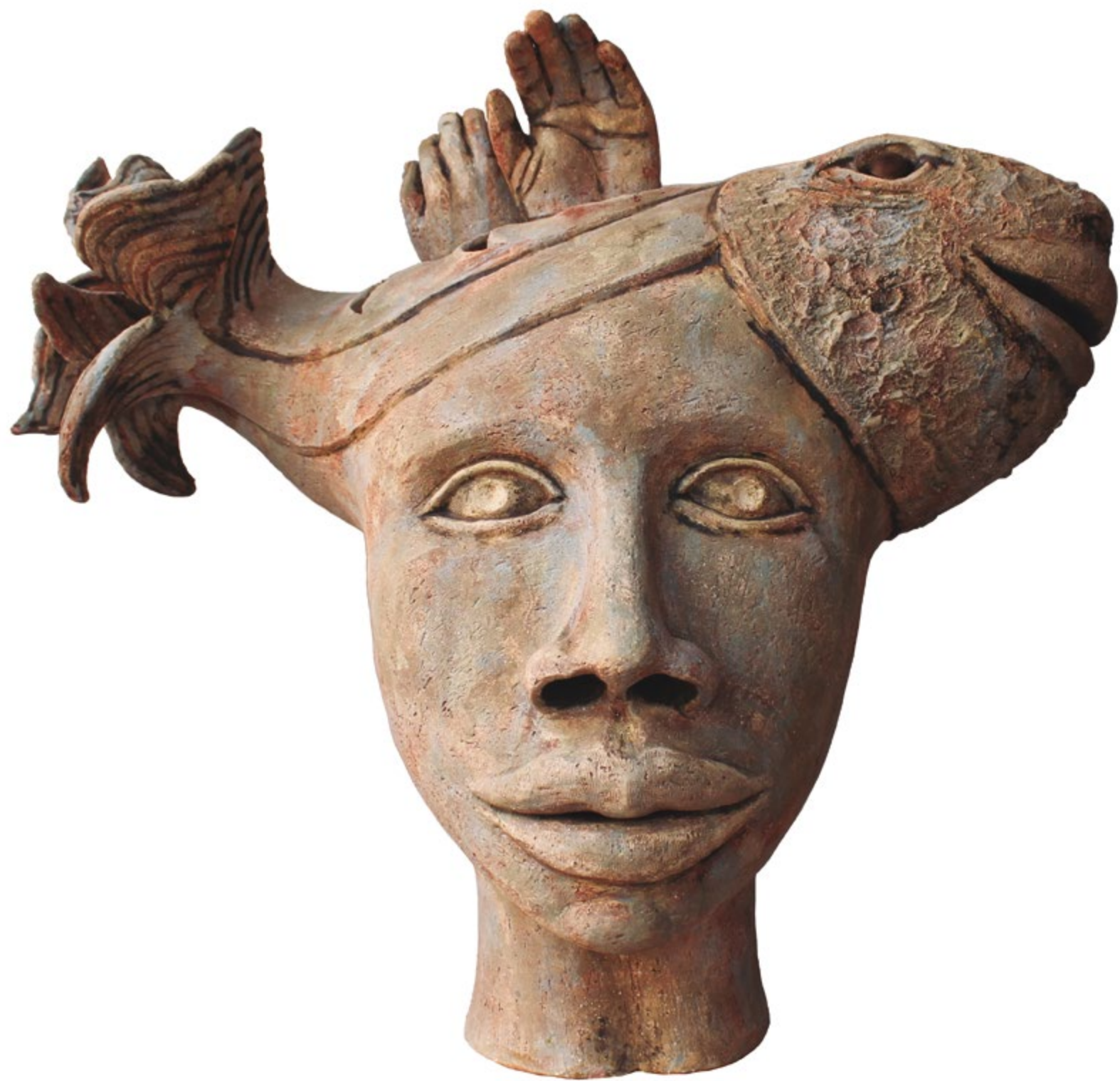
Cabeza con aletas de mano Alt. 60 cm, anch. 70 cm, prof. 42 cm Barro de alta temperatura