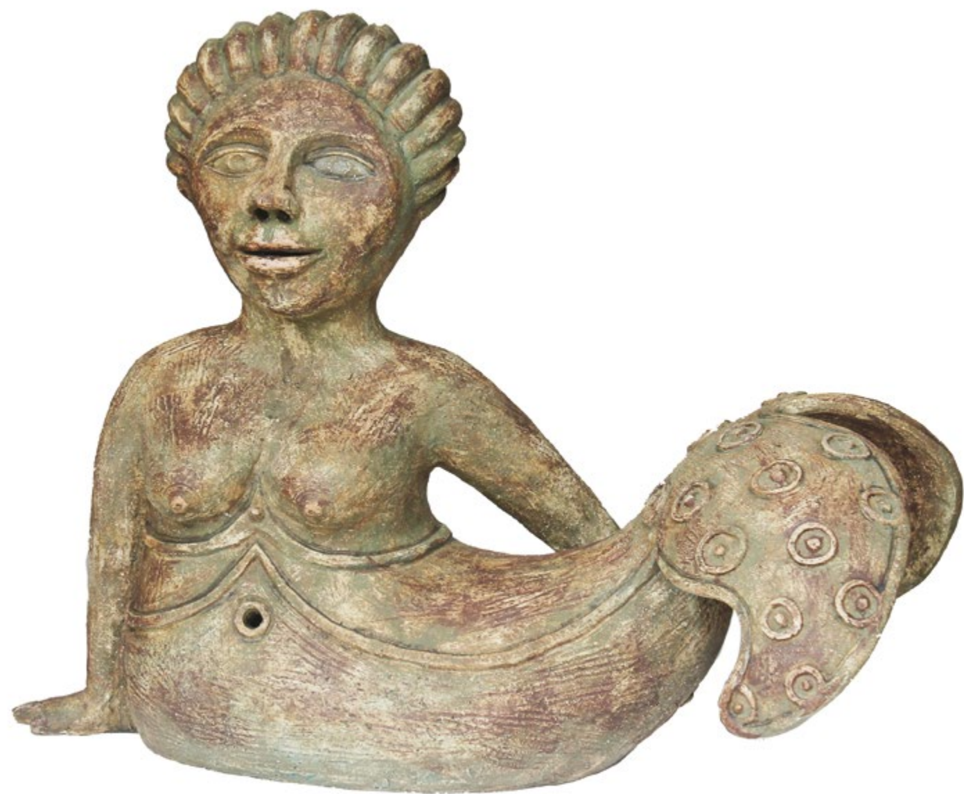
Sirenita Conchita Alt. 46 cm, anch. 57 cm, prof. 28 cm Barro de alta temperatura