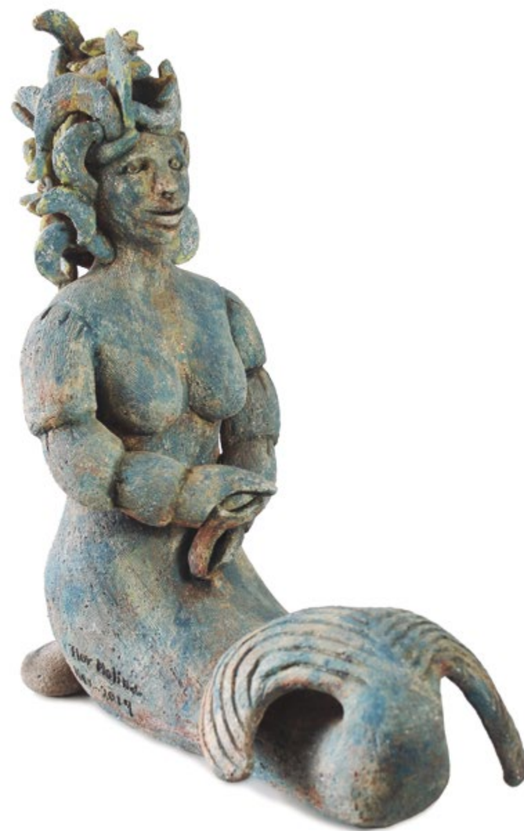
Sirena cangrejita 43 cm alt. 20 cm anch. 32 cm prof. Barro de alta temperatura