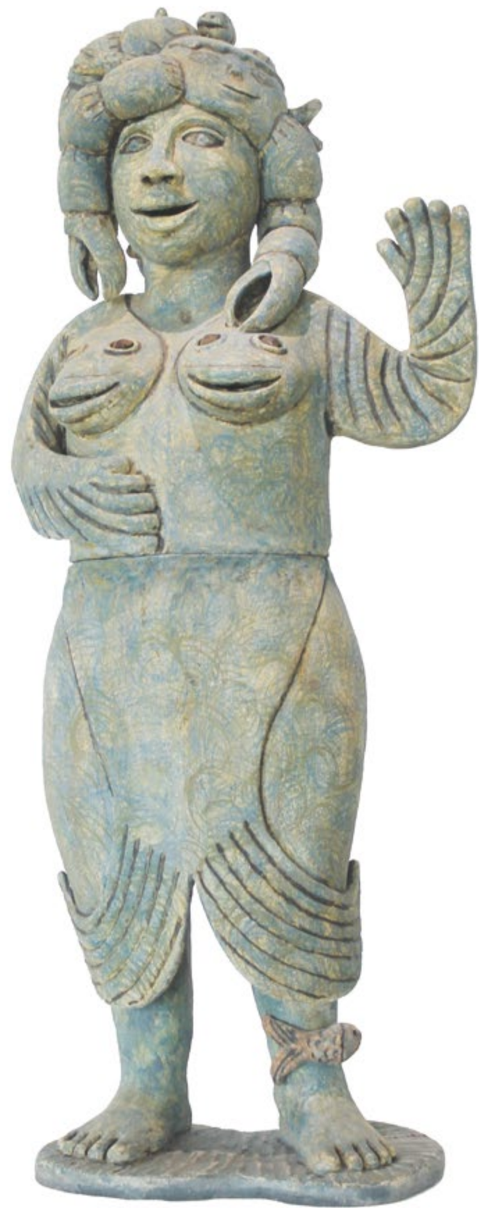
Alegria Alt. 135 cm, anch. 55 cm, prof. 30 cm Barro de alta temperatura