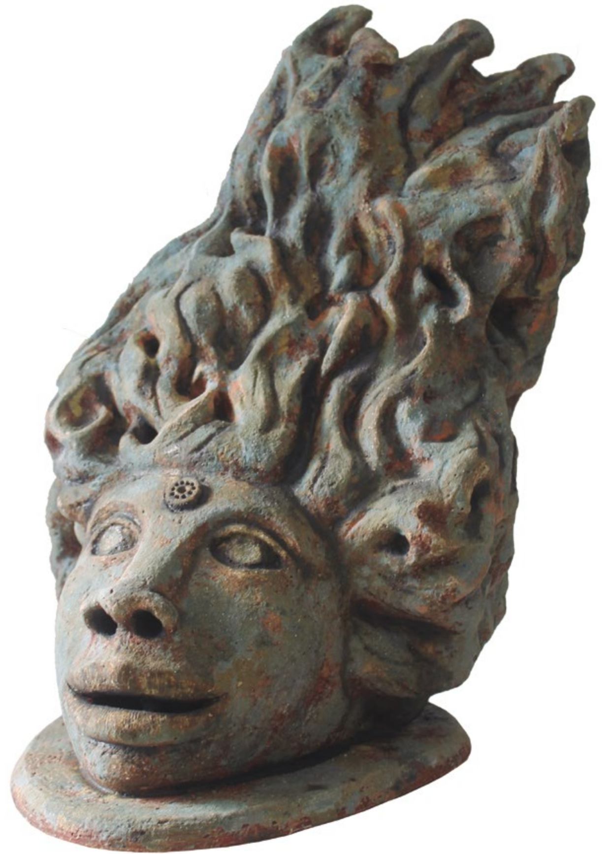
Mujer de viento Alt. 38 cm, anch. 39 cm, prof. 29 cm Barro de alta temperatura