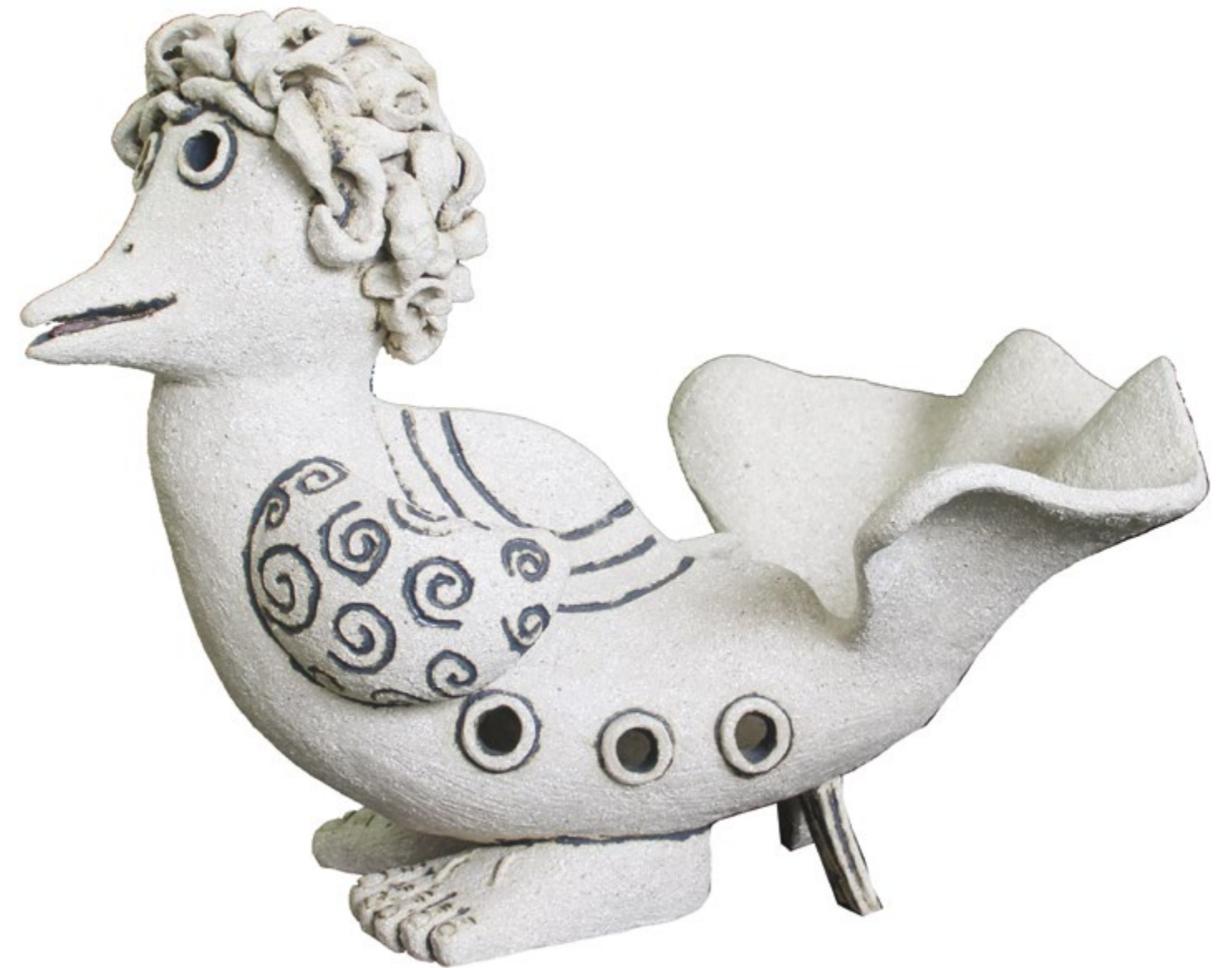
Pajarita Conchita Alt. 28 cm, anch. 24 cm, prof. 33 cm Barro de alta temperatura