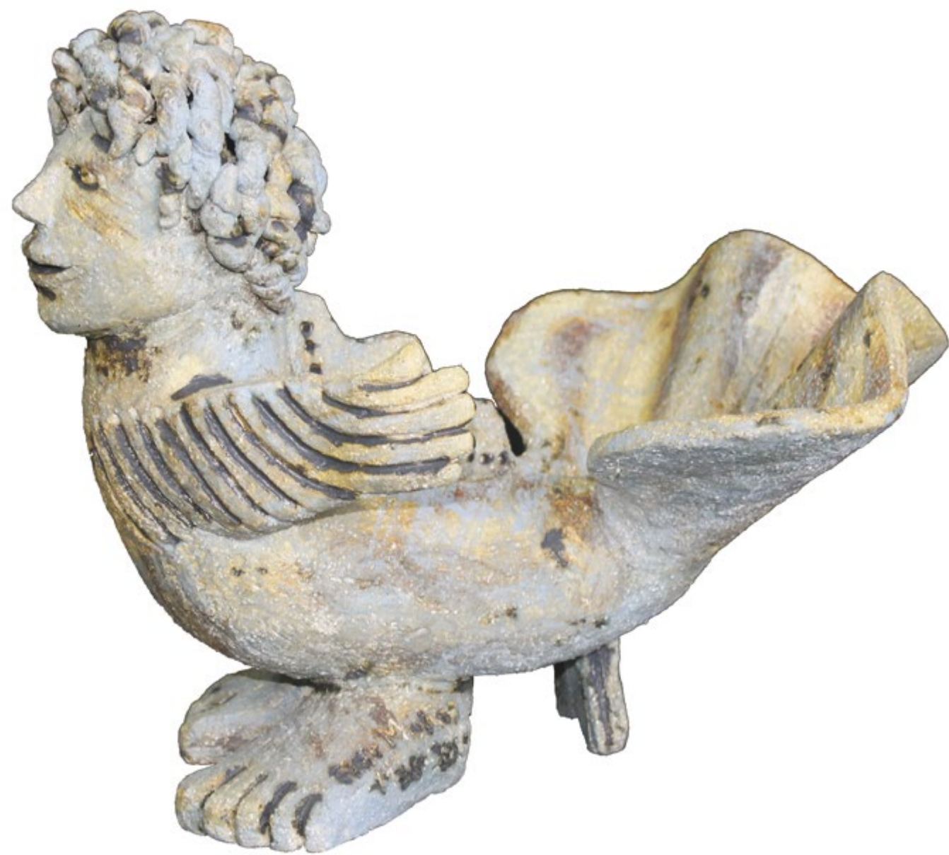
Mujer Conchita Alt. 34 cm, anch. 18 cm, prof. 26 cm Barro de alta temperatura