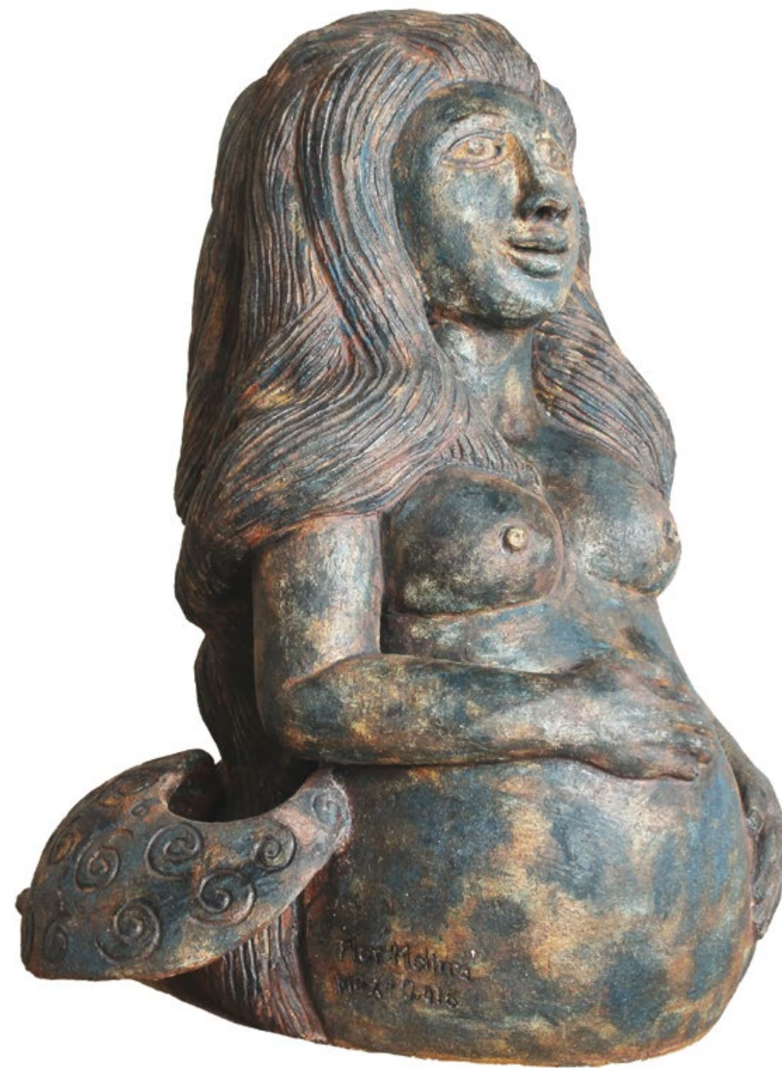
Sirena embarazada Alt. 72 cm, anch. 52 cm, prof. 54 cm Barro de alta temperatura