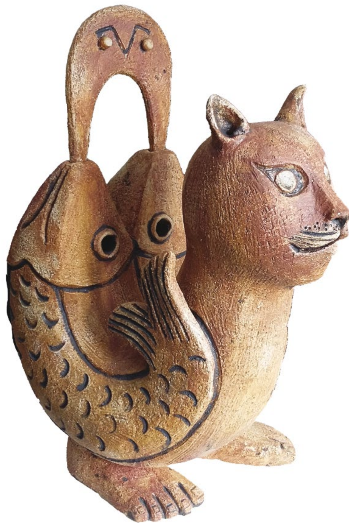
Gato Pez Alt. 65 cm, anch. 34 cm, prof. 46 cm Barro de alta temperatura