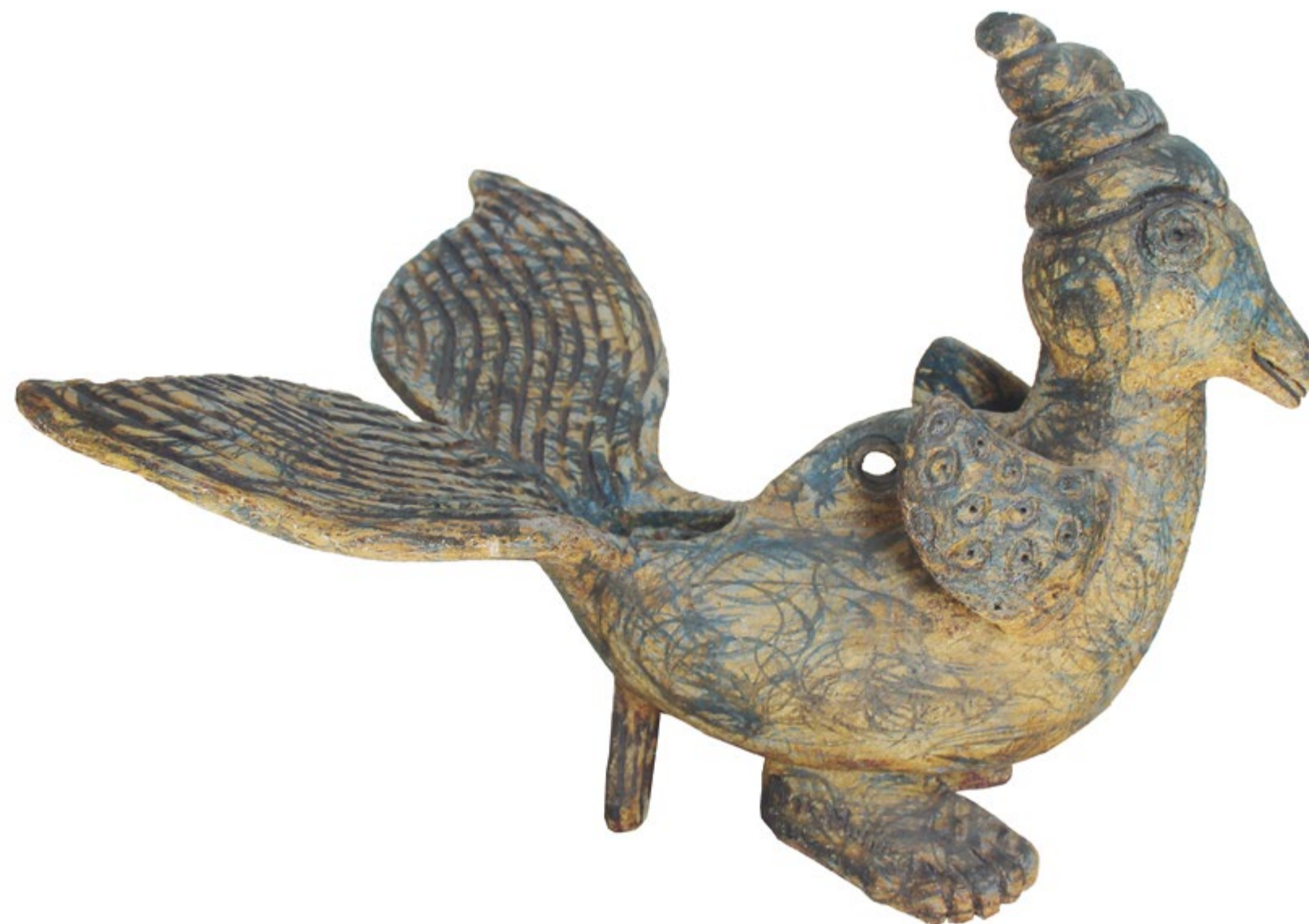
Pato Pez Alt. 32 cm, anch. 32 cm, prof. 42 cm Barro de alta temperatura