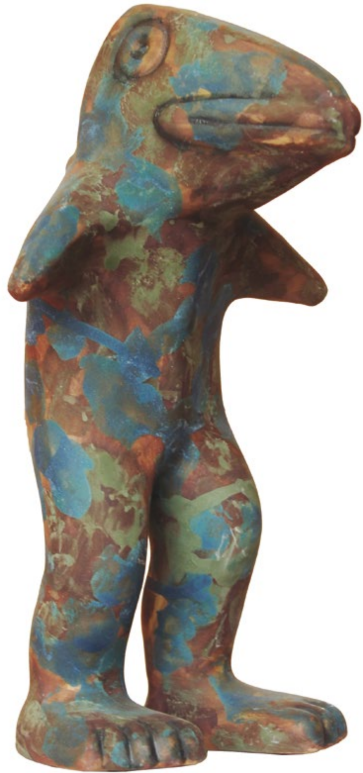
Hombre Pez Alt. 29 cm, anch. 17 cm, prof. 9 cm Cerámica de alta temperatura