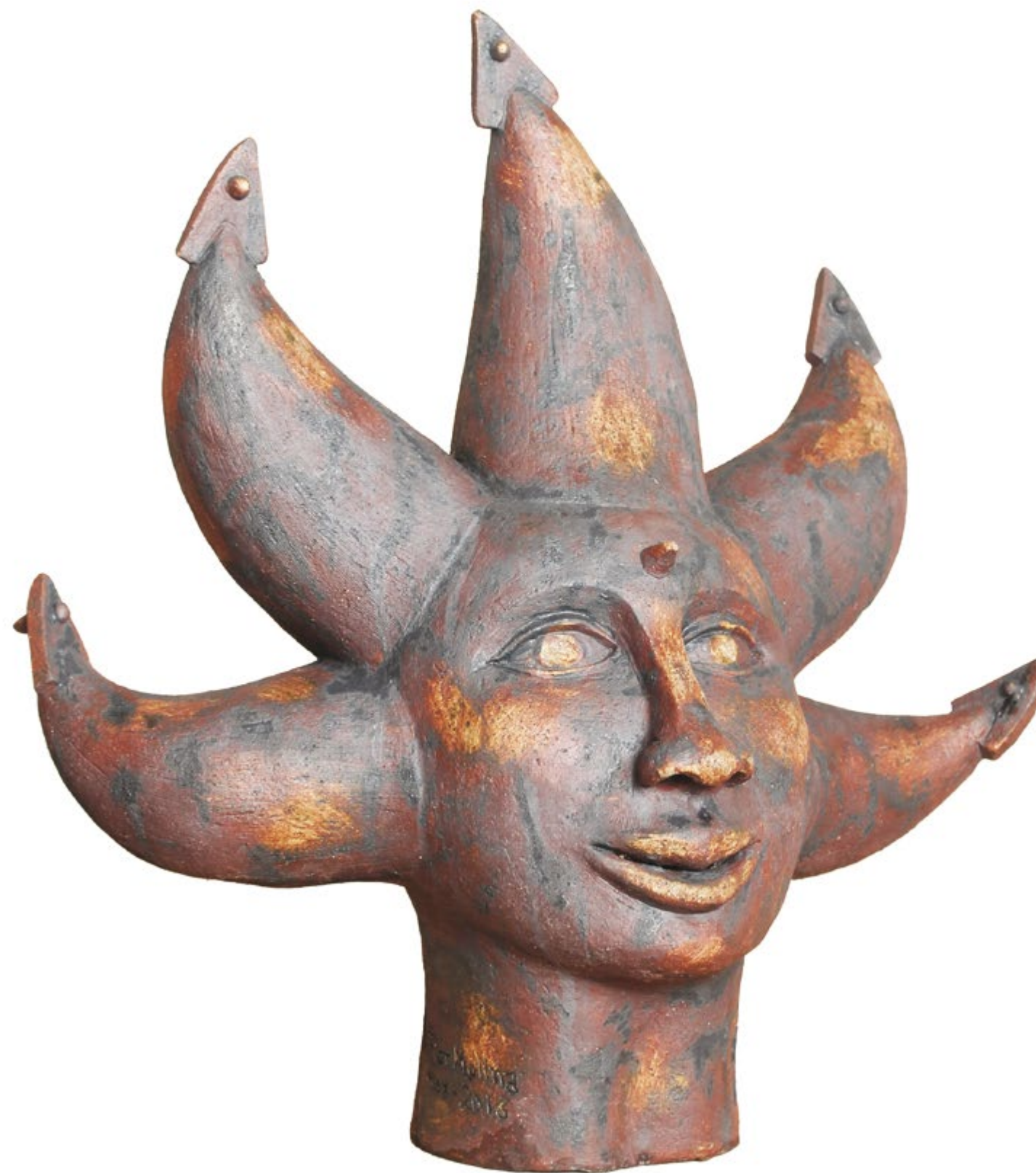
Estrella Alt. 63 cm, anch. 63 cm, prof. 35 cm Barro de alta temperatura