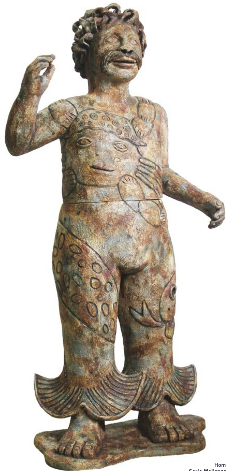
▲ Pancho Alt. 118 cm, anch. 55 cm, prof. 30 cm Barro de alta temperatura