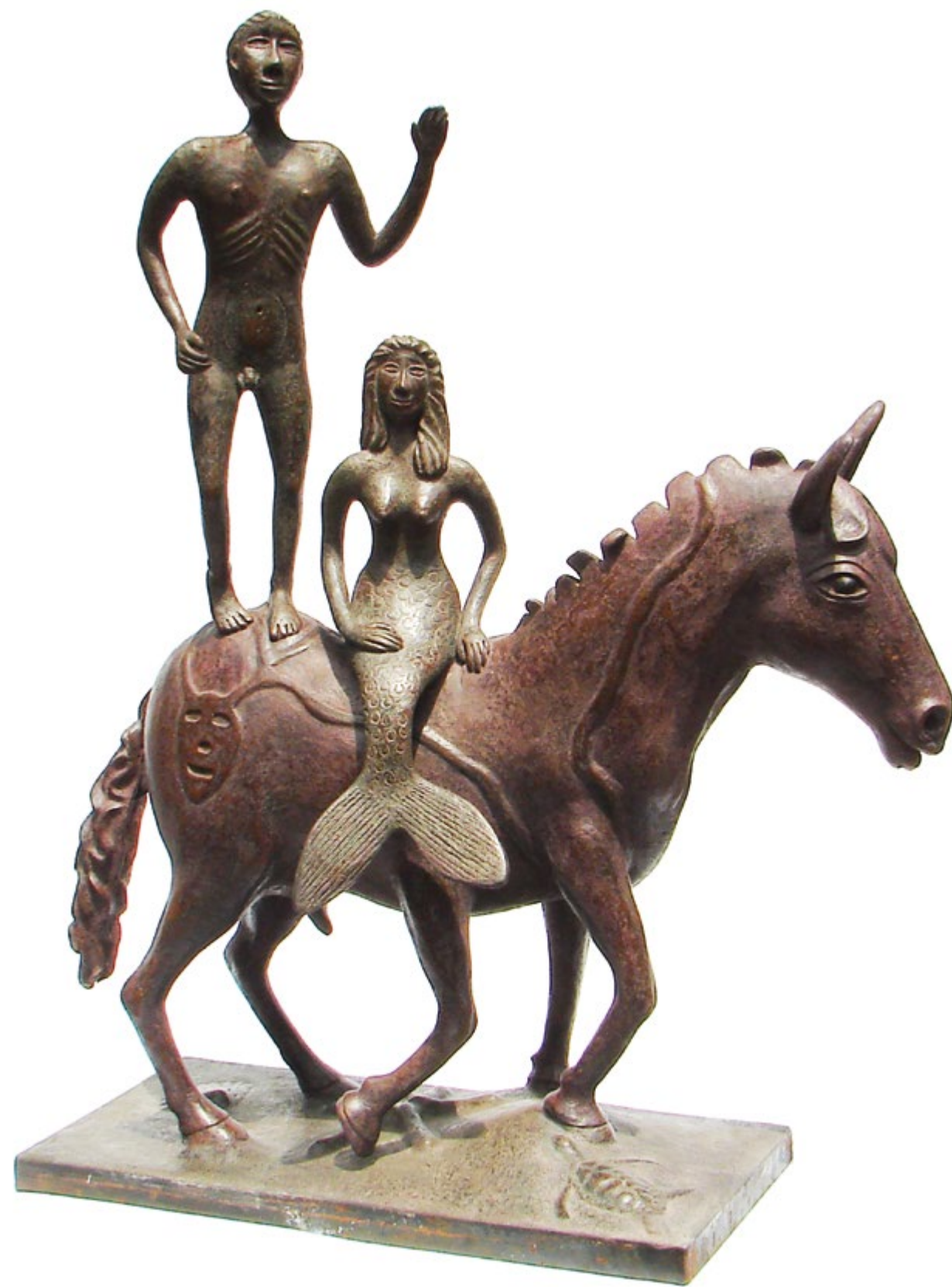
Sueños realizados 80 cm anch. 95 cm alt. 30 cm prof. Técnica Bronce