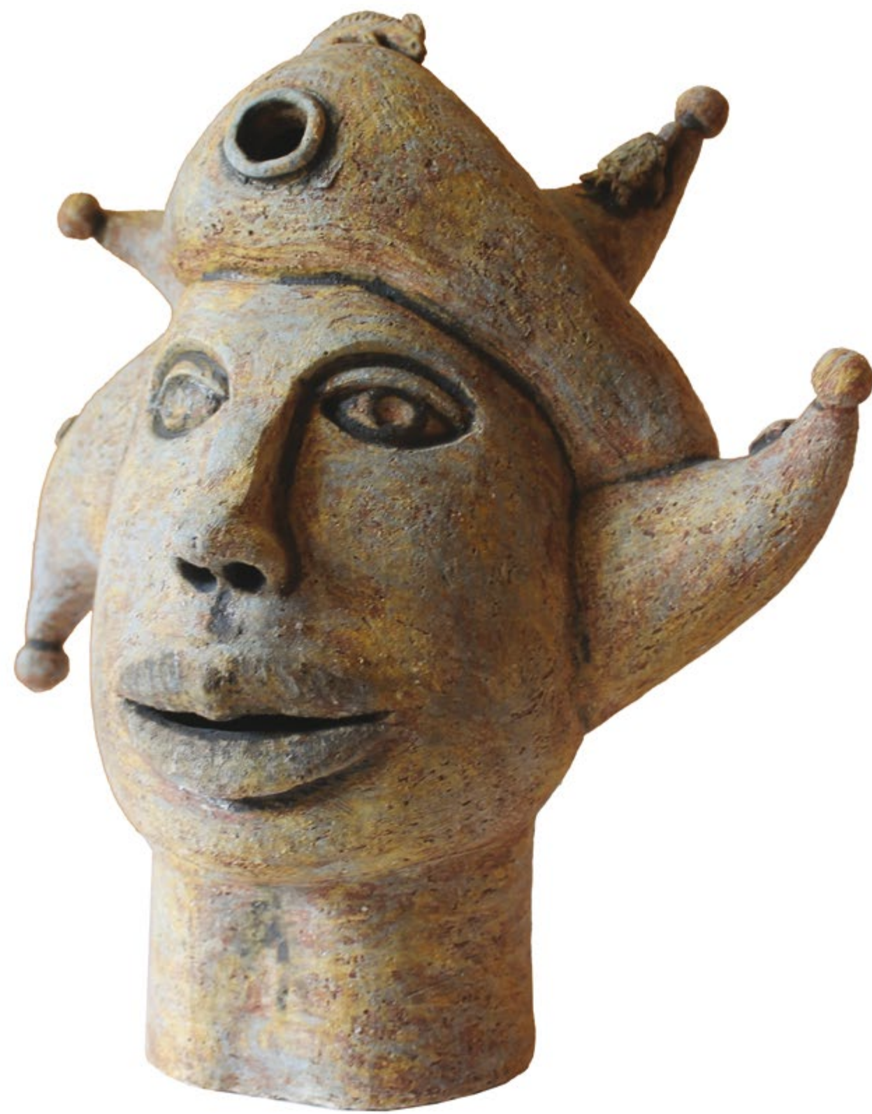
Marinero Alt. 40 cm, anch. 42 cm, prof. 28 cm Barro de alta temperatura