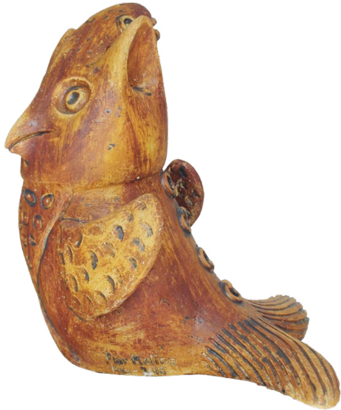
Buhito Pez Alt. 38 cm, anch. 29 cm, prof. 33 cm Barro de alta temperatura