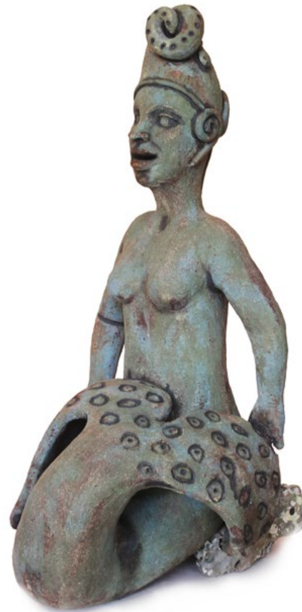
Sirena con caracol 54 cm alt. 25 cm anch. 33 cm prof. Barro de alta temperatura