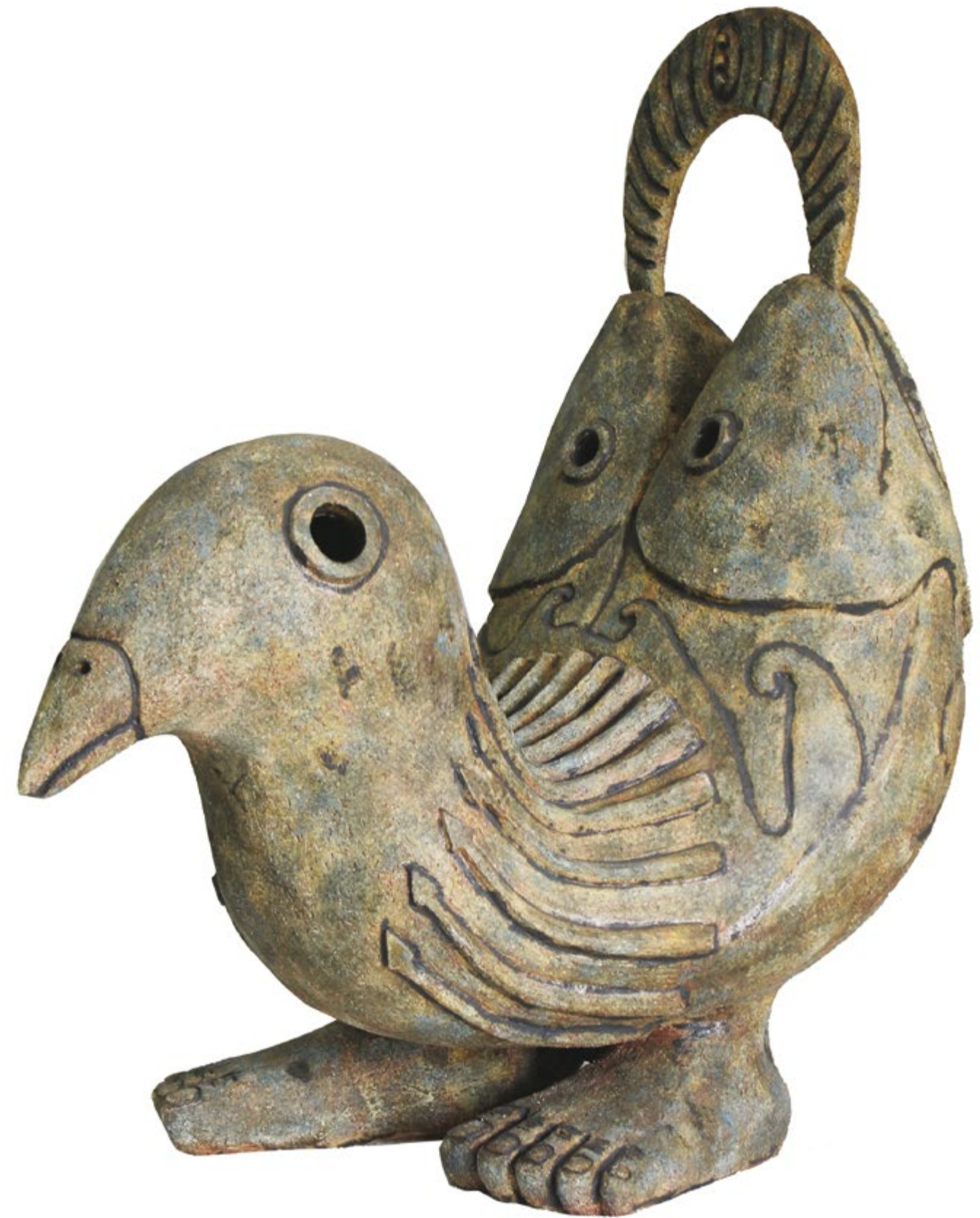
Pájaro Pez Alt. 68 cm, anch. 40 cm, prof. 64 cm Barro de alta temperatura