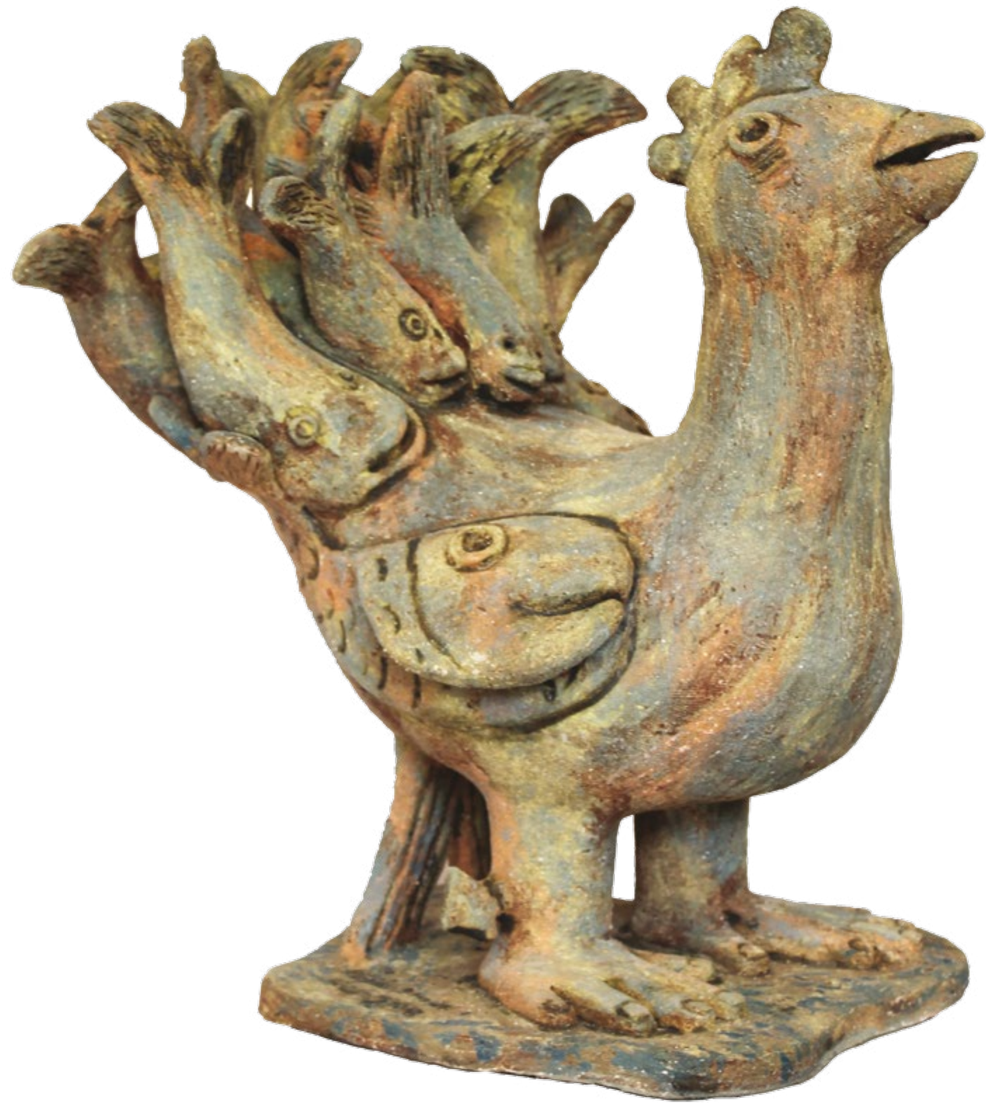
Gallo Pez II Alt. 56 cm, anch. 60 cm, prof. 38 cm Barro de alta temperatura