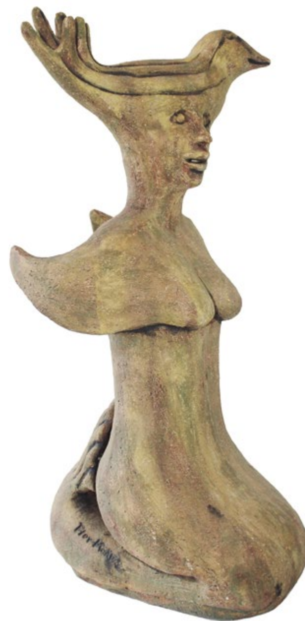
Sirena con pelo de ave 53 cm alt. 27 cm anch. 27 cm prof. Barro de alta temperatura