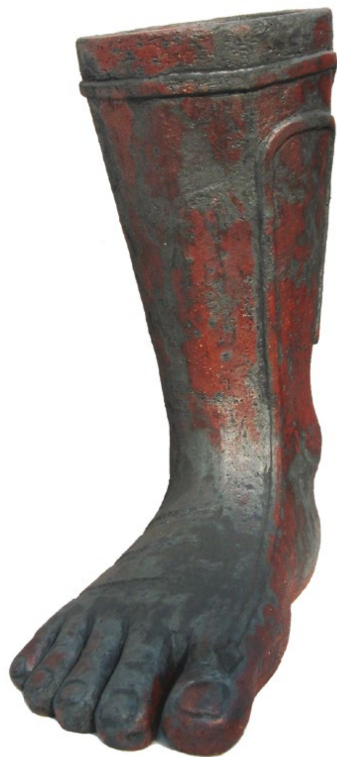
Estudio X Alt. 45 cm, prof. 28 cm, anch. 14 cm Barro de alta temperatura