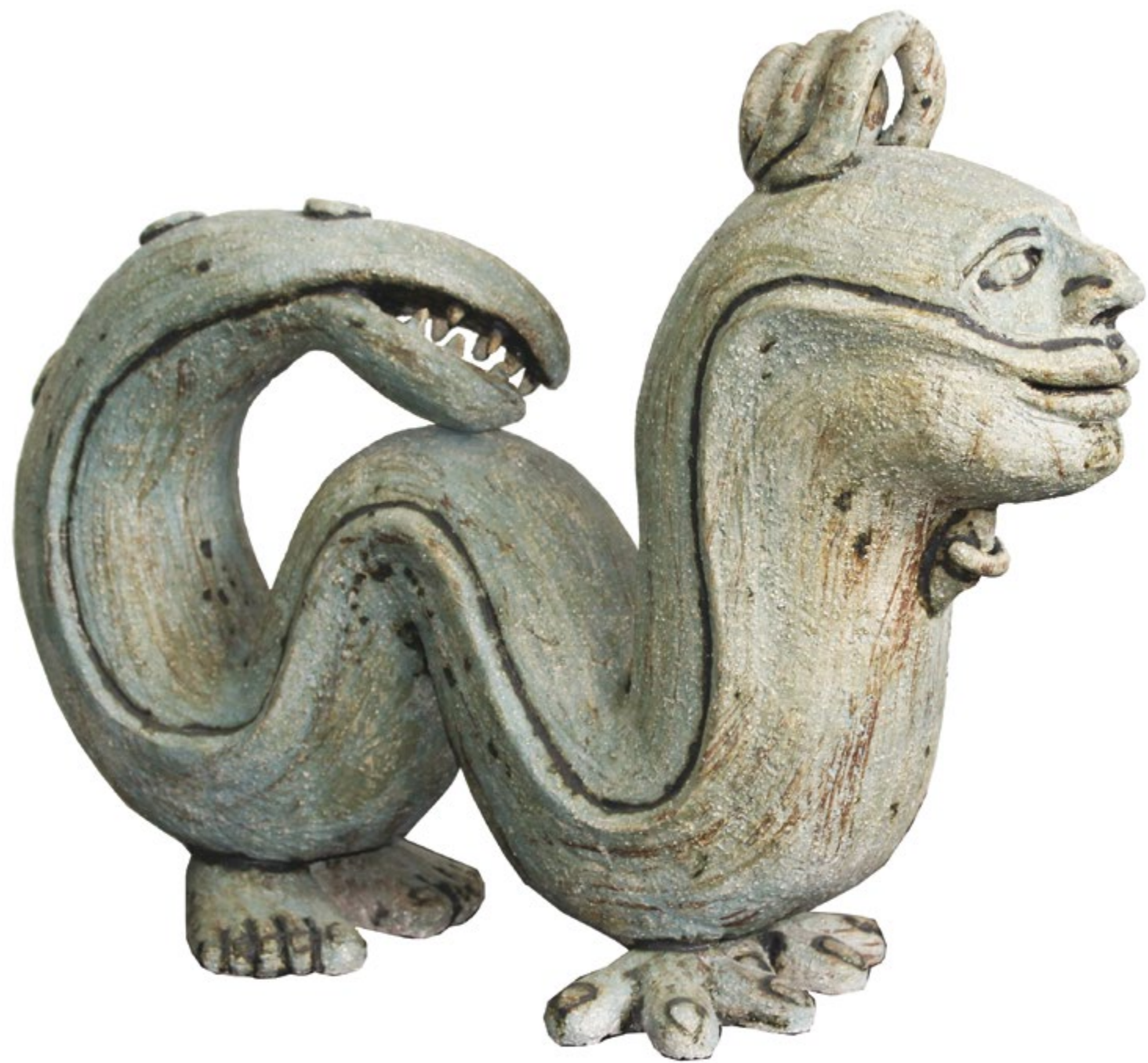
Hombre Dragón Alt. 40 cm, anch. 18 cm, prof. 55 cm Barro de alta temperatura