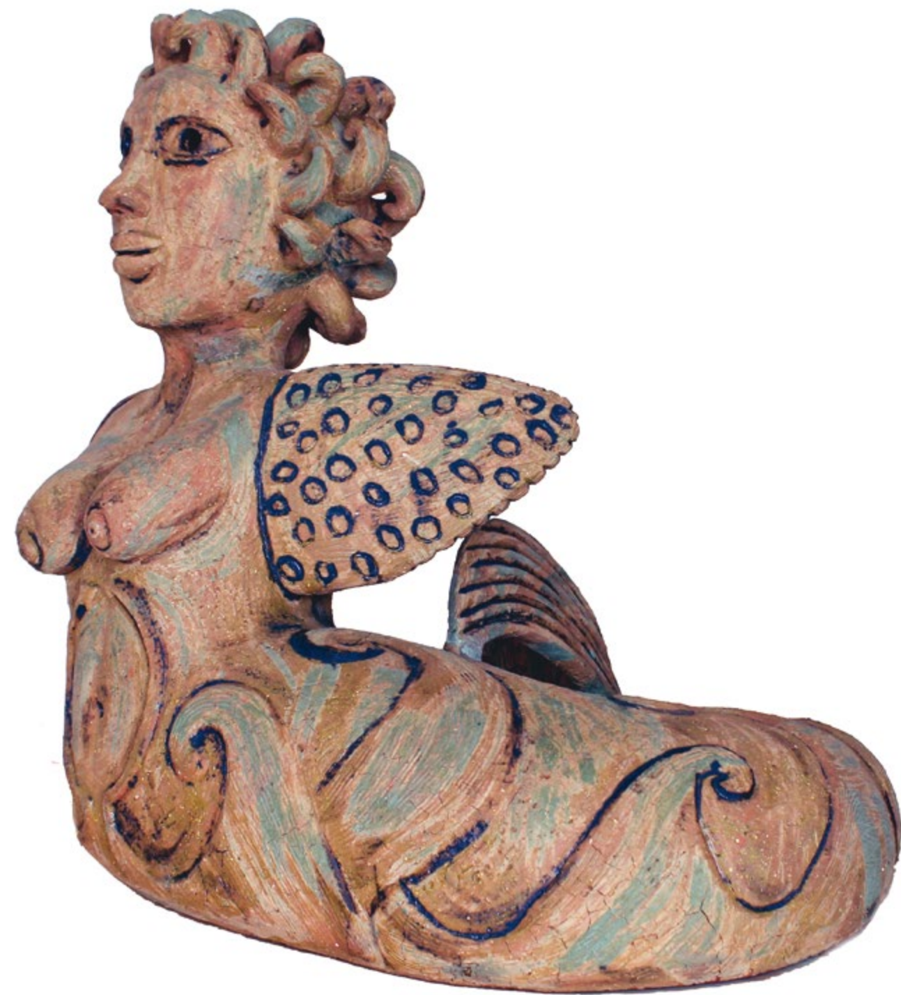
Sirenita Costeña III Alt. 53 cm, anch. 56 cm, prof. 43 cm Barro de alta temperatura