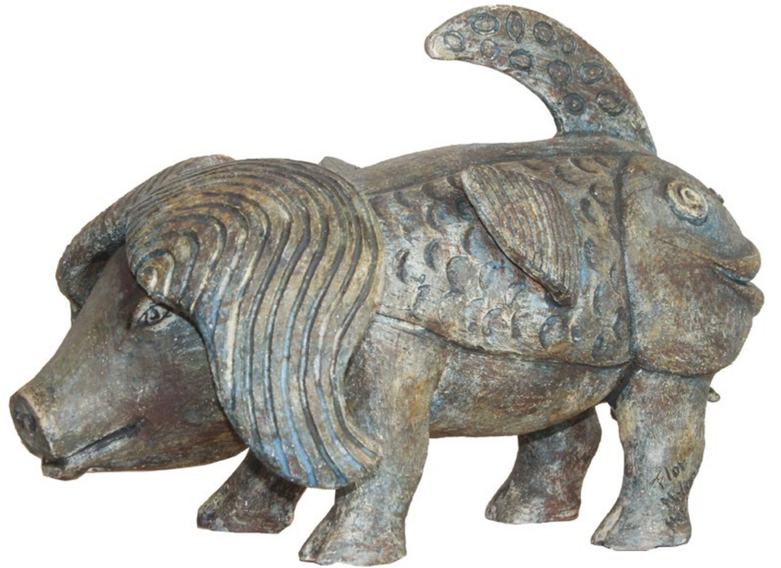
Chancho Alt. 44 cm, anch. 32 cm, prof. 65 cm Barro de alta temperatura