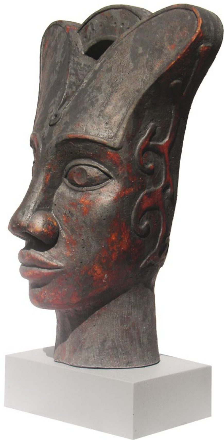
Estudio III Alt. 54 cm, anch. 39 cm, prof. 24 cm Barro de alta temperatura