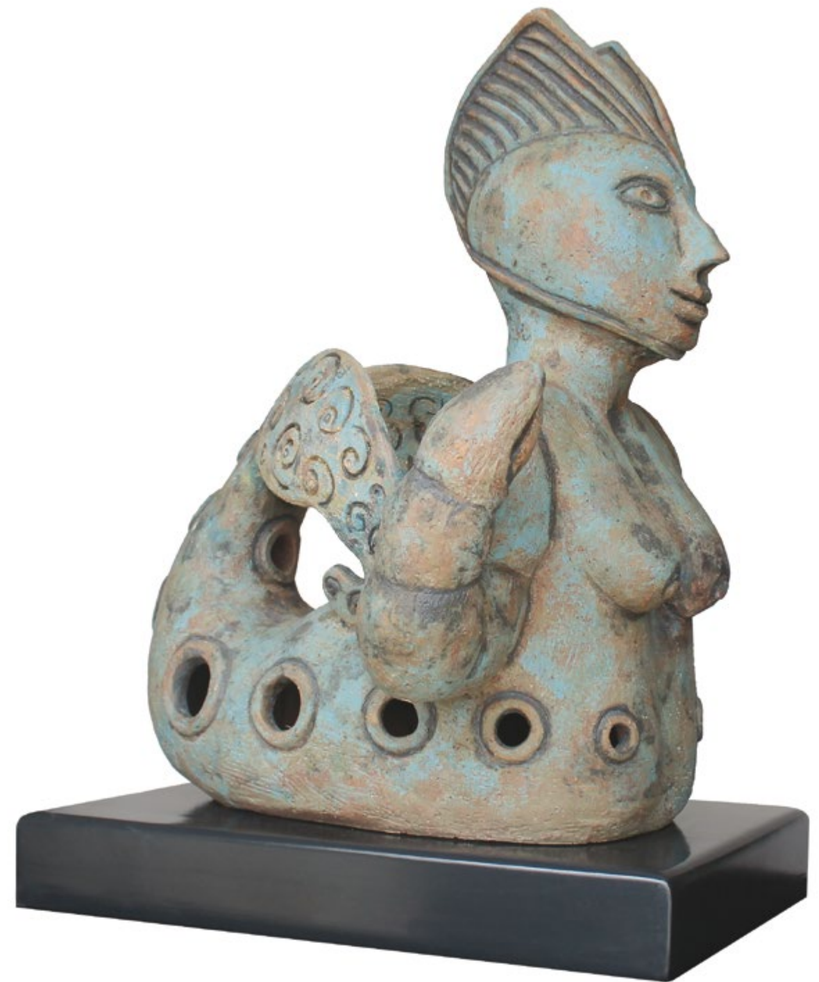
Sirena Cangreja Alt. 60 cm, anch. 54 cm, prof. 47 cm Barro de alta temperatura