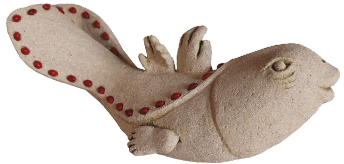
Pez con colorines Alt. 20 cm, anch. 17 cm, prof. 45 cm Barro de alta temperatura