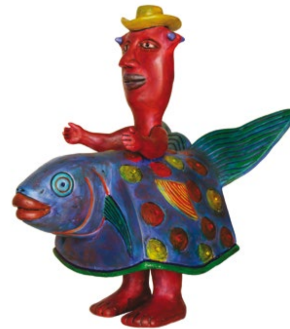
San Jorge Alt. 40 cm, prof. 37 cm, anch. 28 cm Resina