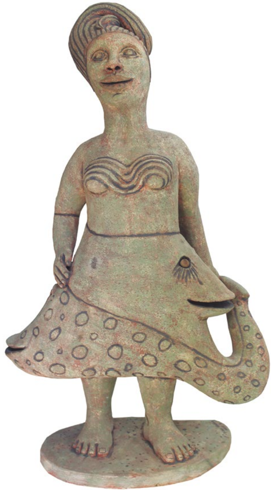
Mujer con falda de peces Alt. 127 cm, anch. 77 cm, prof. 35 cm Barro de alta temperatura