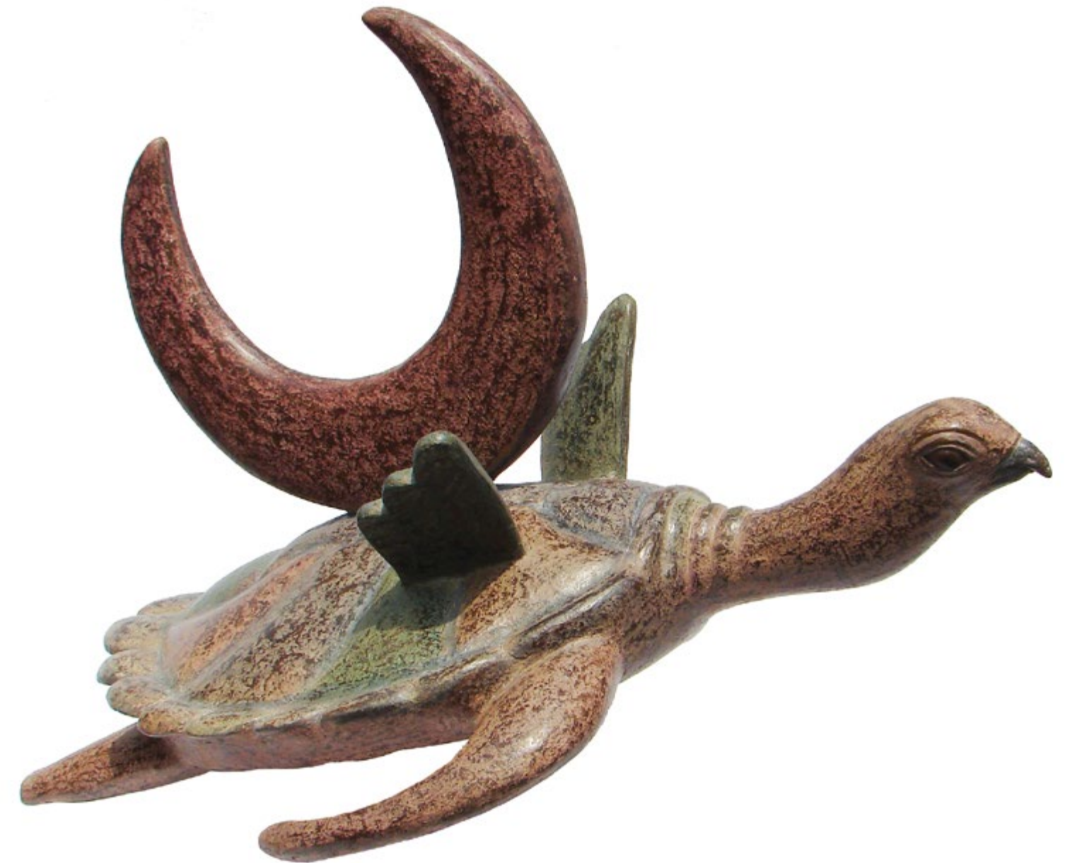
El vuelo de la tortuga 76 cm anch. 60 cm alt. 50 cm prof. Técnica Bronce