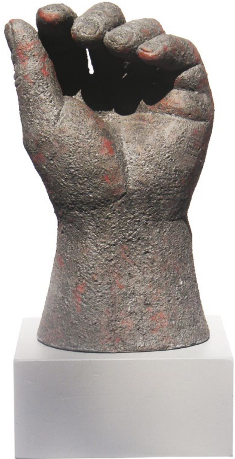
Estudio VIII Alt. 18 cm, anch. 16 cm, prof. 14 cm Barro de alta temperatura