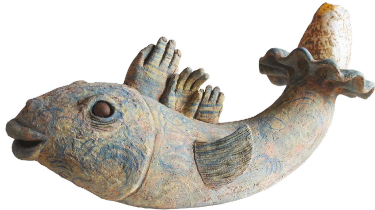
Pez de colores con caracol Alt. 68 cm, anch. 23 cm, prof. 68 cm Barro de alta temperatura