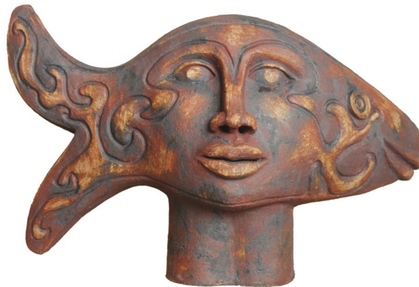
Cabeza con pez Alt. 45 cm, anch. 65 cm, prof. 35 cm Barro de alta temperatura