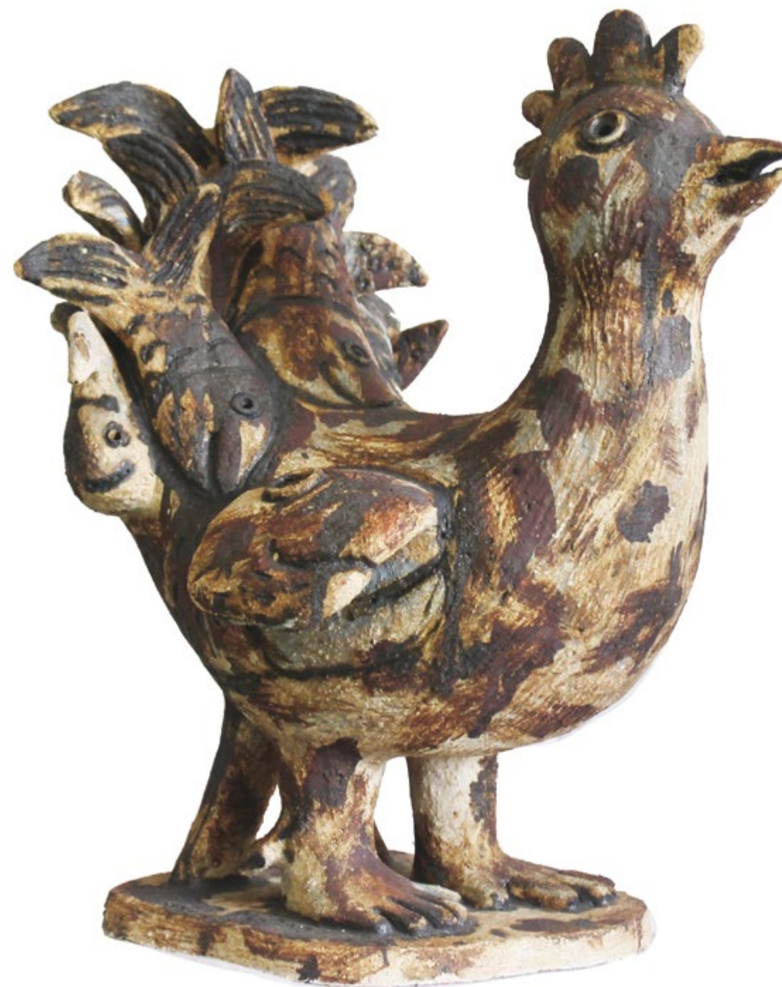
Gallo Pez I Alt. 38 cm, anch. 39 cm, prof. 28 cm Barro de alta temperatura