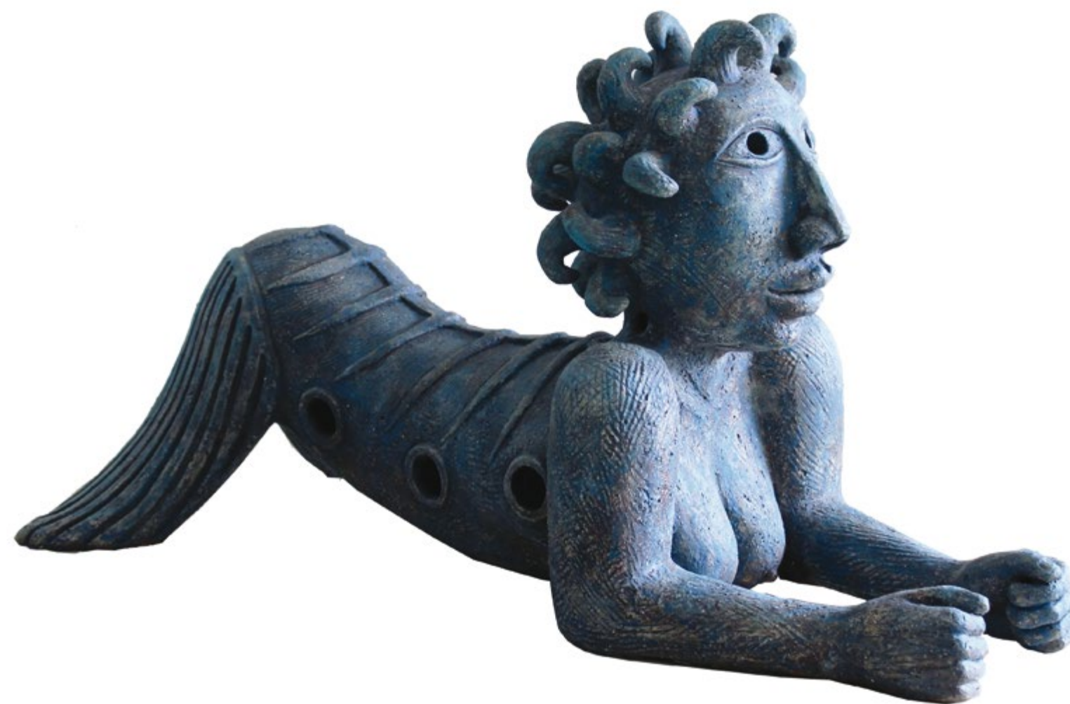
Sirenita Costeña I Alt. 53 cm, prof. 56 cm, anch. 43 cm Barro de alta temperatura