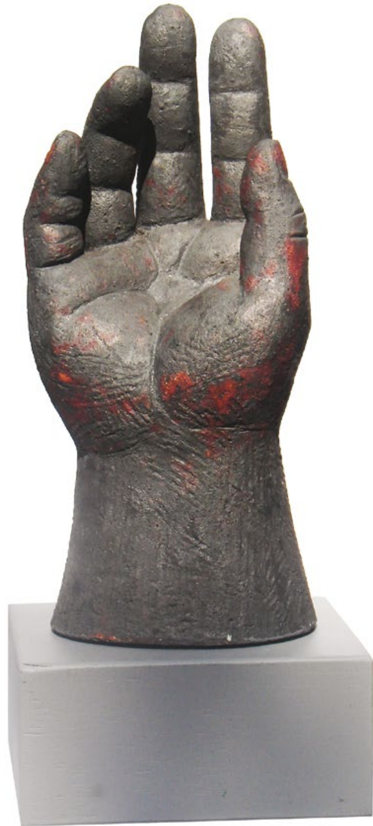
Estudio IX Alt. 33 cm, anch. 15 cm, prof. 12 cm Barro de alta temperatura