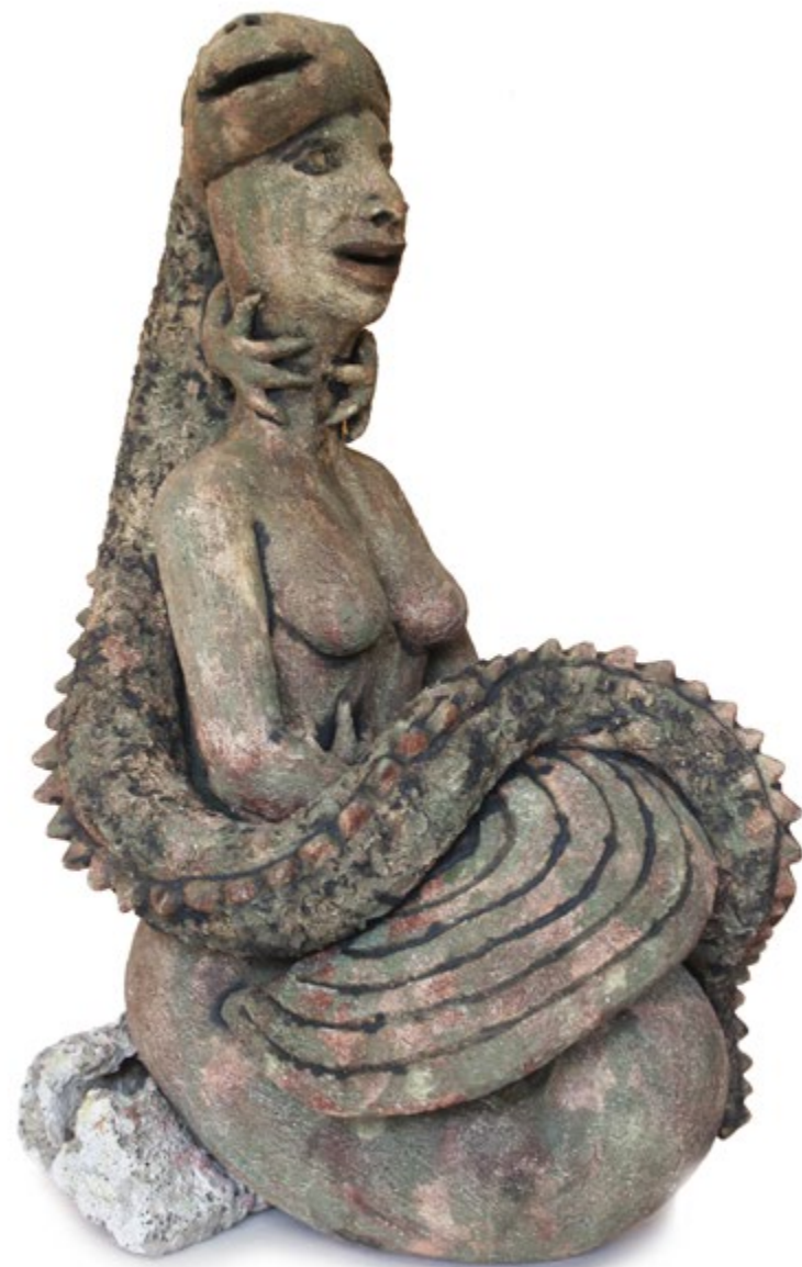
Sirena con iguana 58 cm alt. 29 cm anch. 40 cm prof. Barro de alta temperatura