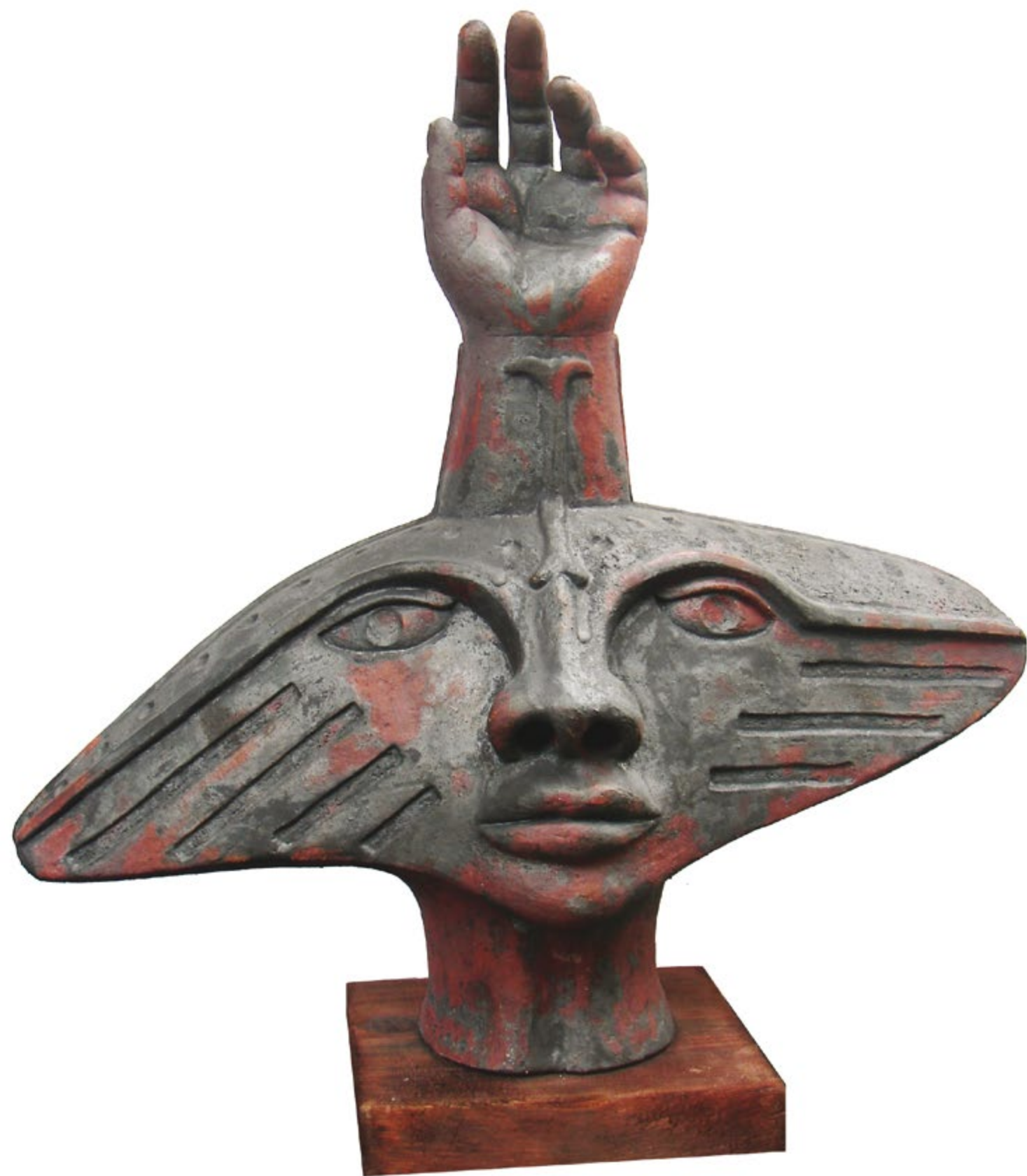
Estudio VI Alt. 60 cm, anch. 55 cm, prof. 26 cm Barro de alta temperatura