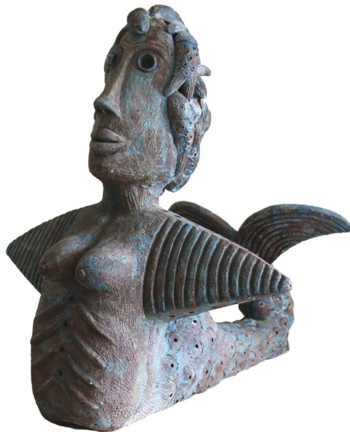
Sirena Costeña II Alt. 50 cm, anch. 49 cm, prof. 50 cm Barro de alta temperatura