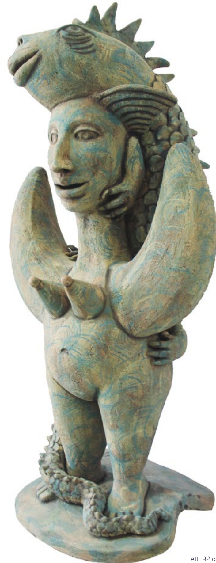
Mujer luna con iguana Alt. 92 cm, anch. 40 cm, prof. 35 cm Barro de alta temperatura