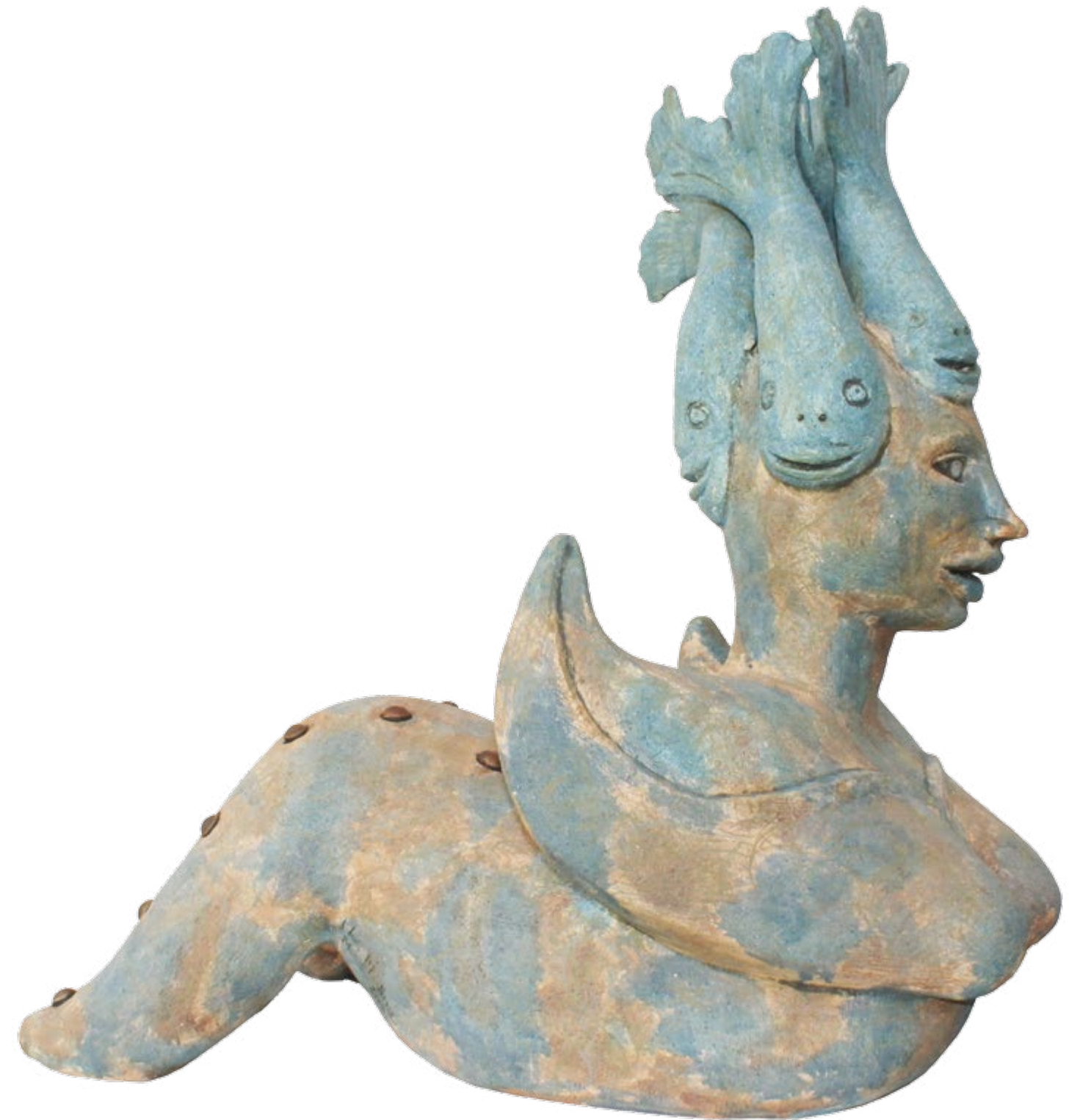
Sirena con corona de peces Alt. 88 cm, anch. 60 cm, prof. 85 cm Barro de alta temperatura

(...Y cuando desperté....el hermoso mar de la Costa Chica, había borrado ya todas las penas en mi corazón...)