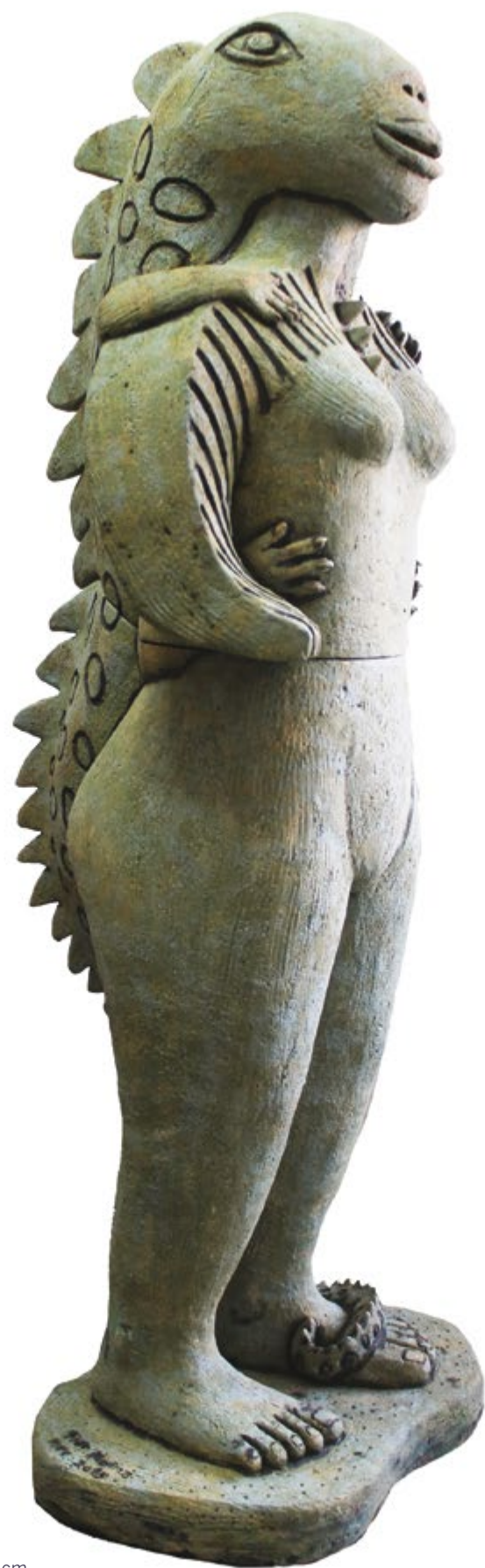
▲ Mujer Iguana

Alt. 110 cm, anch. 48 cm, prof. 40 cm Barro de alta temperatura