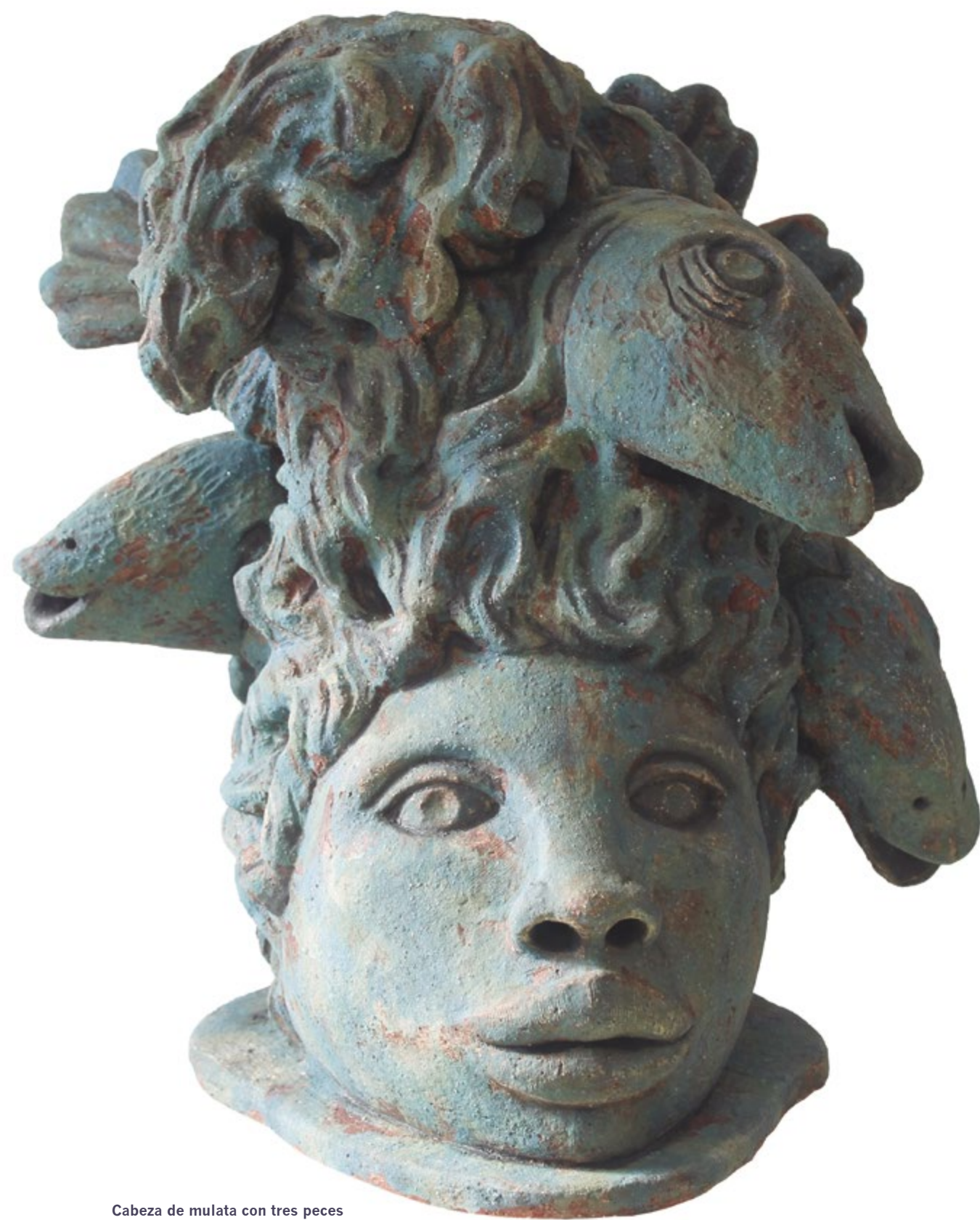
Cabeza de mulata con tres peces Alt. 49 cm, anch. 39 cm, prof. 39 cm Barro de alta temperatura