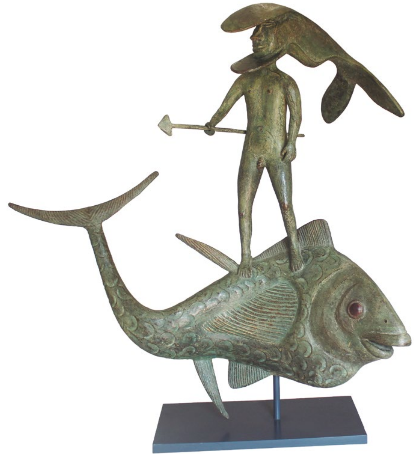
Guerrero del mar 80 cm anch. 75 cm alt. 38 cm prof. Técnica Bronce