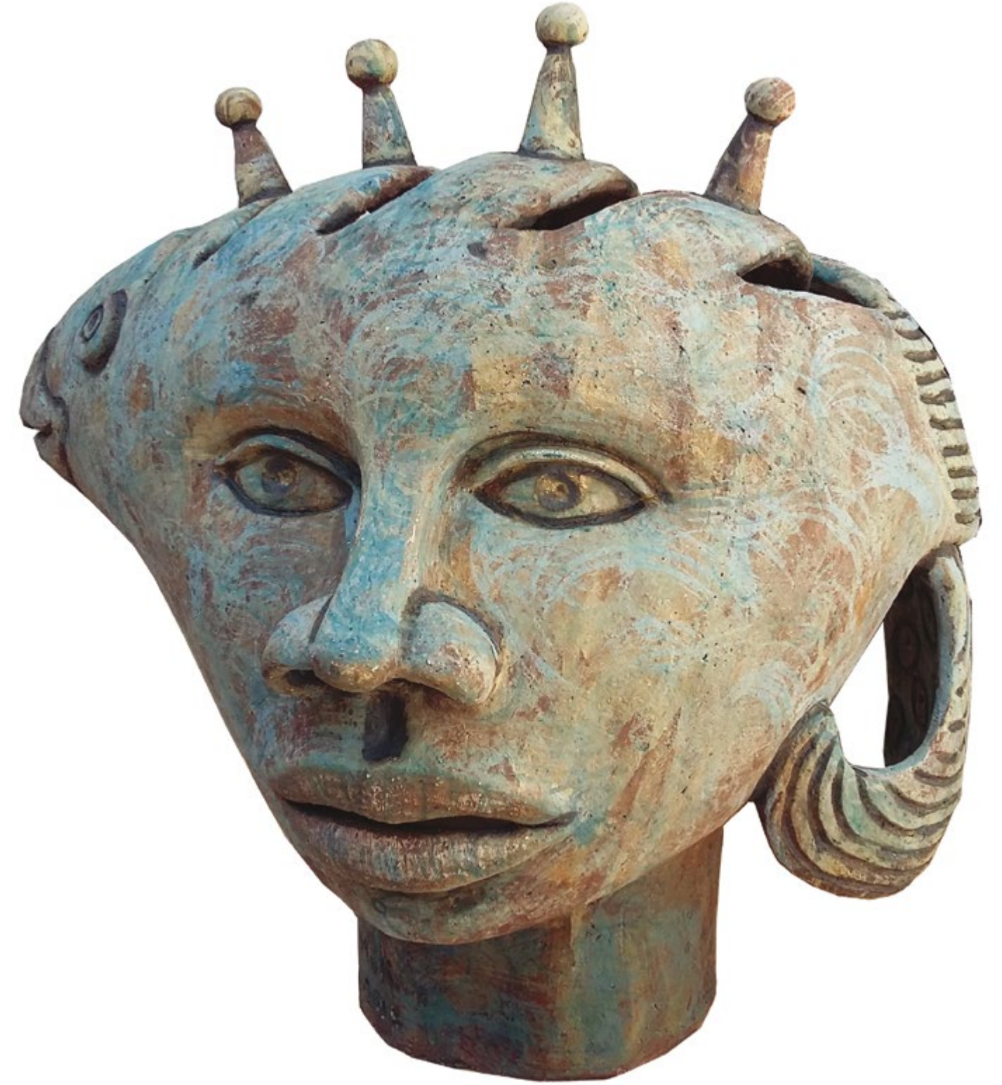
◀ Madre Naturaleza Alt. 166 cm, anch. 60 cm, prof. 60 cm Barro de alta temperatura