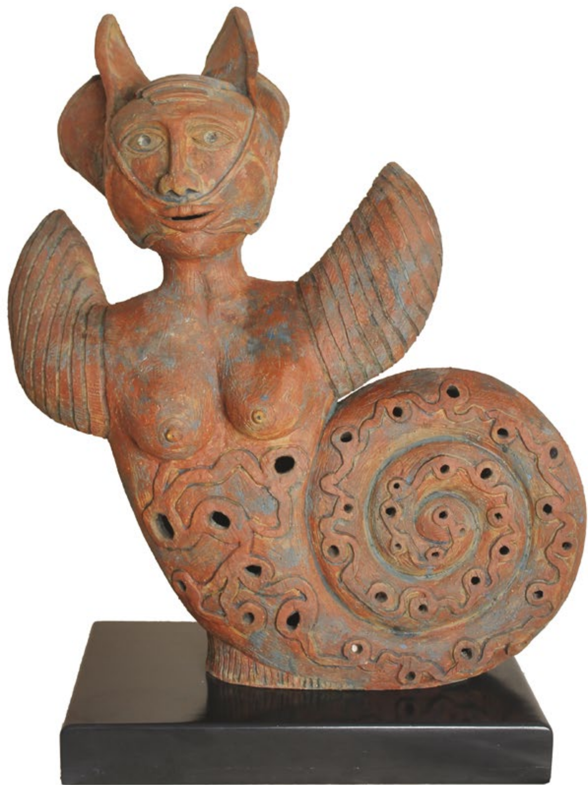
Caracola Alt. 78 cm, anch. 64 cm, prof. 34 cm Barro de alta temperatura