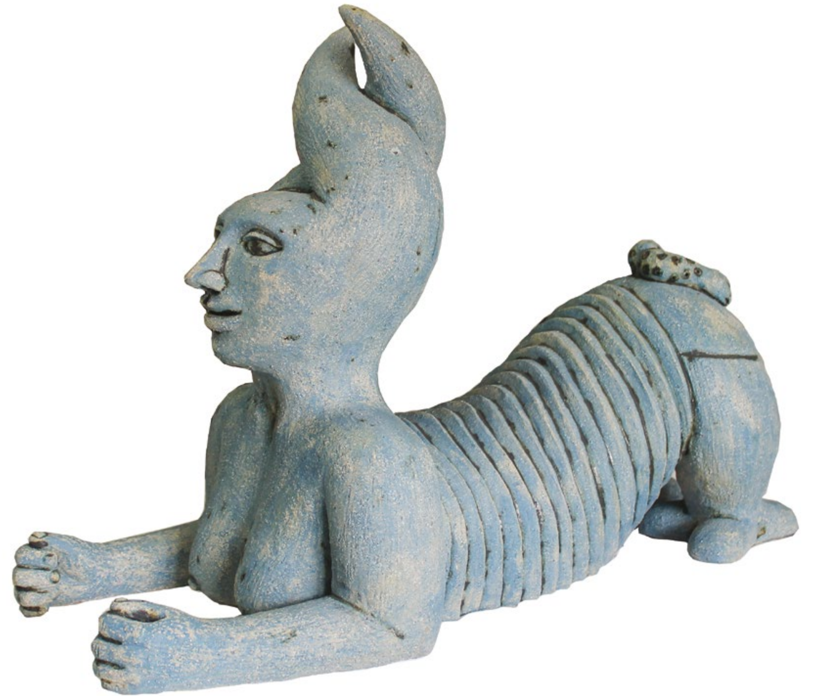
Mujer Oruga Alt. 54 cm, anch. 34 cm, prof. 67 cm Barro de alta temperatura

...Estas fantasías no rompen la forma ni alteran la armonía, están allí, simplemente, como creadas por la naturaleza misma...)