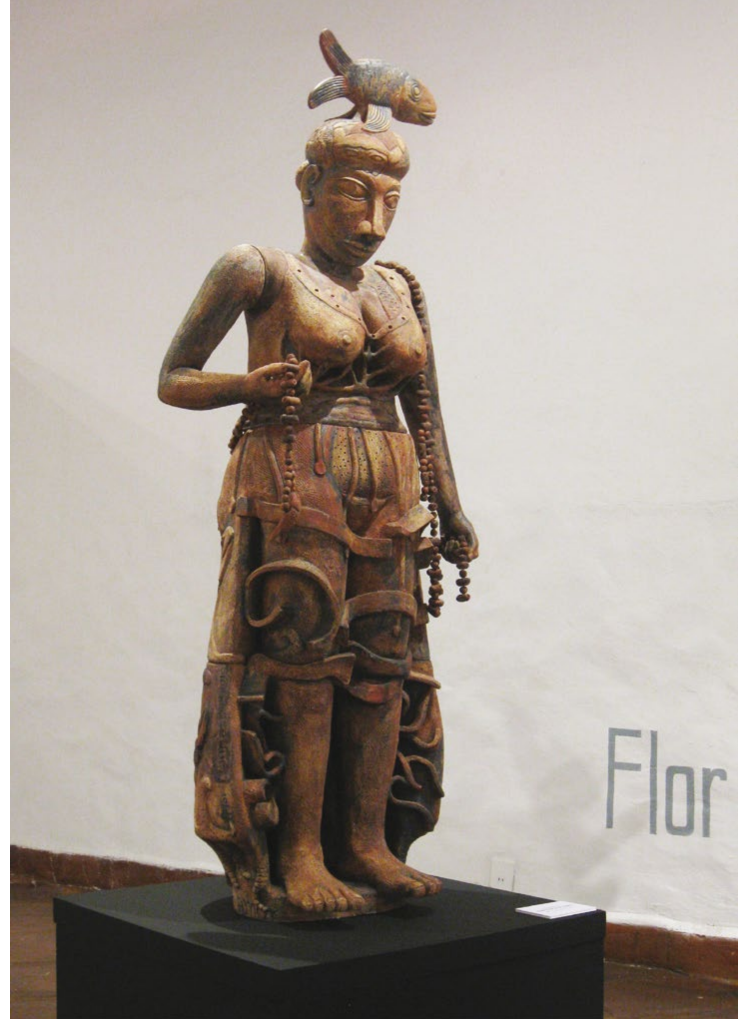
► Homenaje a mi Madre Serie Mojigangas en el Carnaval Alt. 170 cm, anch. 55 cm, prof. 46 cm Barro de alta temperatura