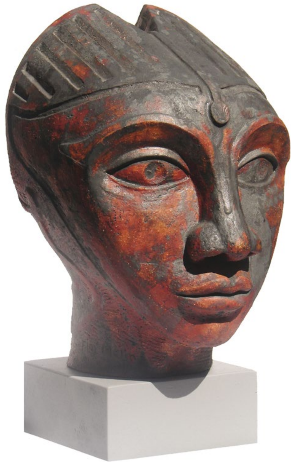
Estudio I Alt. 37 cm, anch. 28 cm, prof. 27 cm Barro de alta temperatura