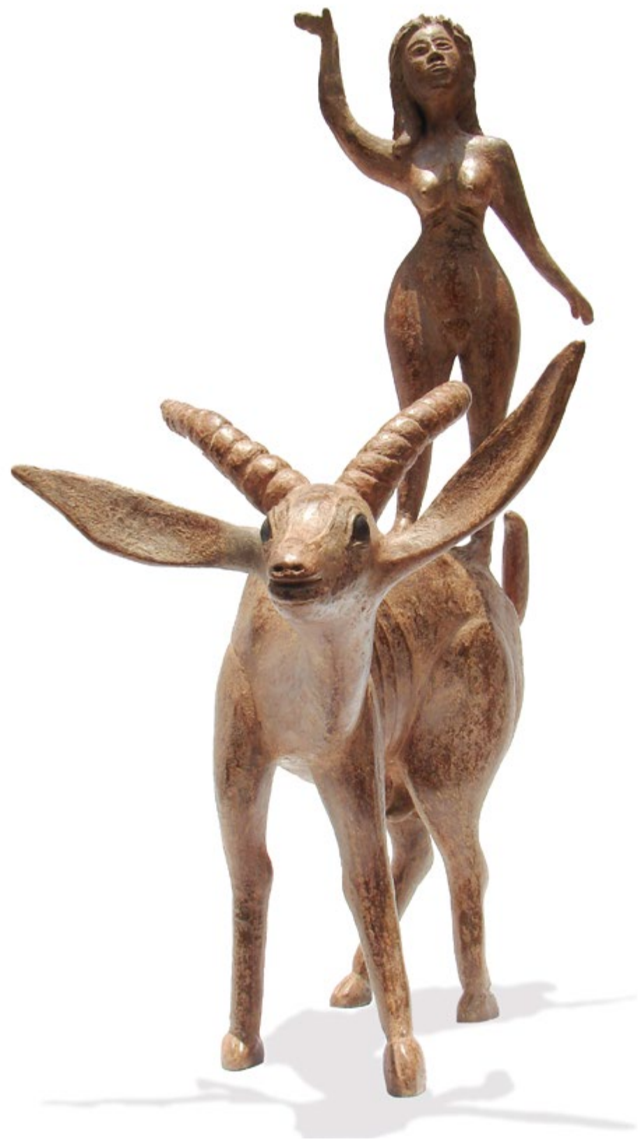
Cabalgando sin destino 55 cm anch. 70 cm alt. 30 cm prof. Técnica Bronce