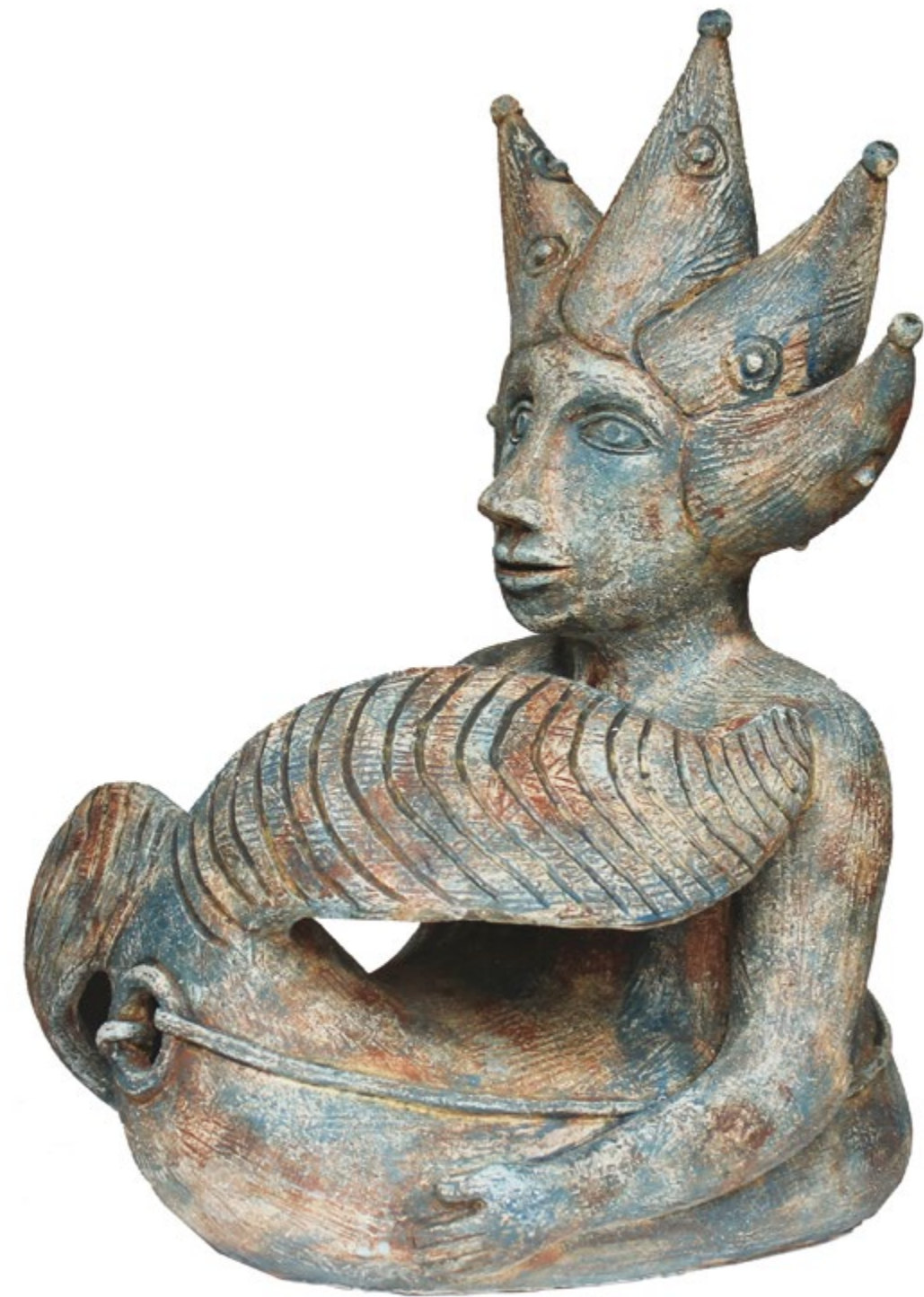
Sirena Estrellita Alt. 57 cm, anch. 40 cm, prof. 32 cm Barro de alta temperatura