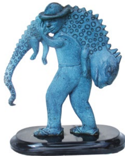
Gelasio con iguana