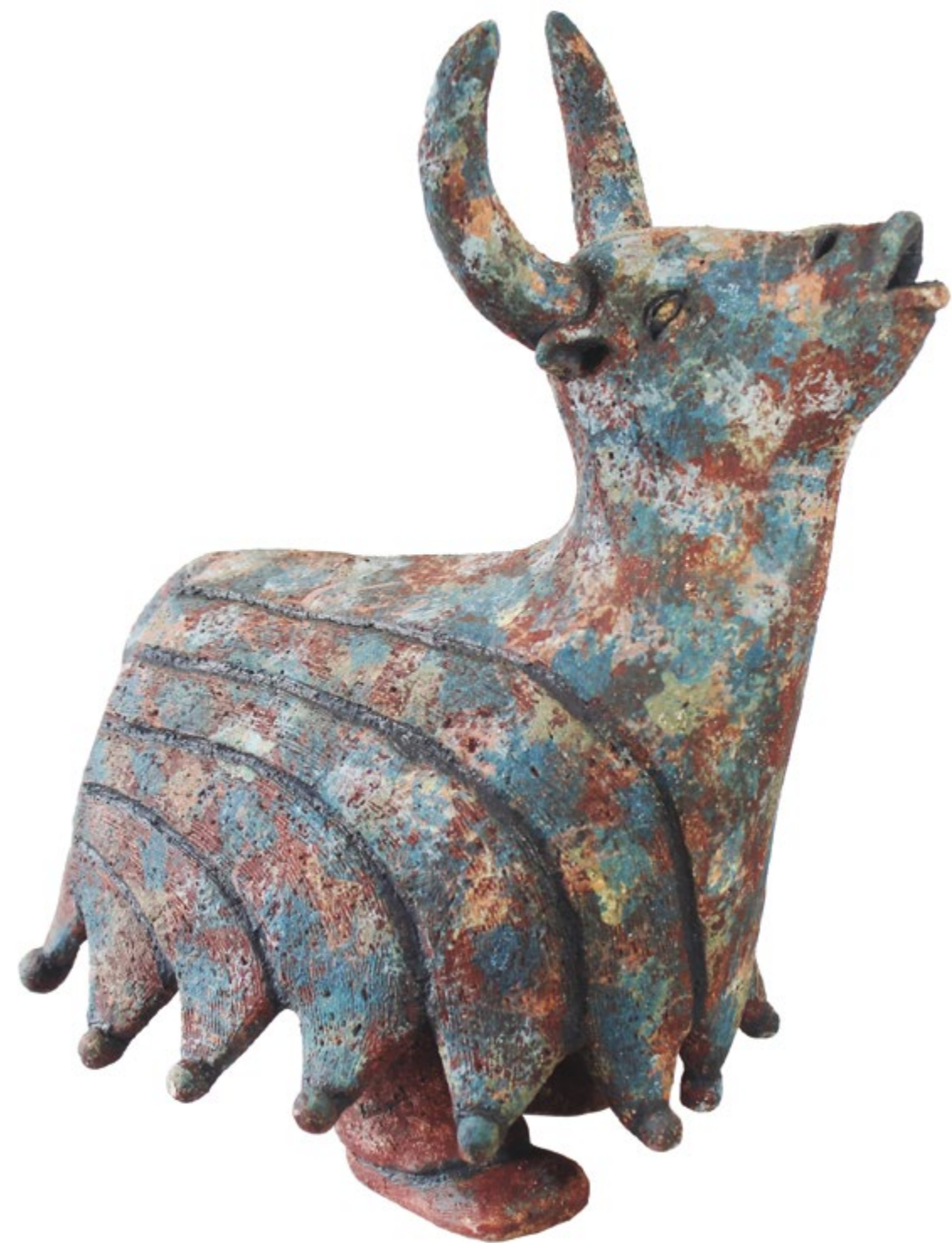
Toro de San Nicolás Alt. 27 cm, anch. 22 cm, prof. 32 cm Barro de alta temperatura