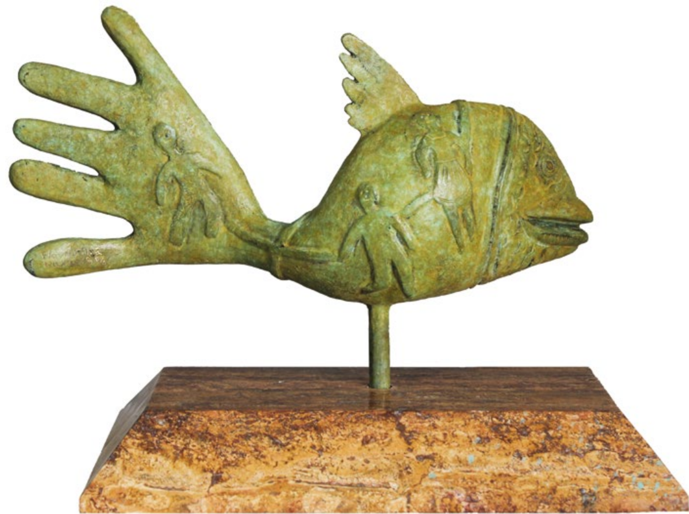
Pez mano 38 cm anch. 27 cm alt. 10 cm prof. Técnica Bronce