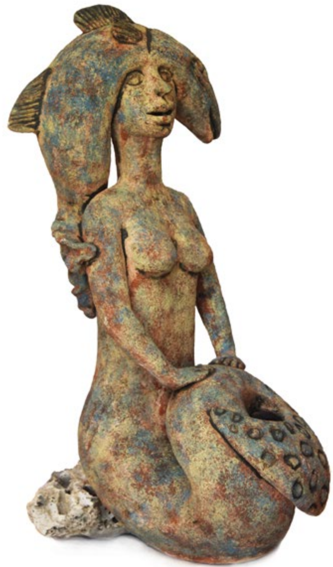
Sirena con pelo de pez 57 cm alt. 27 cm anch. 33 cm prof. Barro de alta temperatura