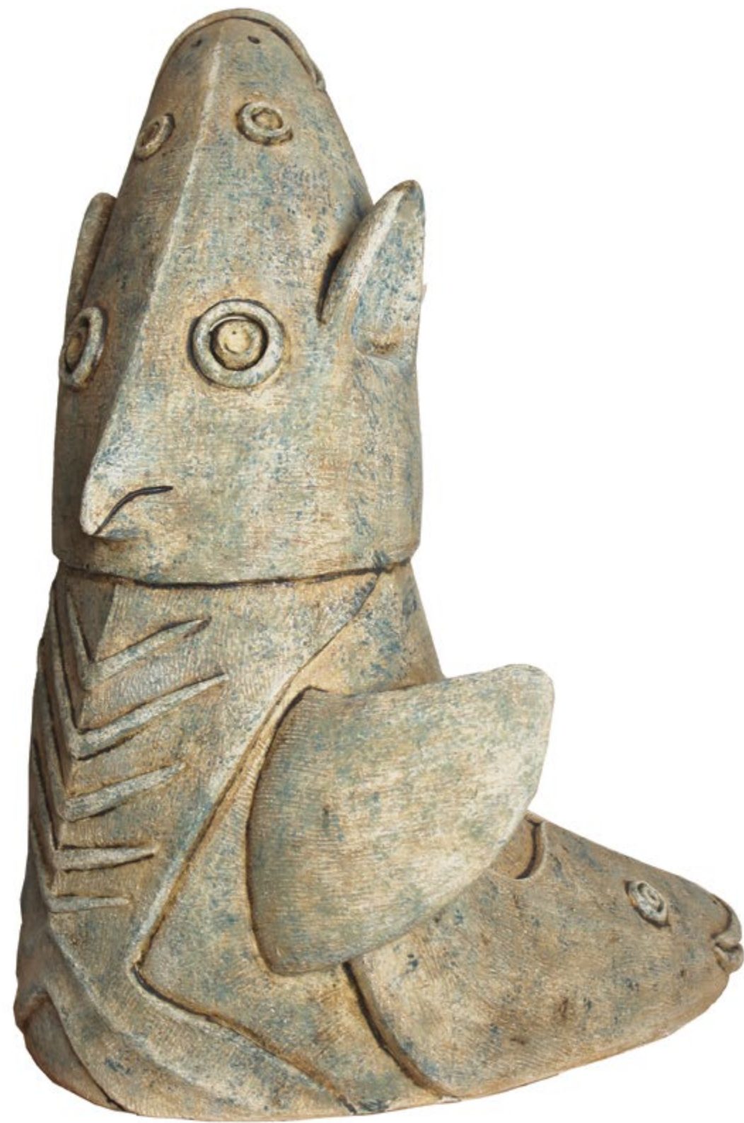
Buho Pez Alt. 83 cm, anch. 55 cm, prof. 65 cm Barro de alta temperatura