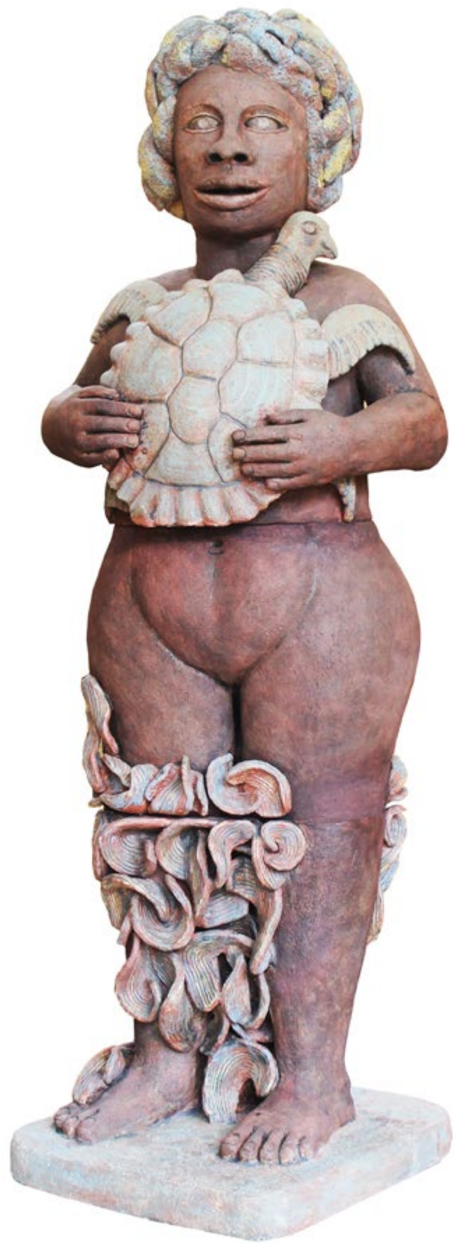
▲ Compasión a la vida Alt. 172cm, anch. 50 cm, prof. 50 cm Barro de alta temperatura