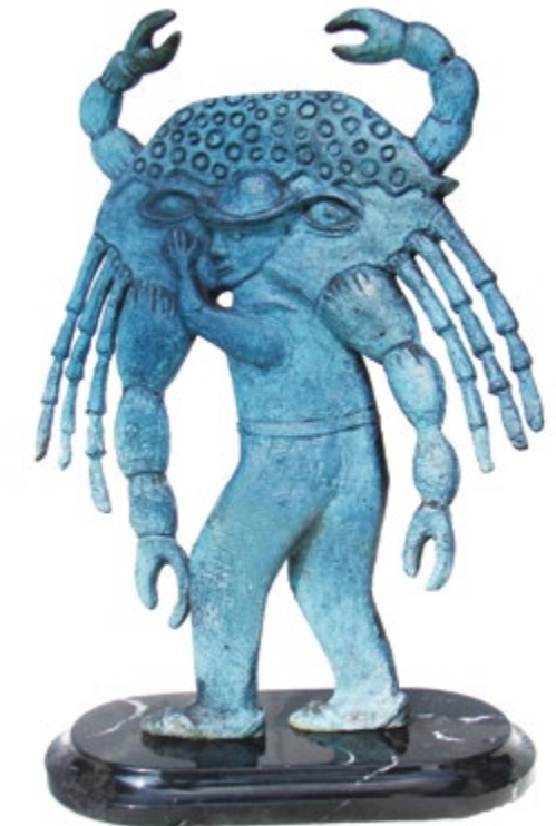
Gelasio con cangrejo