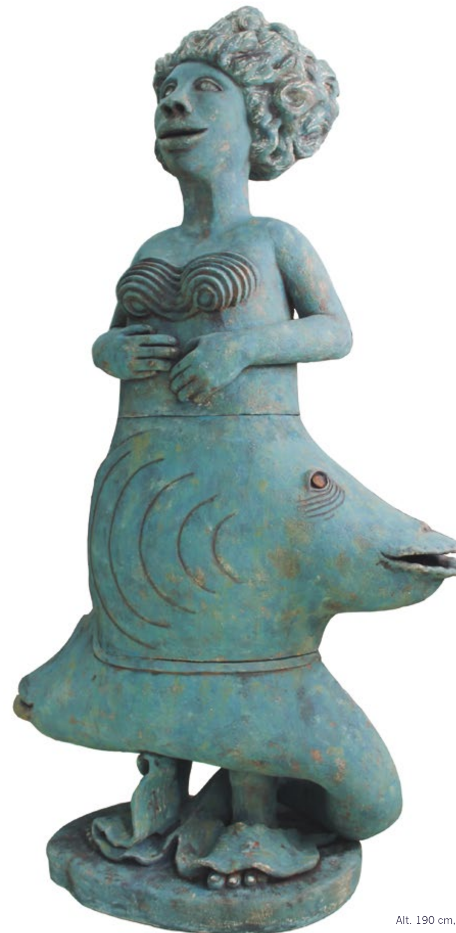
Yemanyá Alt. 190 cm, anch. 103 cm, prof. 45 cm Barro de alta temperatura