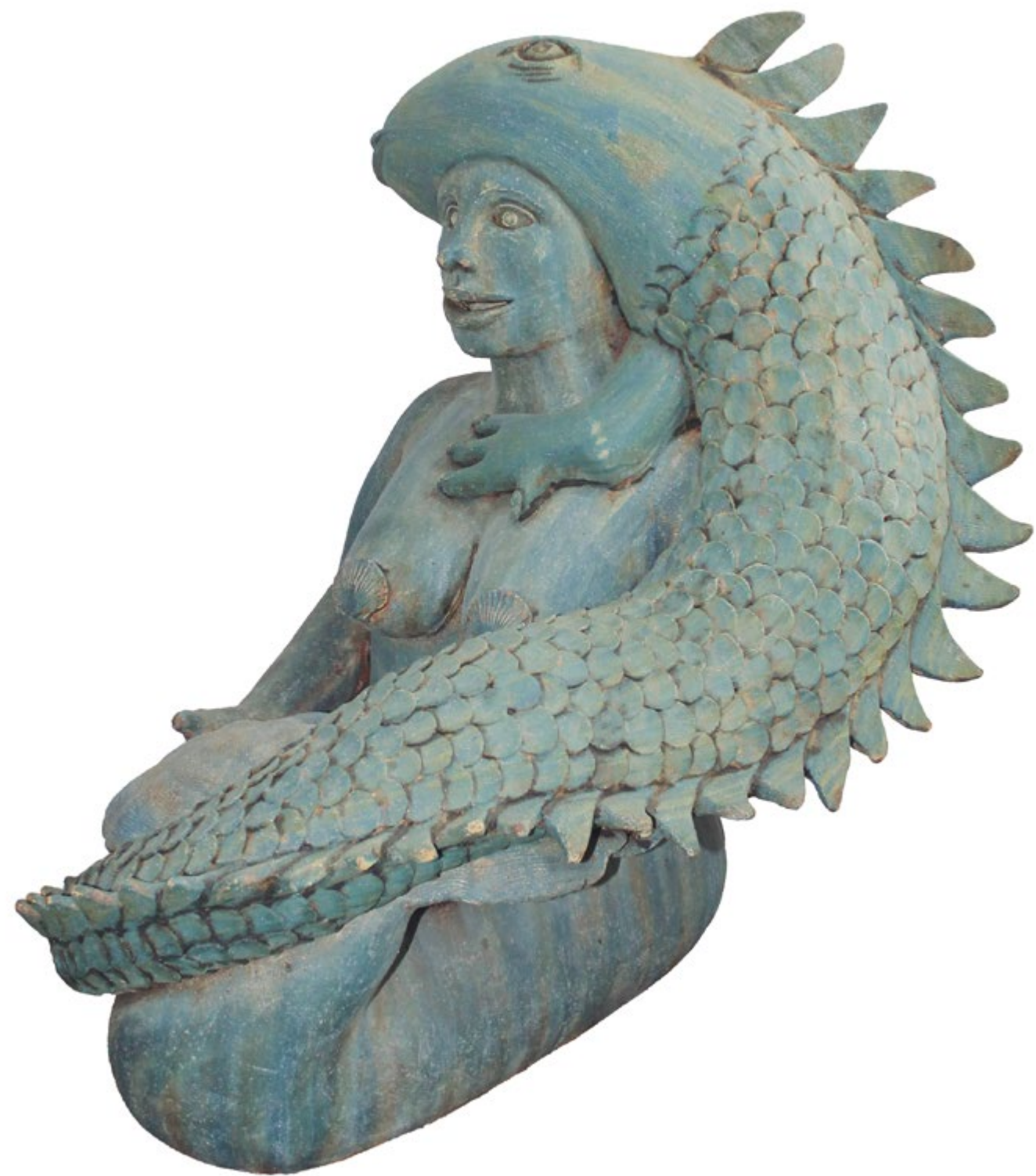
Sirena iguana Alt. 105 cm, anch. 75 cm, prof.100 cm Barro de alta temperatura