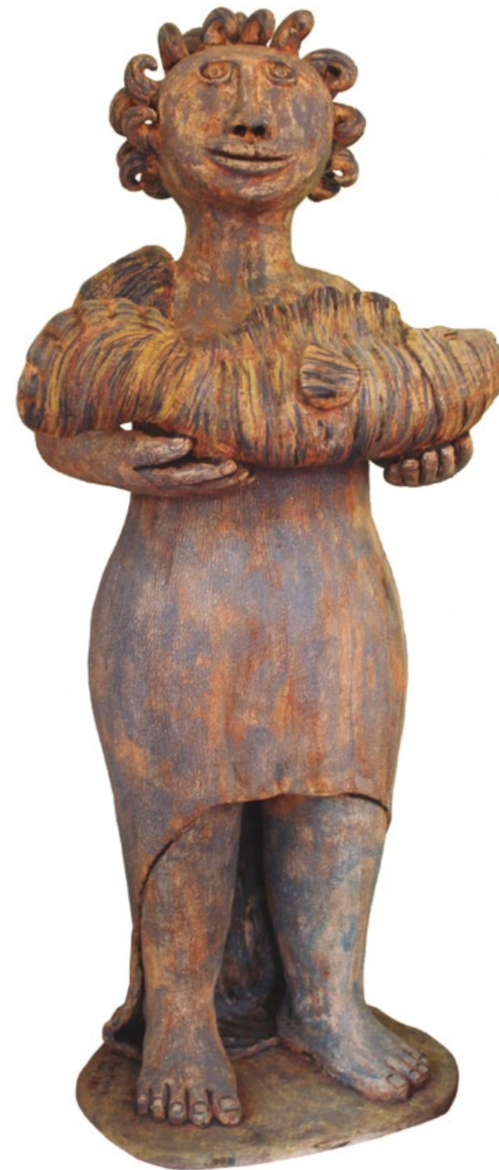
Ofrenda del mar Alt. 115 cm, anch.50 cm, prof. 32 cm Barro de alta temperatura