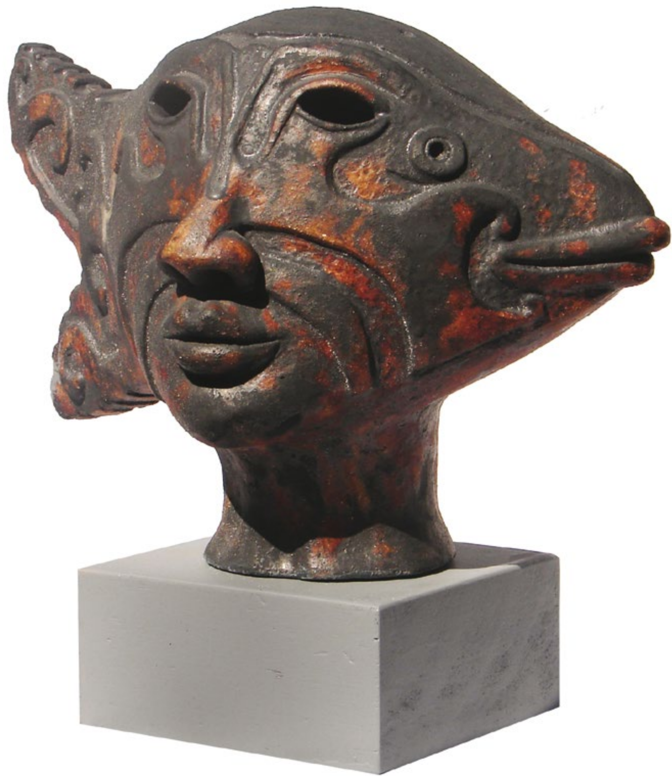
Estudio V Alt. 28 cm, anch. 42 cm, prof. 23 cm Barro de alta temperatura