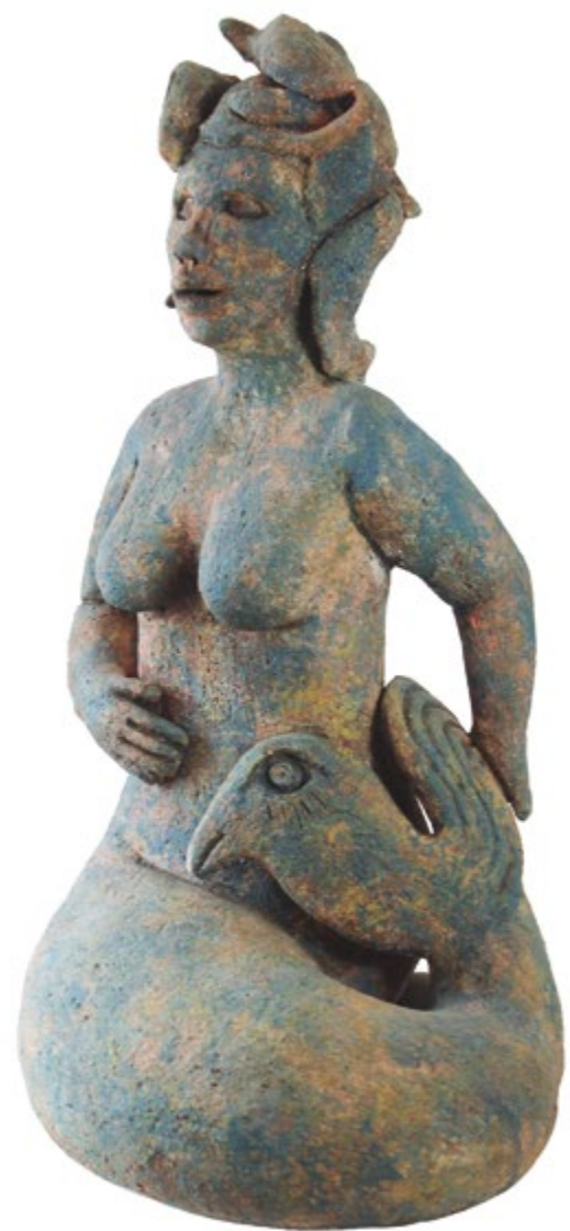
Sirena con cola de pájaro 46 cm alt. 27 cm anch. 21 cm prof. Barro de alta temperatura