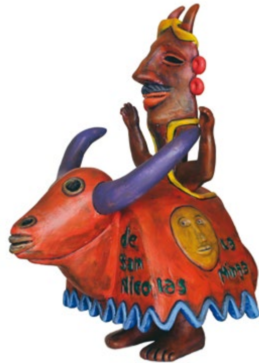
Toro de San Nicolás - San Gelasio Alt. 42 cm, prof. 35 cm, anch. 26 cm Resina