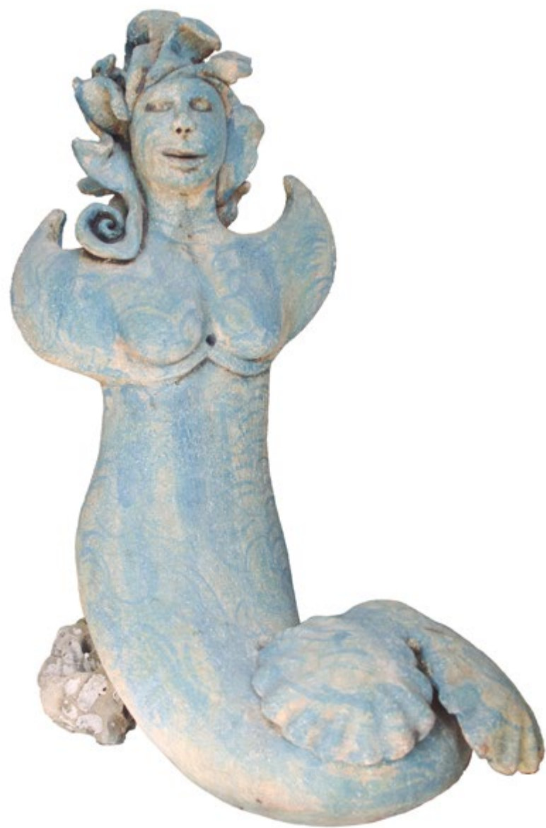
Sirena angelita 23 cm anch. 50 cm alt. 32 cm prof. Barro de alta temperatura