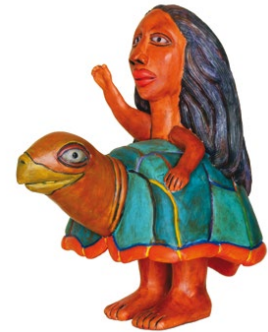
Santa Julia Alt. 37 cm, prof. 23 cm, anch. 33 cm. Resina