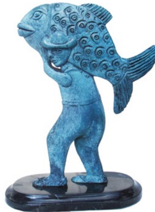
Gelasio con pez