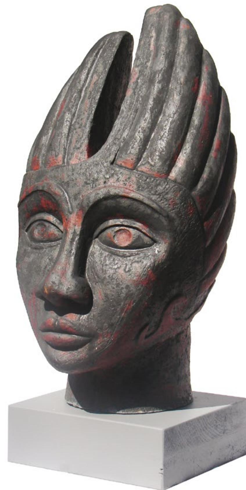
Estudio IV Alt. 53 cm, anch. 28 cm, prof. 28 cm Barro de alta temperatura