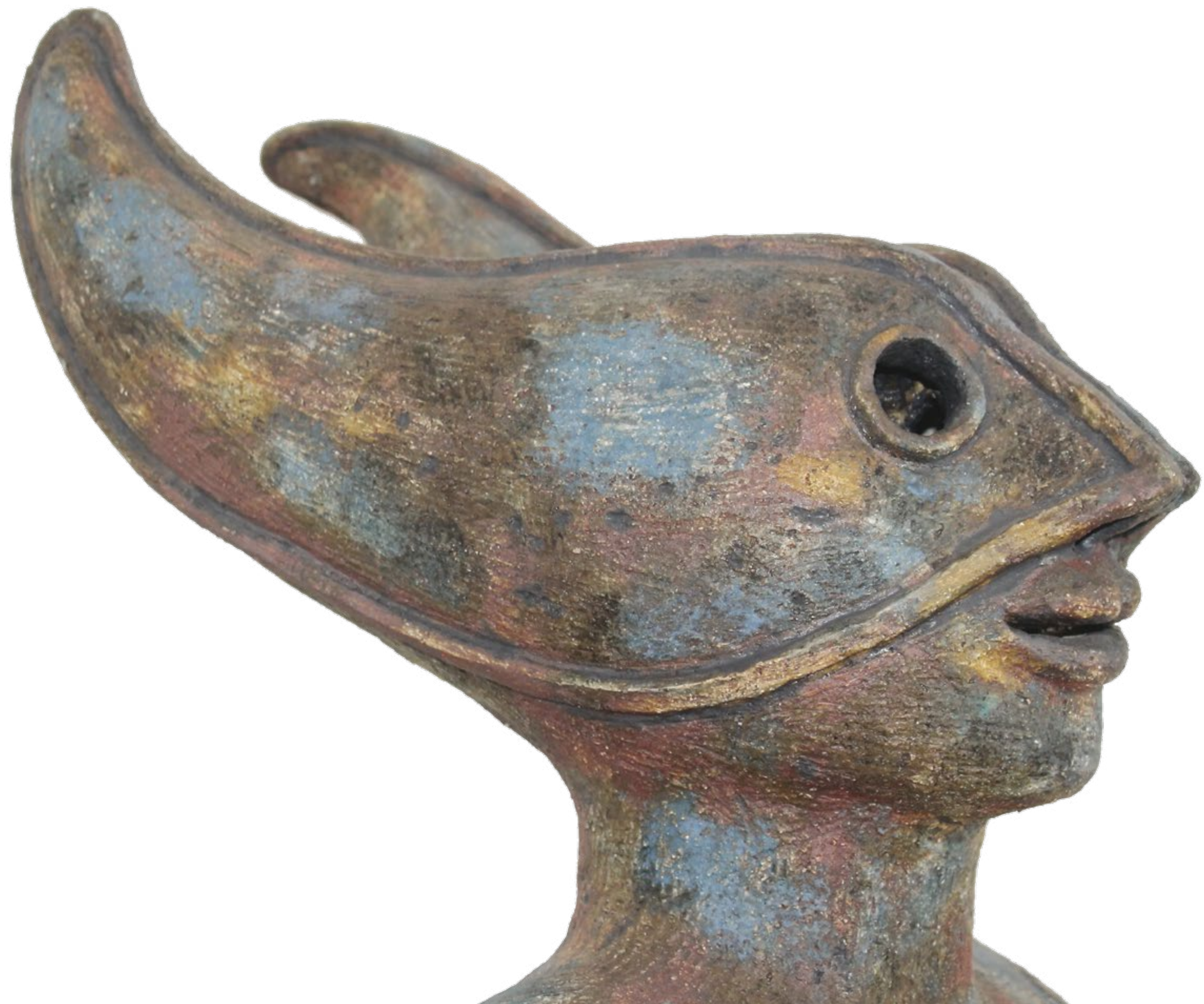
OBRA Serie Sirenas