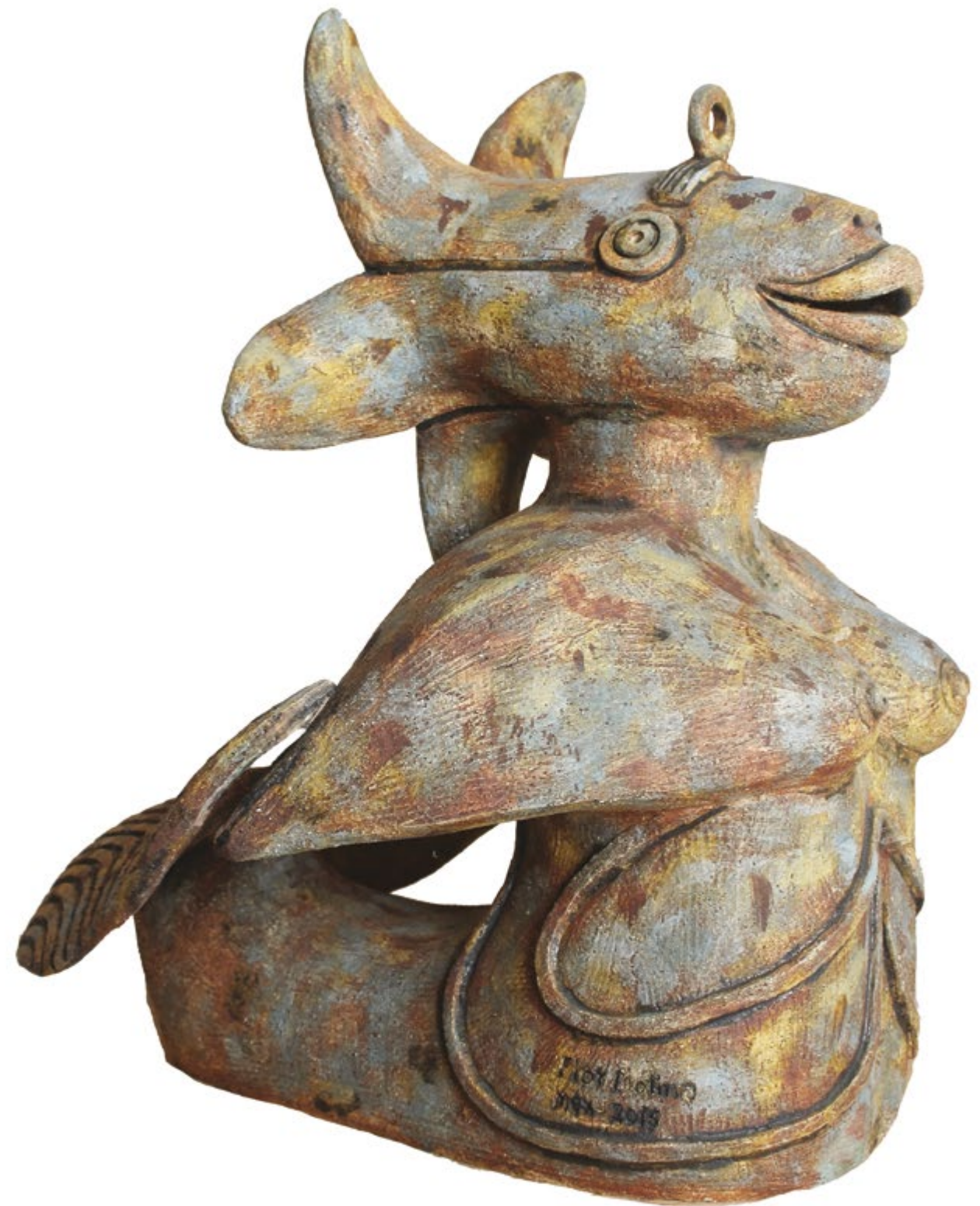
Sirenita Orquídea Alt. 65 cm, anch. 54 cm, prof. 58 cm Barro de alta temperatura