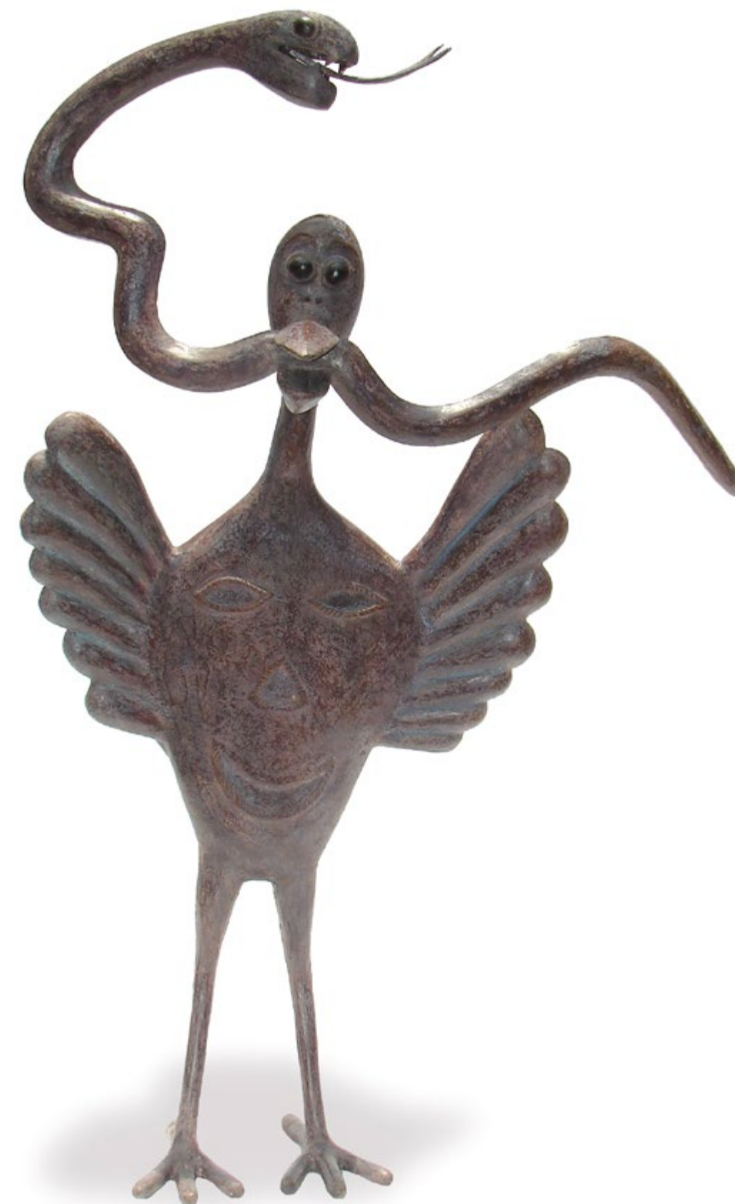
Garza cazadora 65 cm anch. 95 cm alt. 30 cm prof. Técnica Bronce