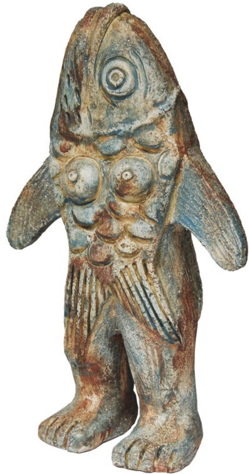
Mujer Pez Alt. 30 cm, anch. 19 cm, prof. 9 cm Barro de alta temperatura