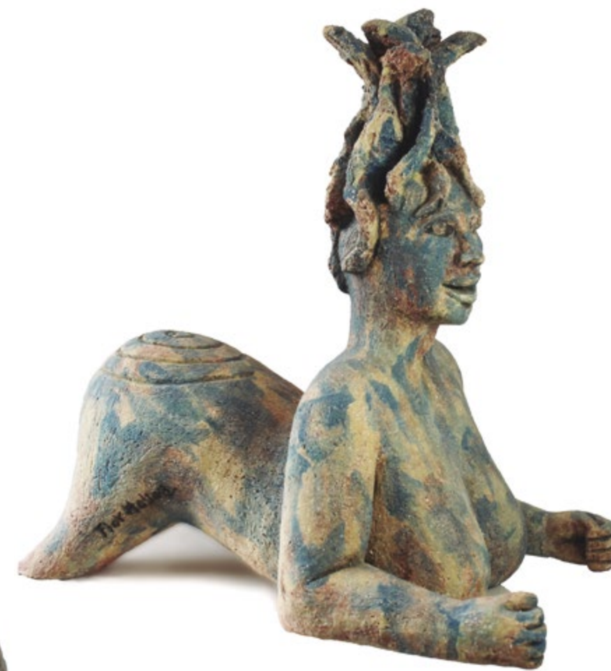
Sirena con pelo de algas 39 cm alt. 24 cm anch. 39 cm prof. Barro de alta temperatura