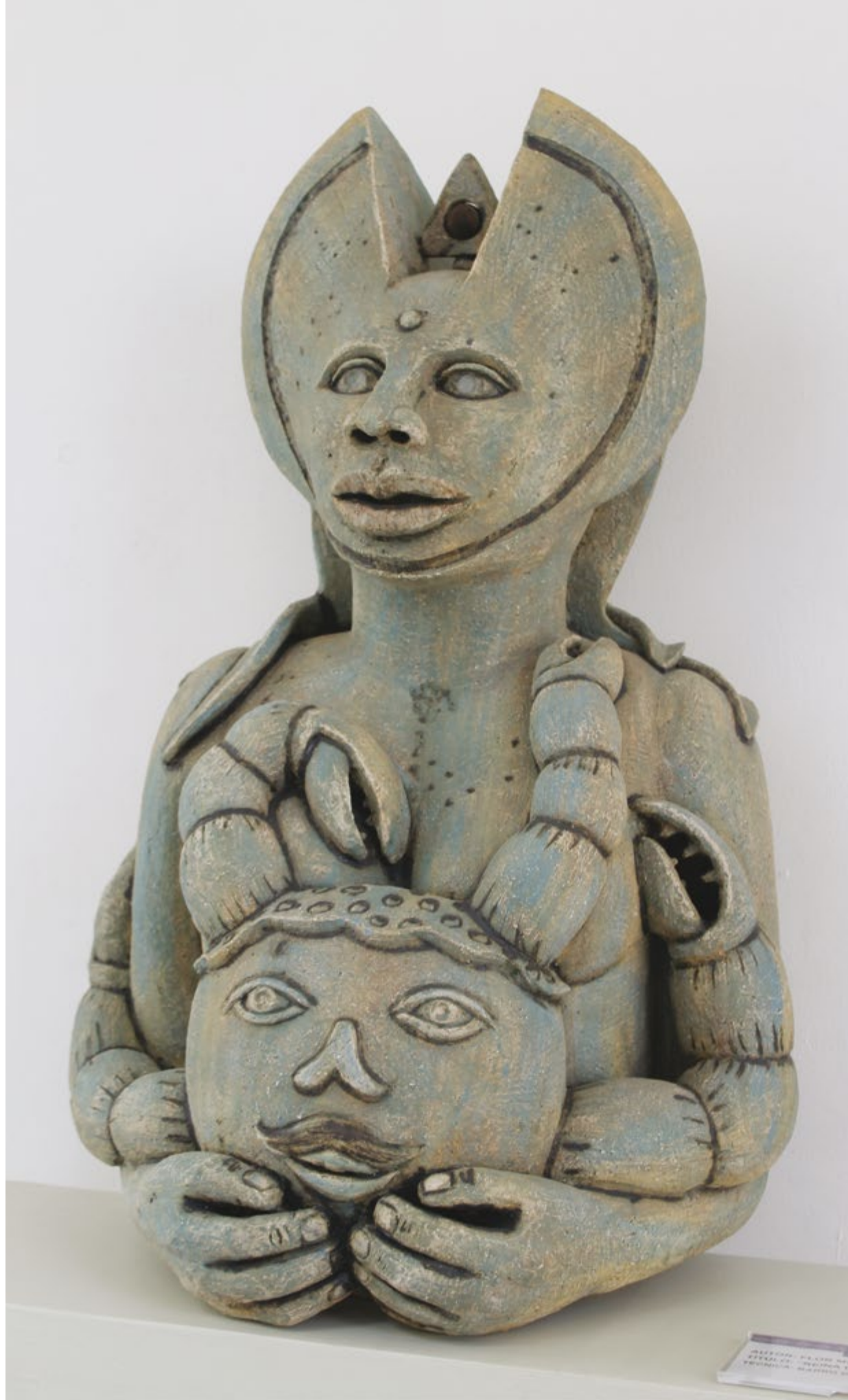
◀ Reyna de la Tribu Alt. 80 cm, anch. 55 cm, prof. 37 cm Barro de alta temperatura