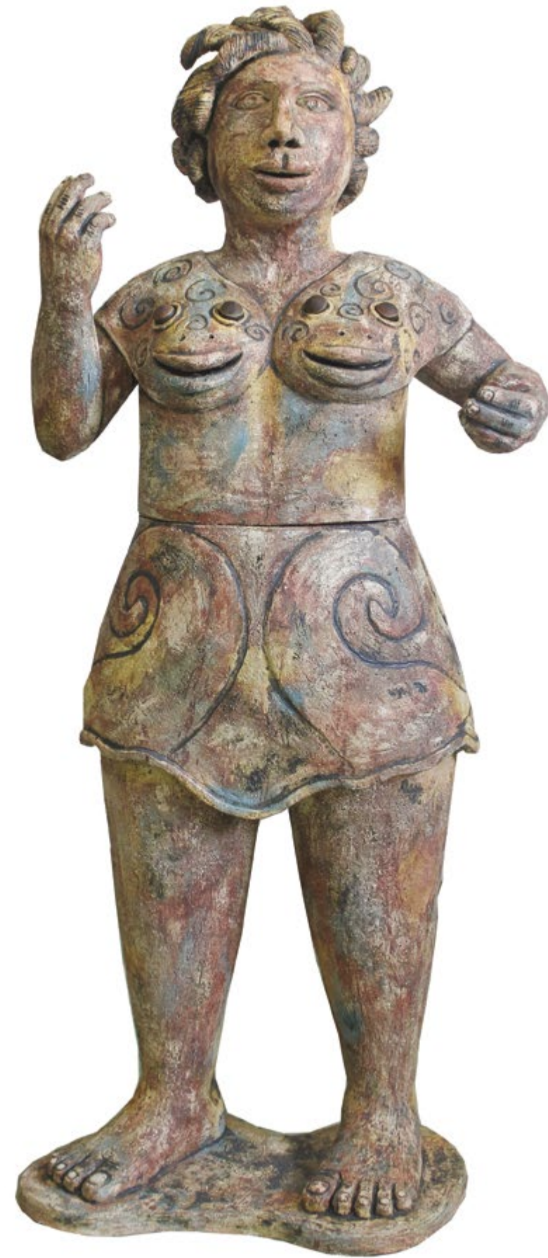
Minga Alt. 117 cm, anch. 50 cm, prof. 26 cm Barro de alta temperatura