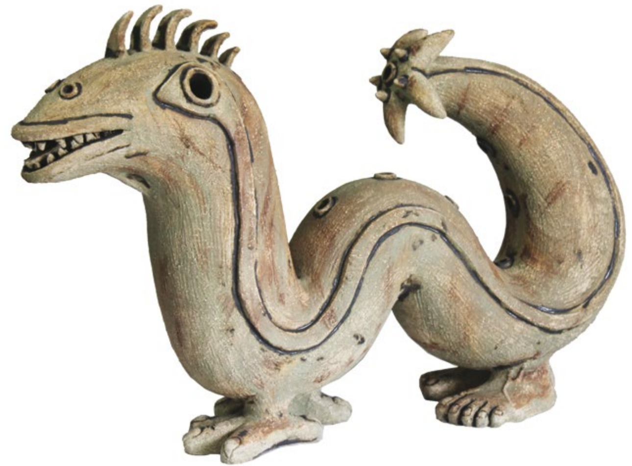
Dragón marino Alt. 47 cm, anch. 24 cm, prof. 68 cm Barro de alta temperatura