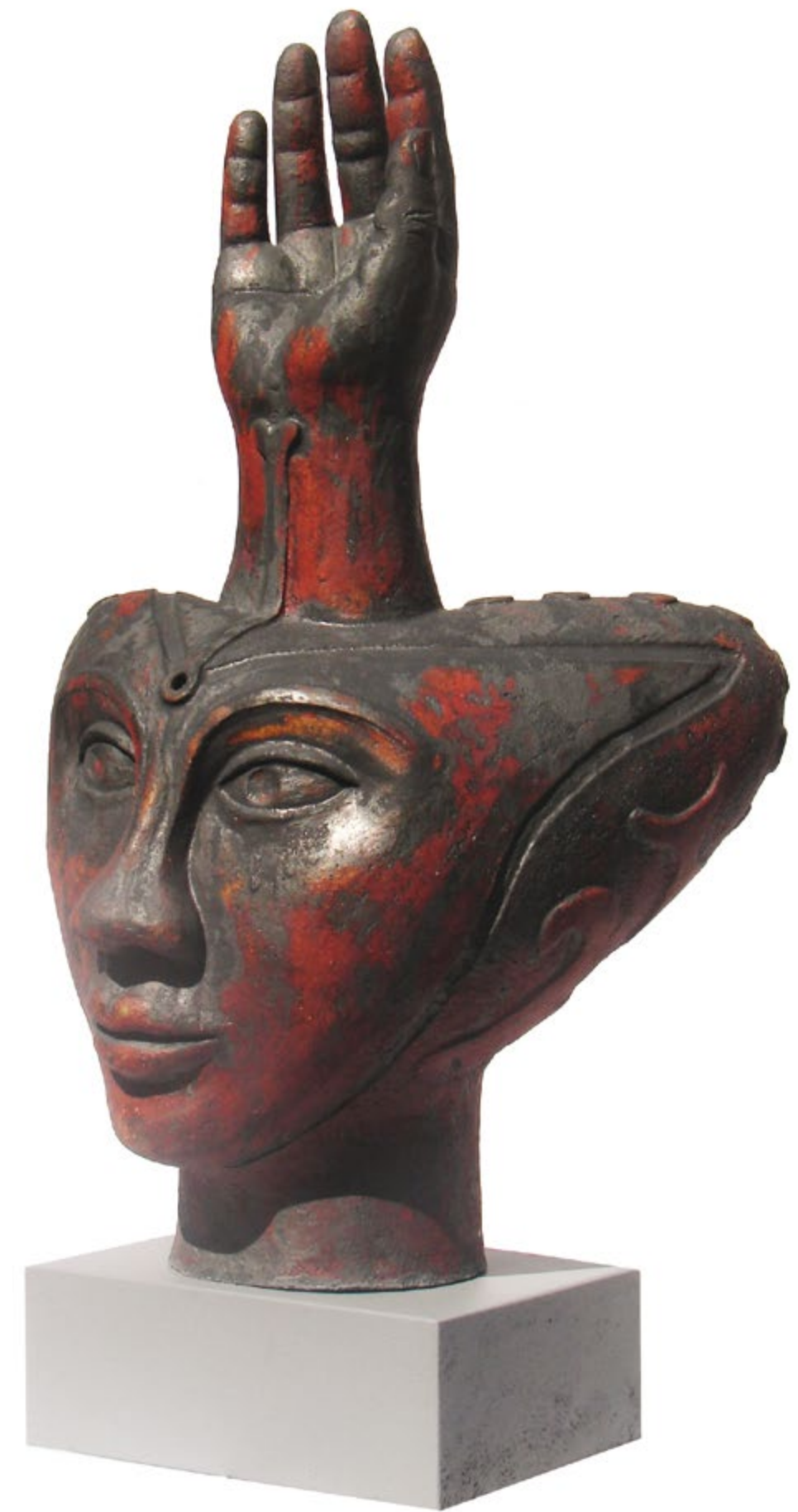
Estudio II Alt. 59 cm, anch. 36 cm, prof. 26 cm Barro de alta temperatura