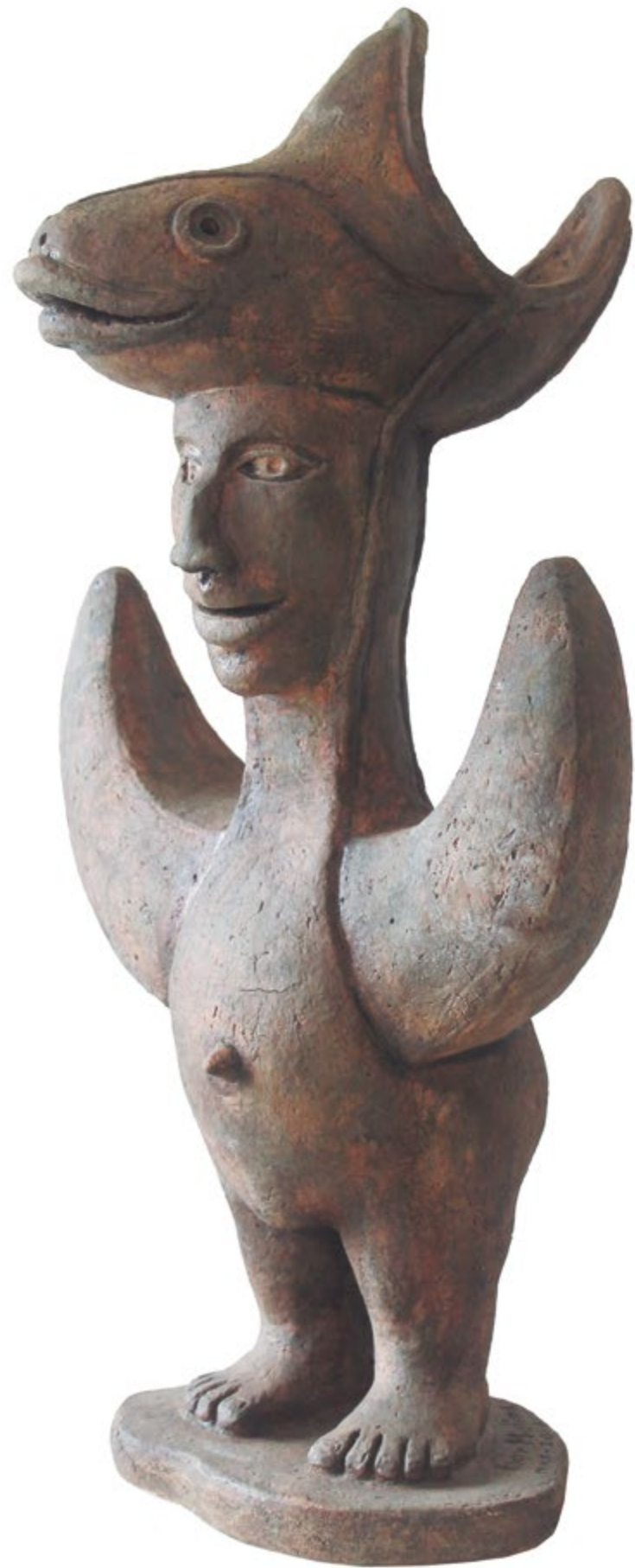
Hombre luna con pez Alt. 61 cm, anch. 29 cm, prof. 28 cm Barro de alta temperatura