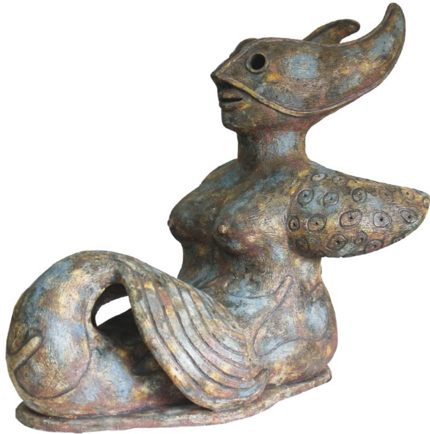
Sirenita Coqueta Alt. 70 cm, anch. 50 cm, prof. 80 cm Barro de alta temperatura