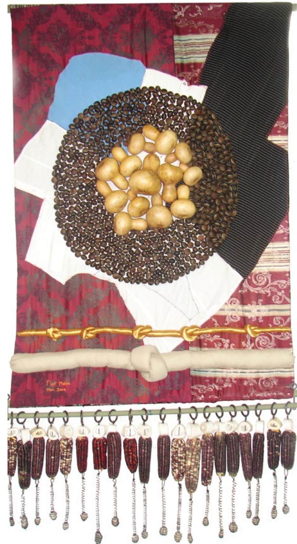
Collage con mazorcas 1.02 m x 1.50 m Tela, hilo, matatena, bules, piedras y huesos