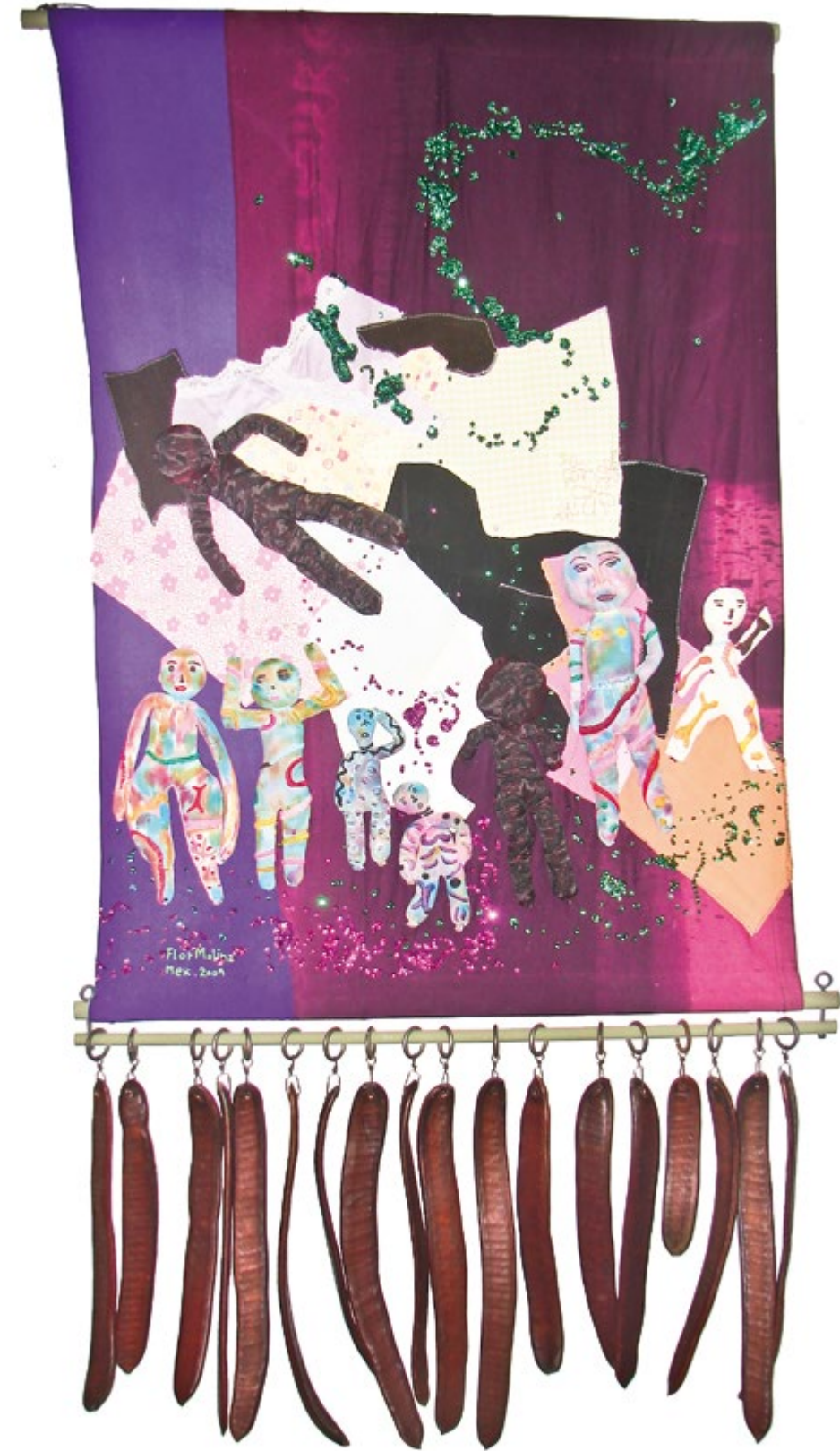
Collage con vainas de tabachin 1.02 m x 1.50 m Tela, hilo y lentejuela