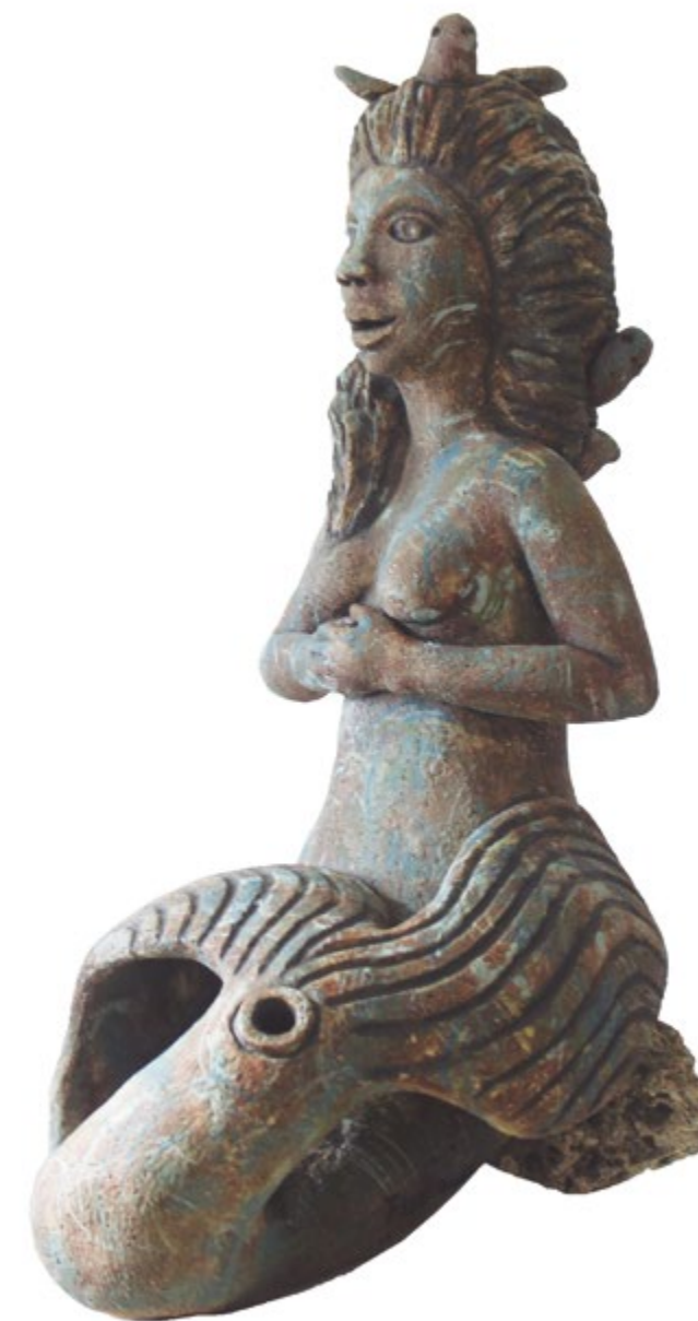
Sirena con tocado de aves Alt. 59 cm, anch. 26 cm, prof. 36 cm Barro de alta temperatura