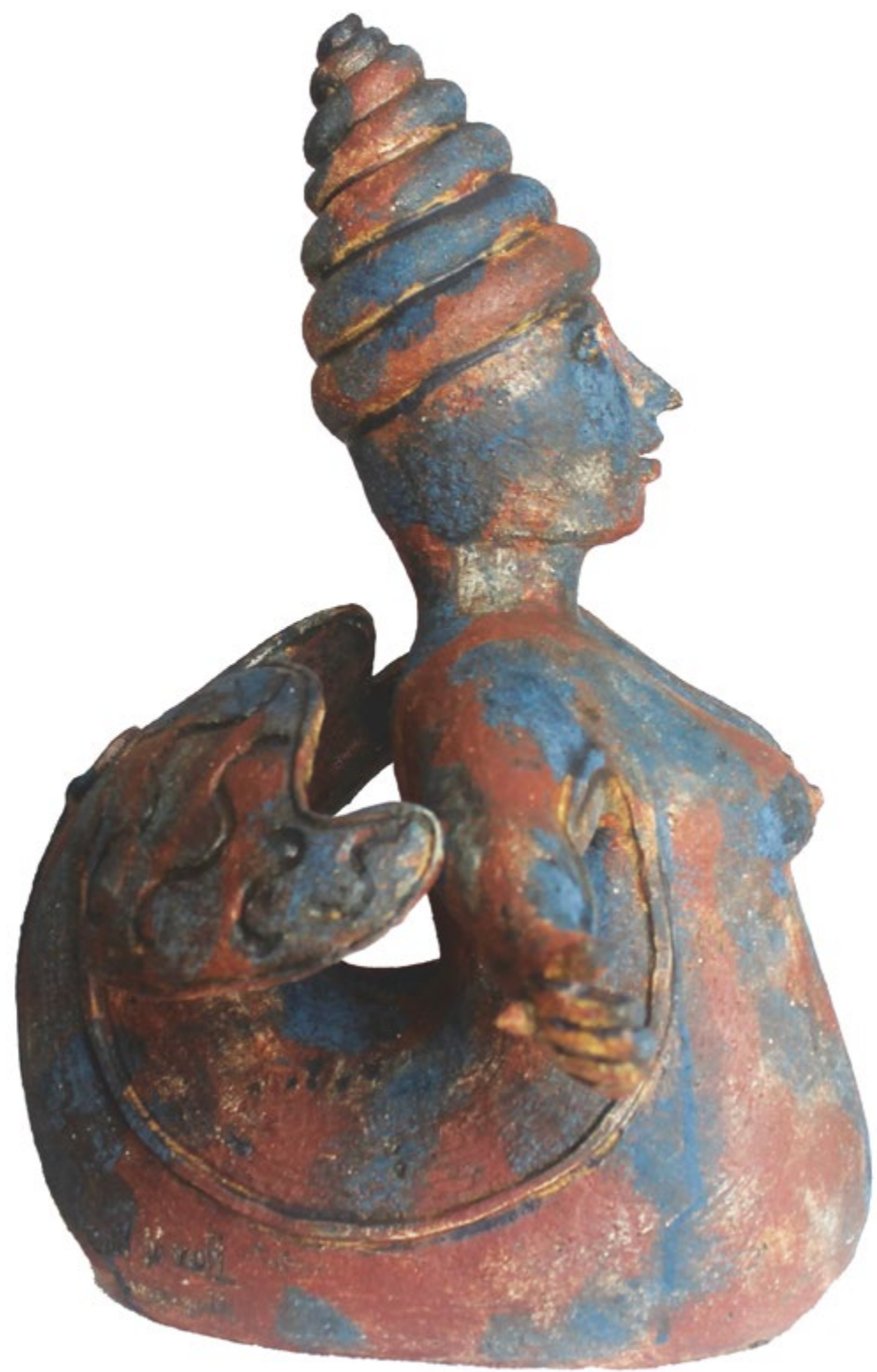
Sirena Malabarista Alt. 44 cm, anch. 52 cm, prof. 28 cm Barro de alta temperatura