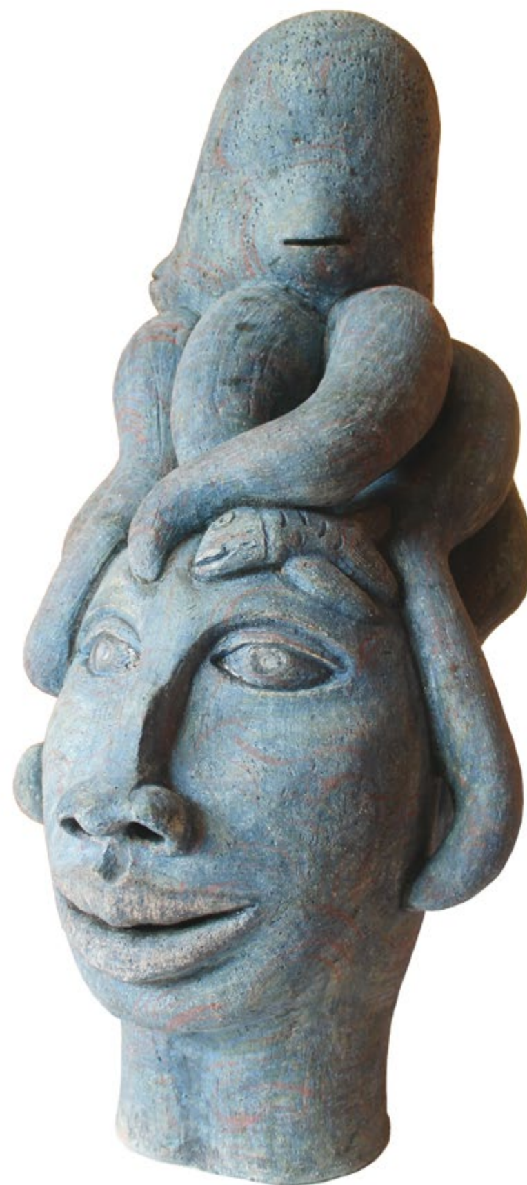
Mujer Tono Pulpo Alt. 60 cm, anch. 30 cm, prof. 40 cm Barro de alta temperatura