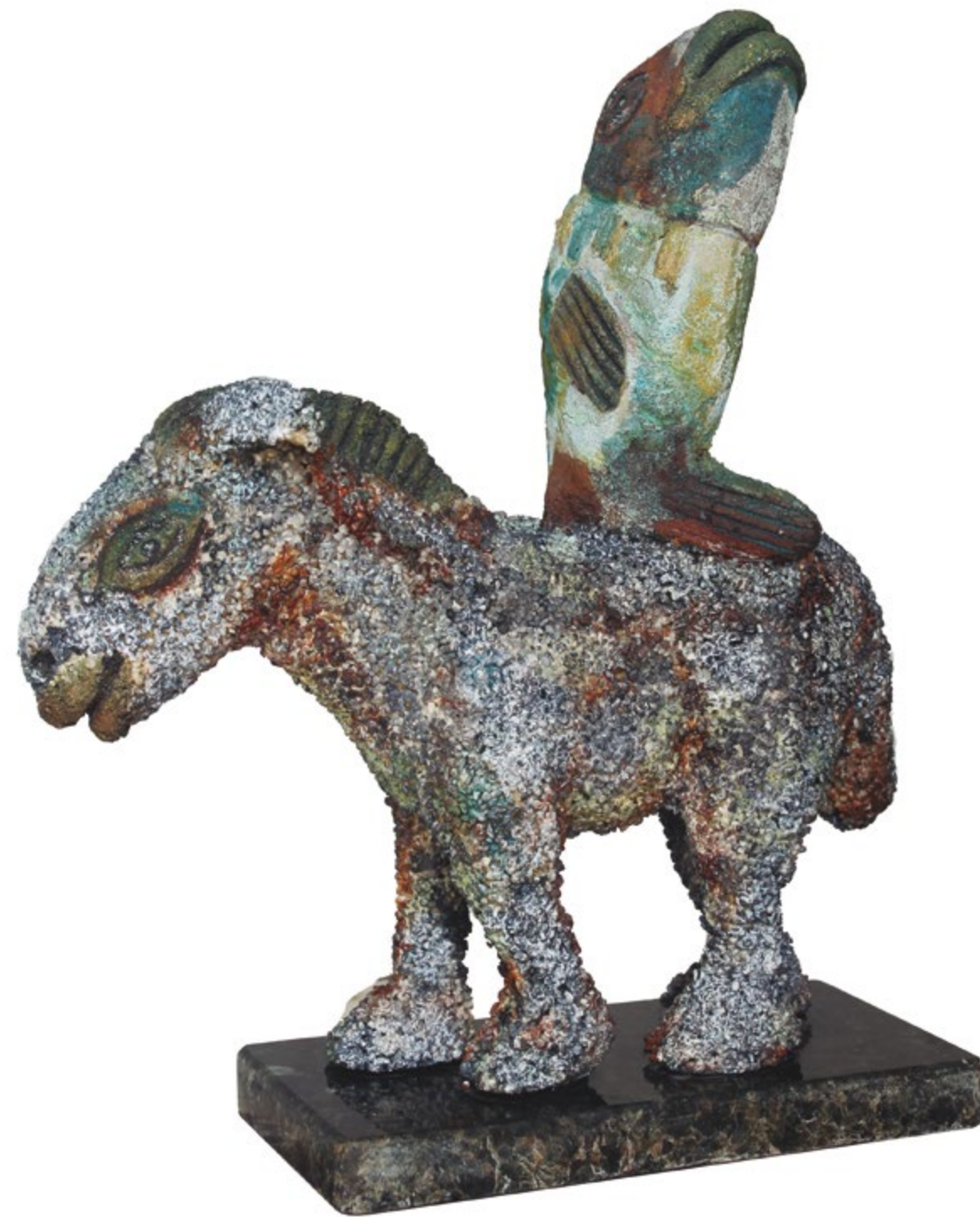
Burrito Feliz Alt. 30 cm, anch. 9 cm, prof. 25 cm Barro de alta temperatura