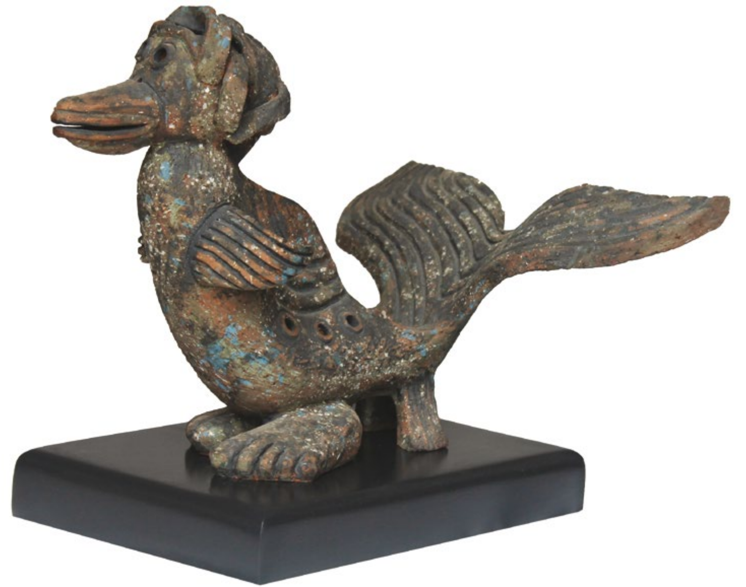
Pato Pez Alt. 24 cm, anch. 34 cm, prof. 29 cm Barro de alta temperatura