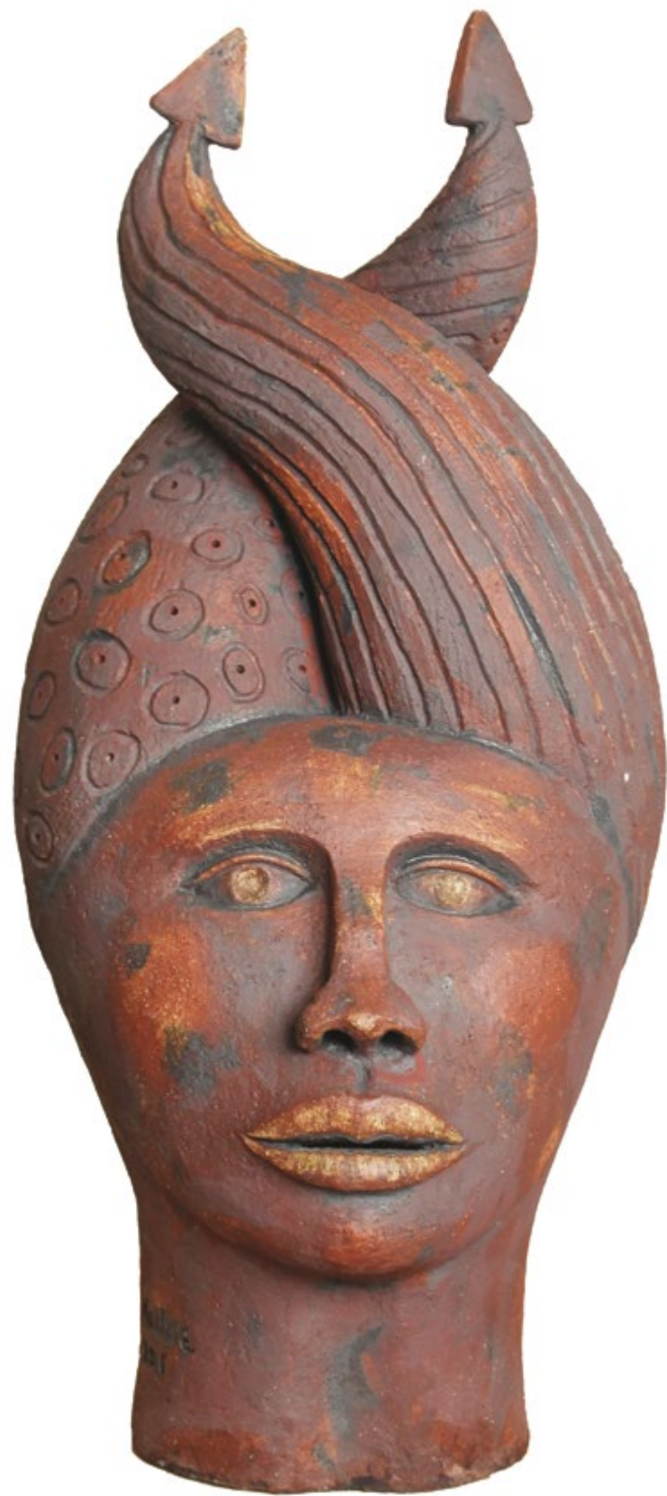
Cabeza Mulata Alt. 65 cm, anch. 32 cm, prof. 35 cm Barro de alta temperatura