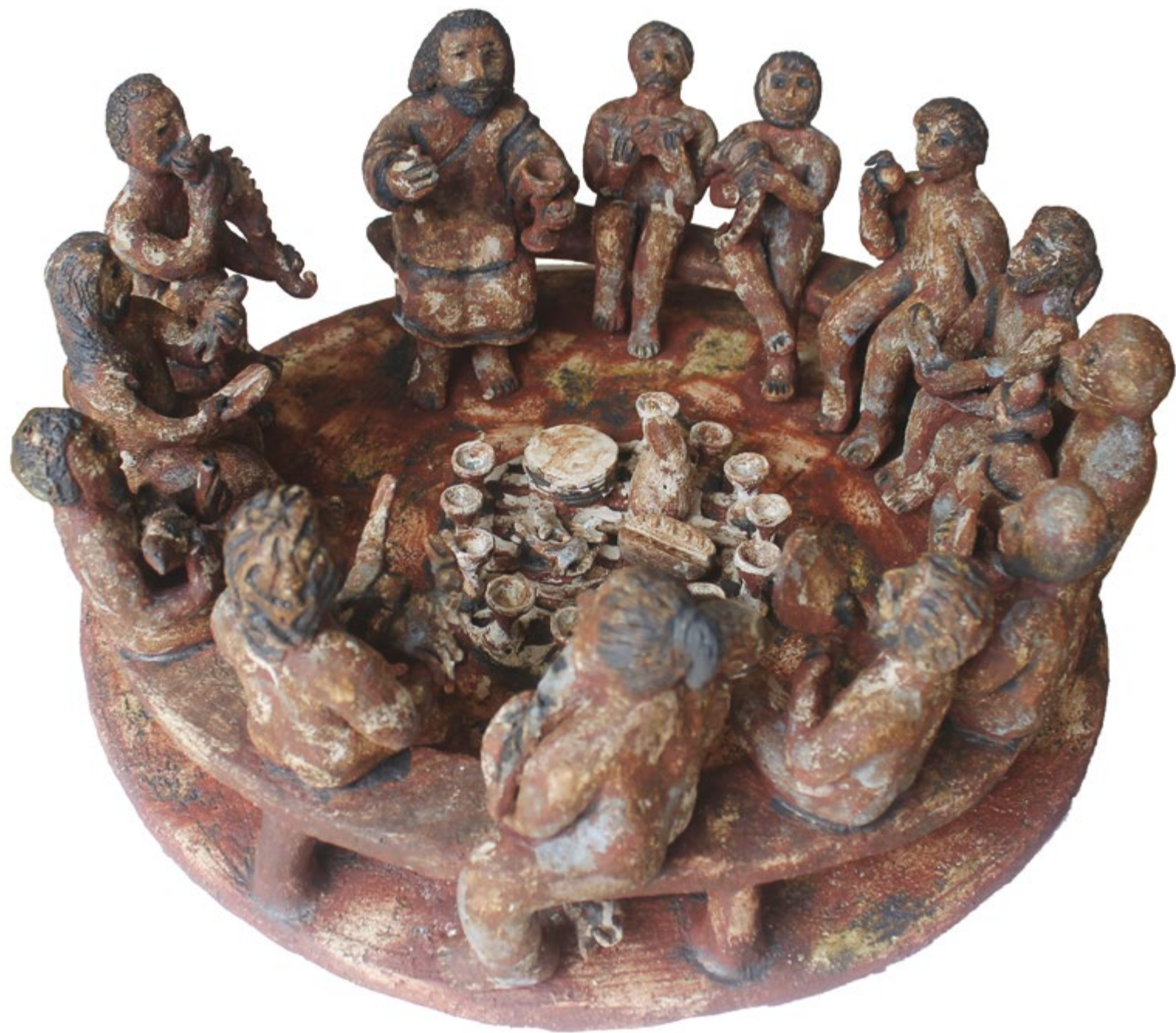
La Última Cena Diámetro 60 cm. alt. 25 cm Barro de alta temperatura