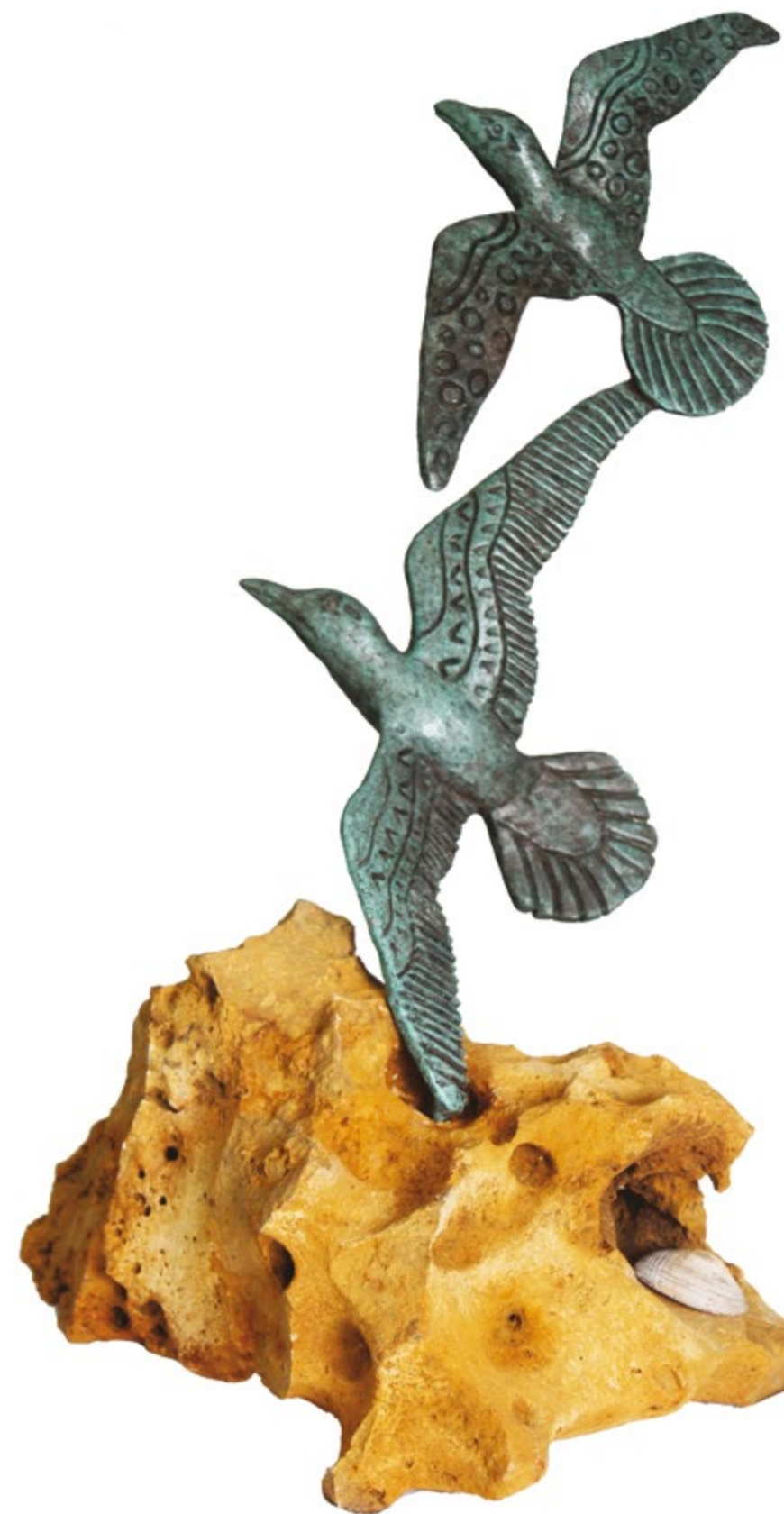
Gaviotas Alt. 28 cm, anch. 17 cm, prof. 3 cm Bronce