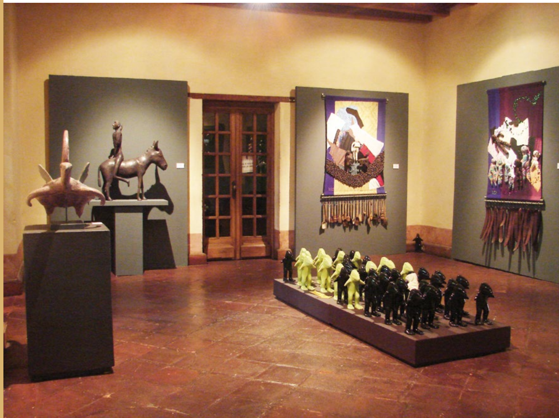
Marcha de hombres pez hacia Cuajinicuilapa 0.30 m x 0.15 m x 0.16 m Cerámica en alta temperatura