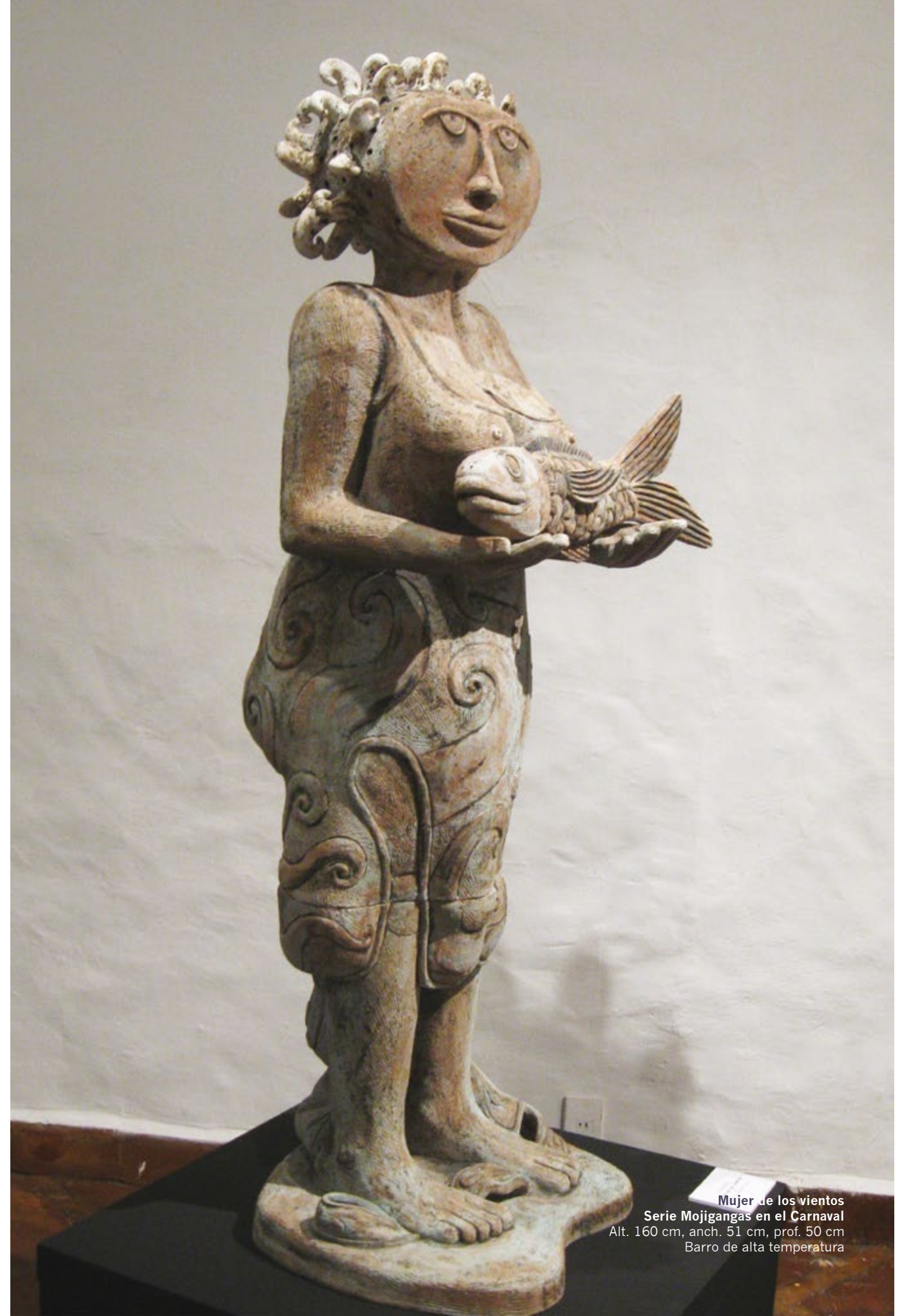
Mujer de los vientos Serie Mojigangas en el Carnaval Alt. 160 cm, anch. 51 cm, prof. 50 cm Barro de alta temperatura