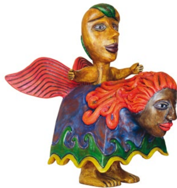
Santa Felipa Alt. 39 cm, prof. 37 cm, anch. 32 cm Resina