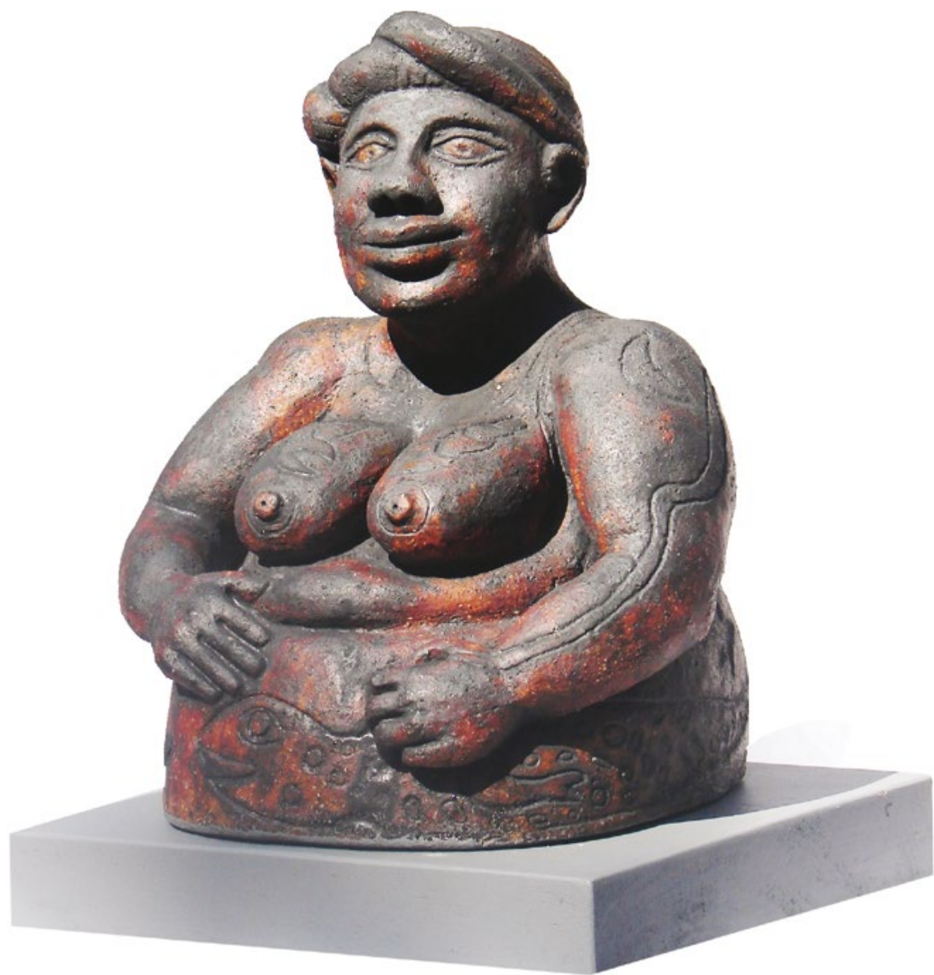
Estudio VII Alt. 28 cm, anch. 24 cm, prof. 22 cm Barro de alta temperatura