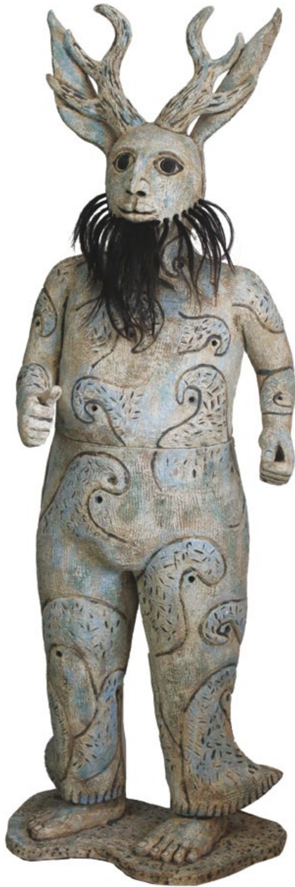
Diablo costeño Alt. 128 cm, anch. 44 cm, prof. 35 cm Barro de alta temperatura