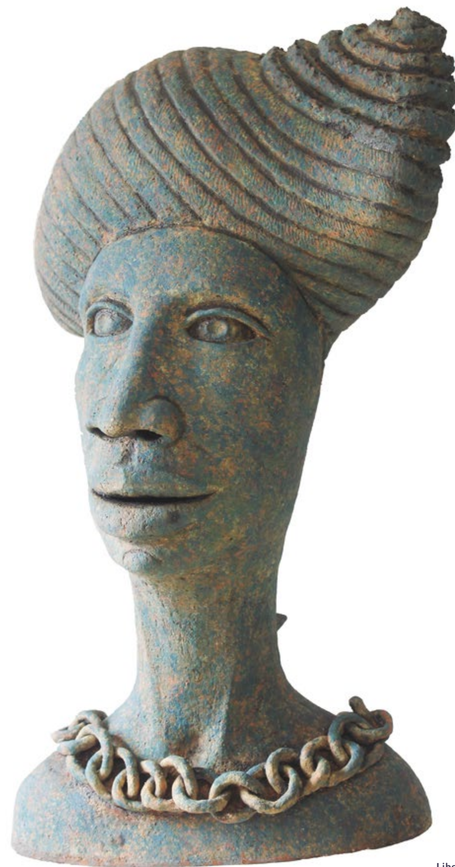
Libertad Alt. 69 cm, anch. 52 cm, prof. 38 cm Barro de alta temperatura