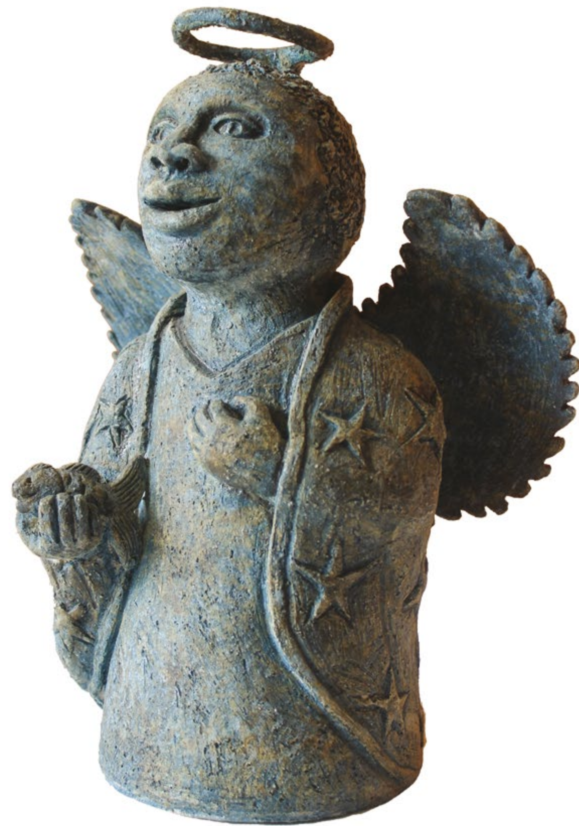
Angelito Costeño Alt. 37 cm, anch. 30 cm, prof. 20 cm Barro de alta temperatura