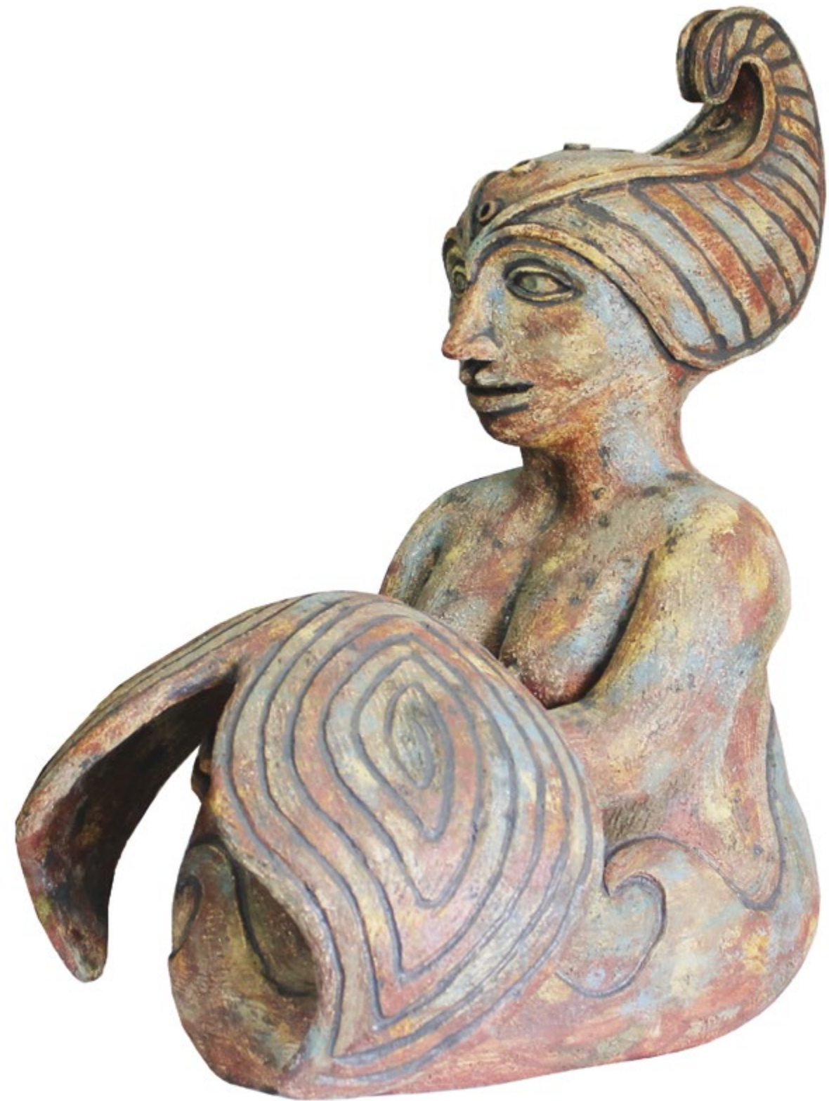
Almendrita Alt. 65 cm, anch. 40 cm, prof. 60 cm Barro de alta temperatura