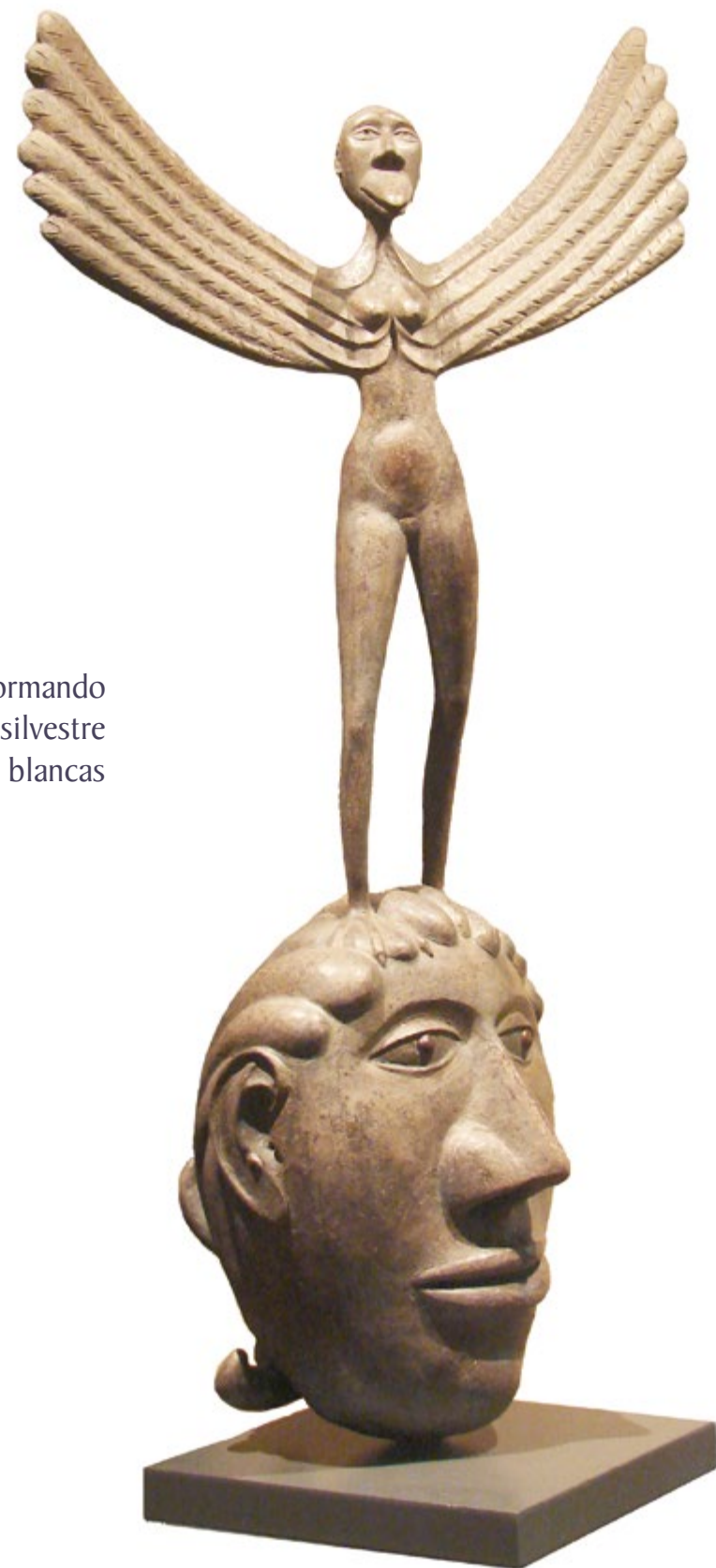
Mujer garza 90 cm anch. 165 cm alt. 55 cm prof. Técnica Bronce