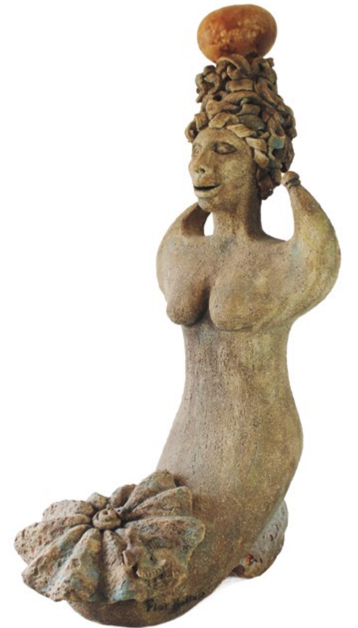
Sirena mulata 65 cm alt. 27 cm anch. 37 cm prof. Barro de alta temperatura