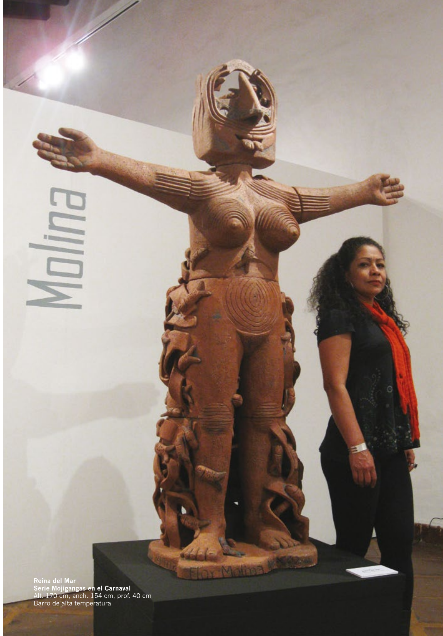
Reina del Mar Serie Mojigangas en el Carnaval Alt. 170 cm, anch. 154 cm, prof. 40 cm Barro de alta temperatura