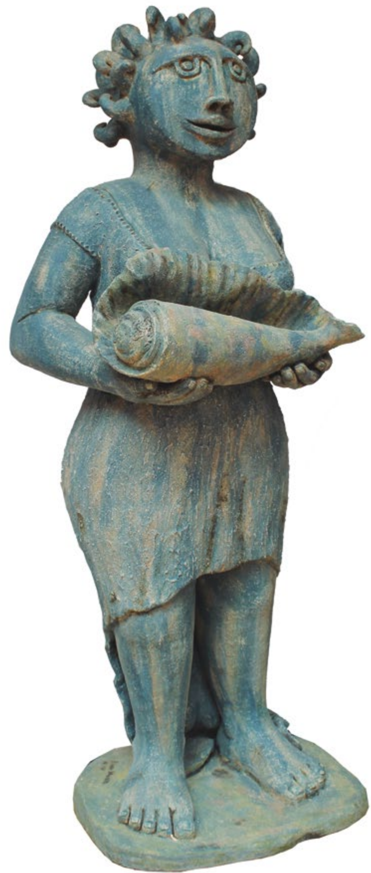
Mujer con caracol Alt. 108 cm, anch. 42 cm, prof. 30 cm Barro de alta temperatura