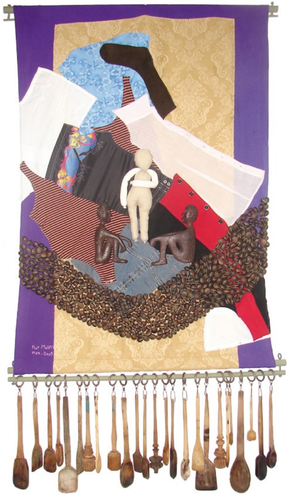
Collage con cucharas de madera 1.02 m x 1.50 m Tela, hilo, matatena