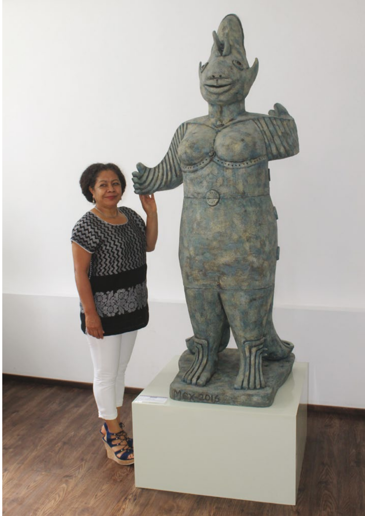
Diosa del Mar ▶ Alt. 194 cm, anch. 85 cm, prof. 70 cm Barro de alta temperatura